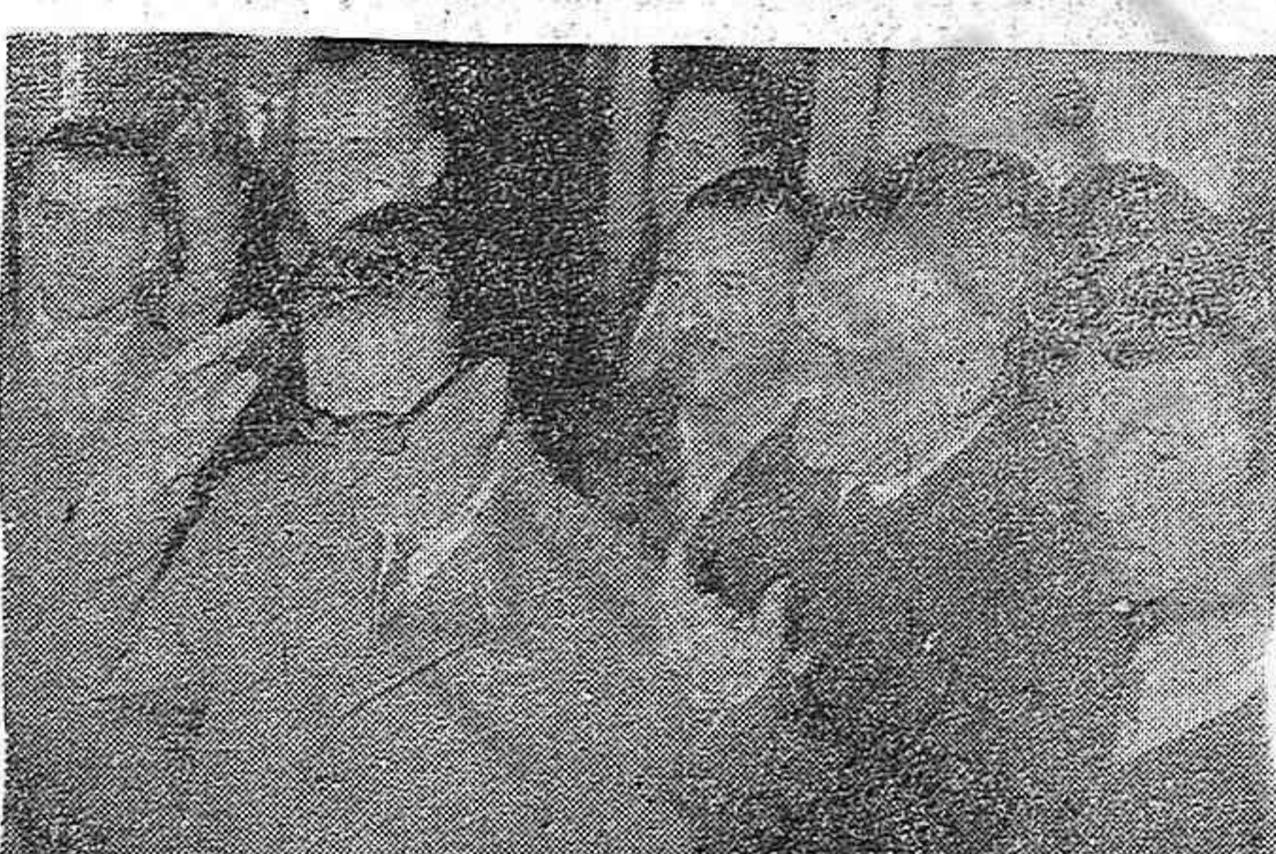
El senador Salvador Allende al llegar a Casa de España