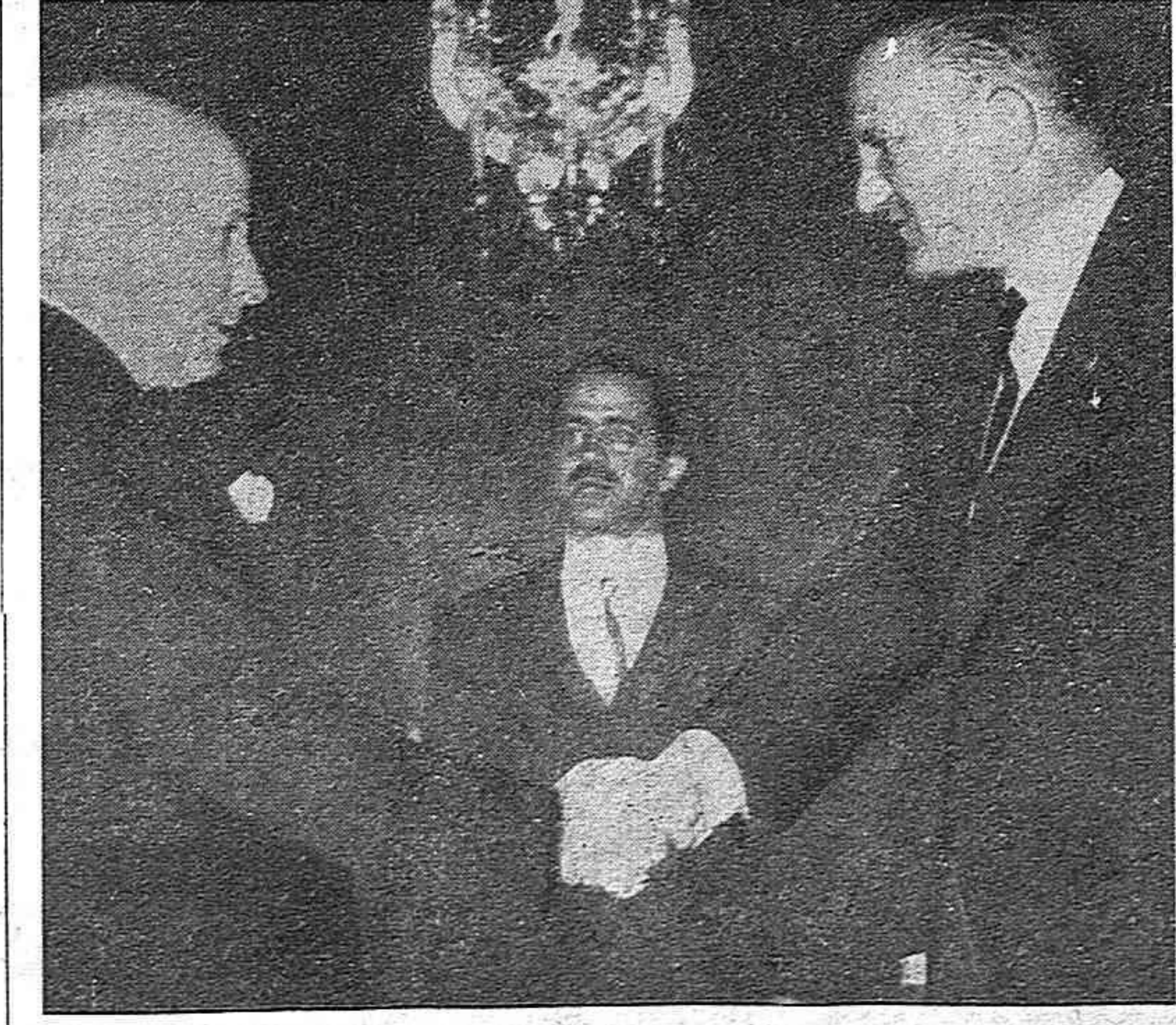
He aquí a Castiella, ministro de Negocios Extranjeros de la España franquista, apretando al dictador Salazar la solidaridad entrañable de su compinche y aliado en la misma aventura totalitaria, Francisco Franco. Este simbólico apretón de manos representa la conjunción de las dos dictaduras que asolan la Península Ibérica. Cuando esas mancas se separen, el fin del despotismo en España y Portugal habrá llegado.