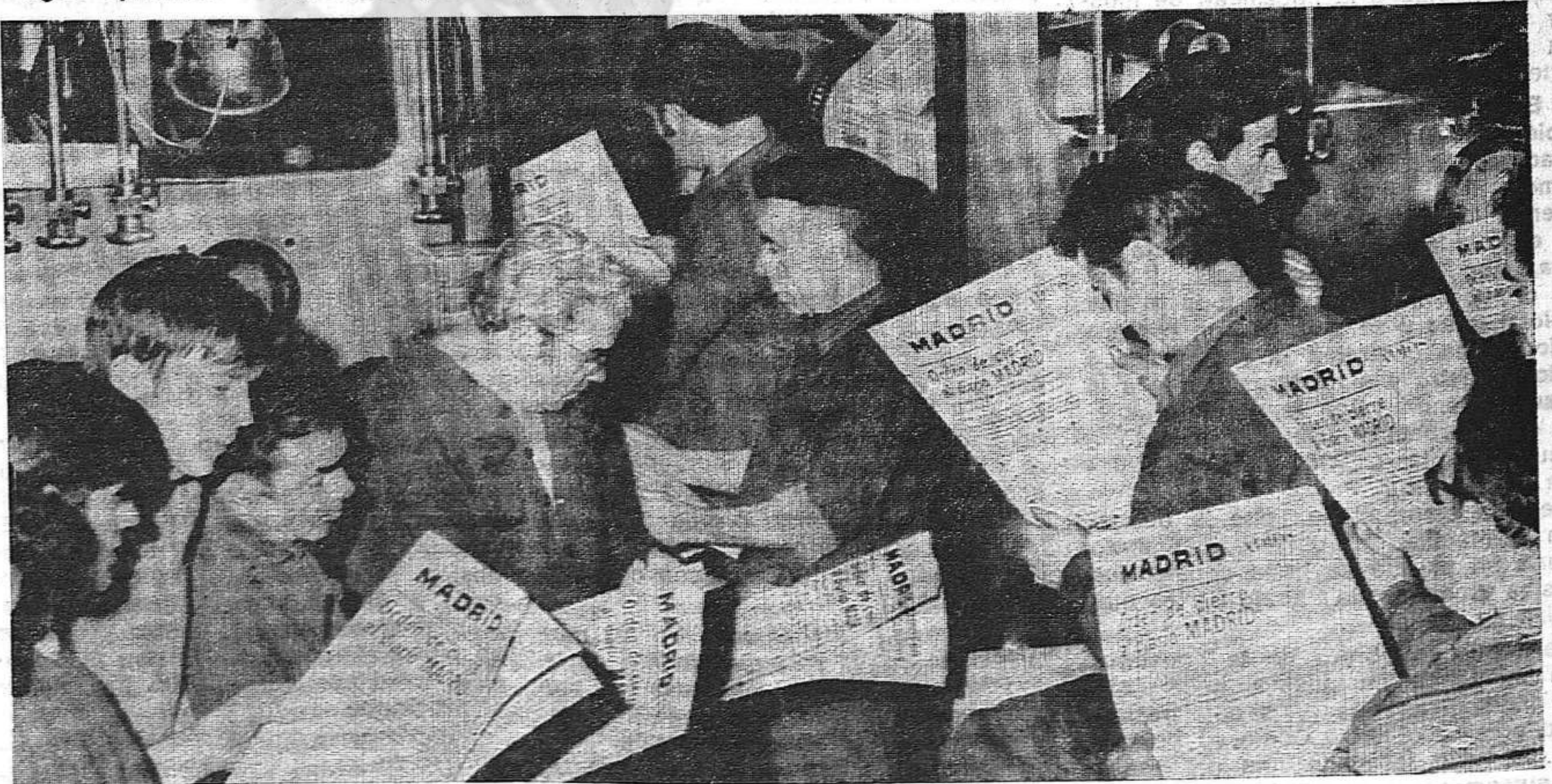
Ante la rotativa, el personal de talleres de « MADRID » con el último número...

En otro diario se precisa que estos dos aparatos, esta vez, realizaban un vuelo de maniobras sin armamento nuclear... Pero ¿y las otras veces? ¿y los otros aparatos, que sí llevan cargas nucleares?