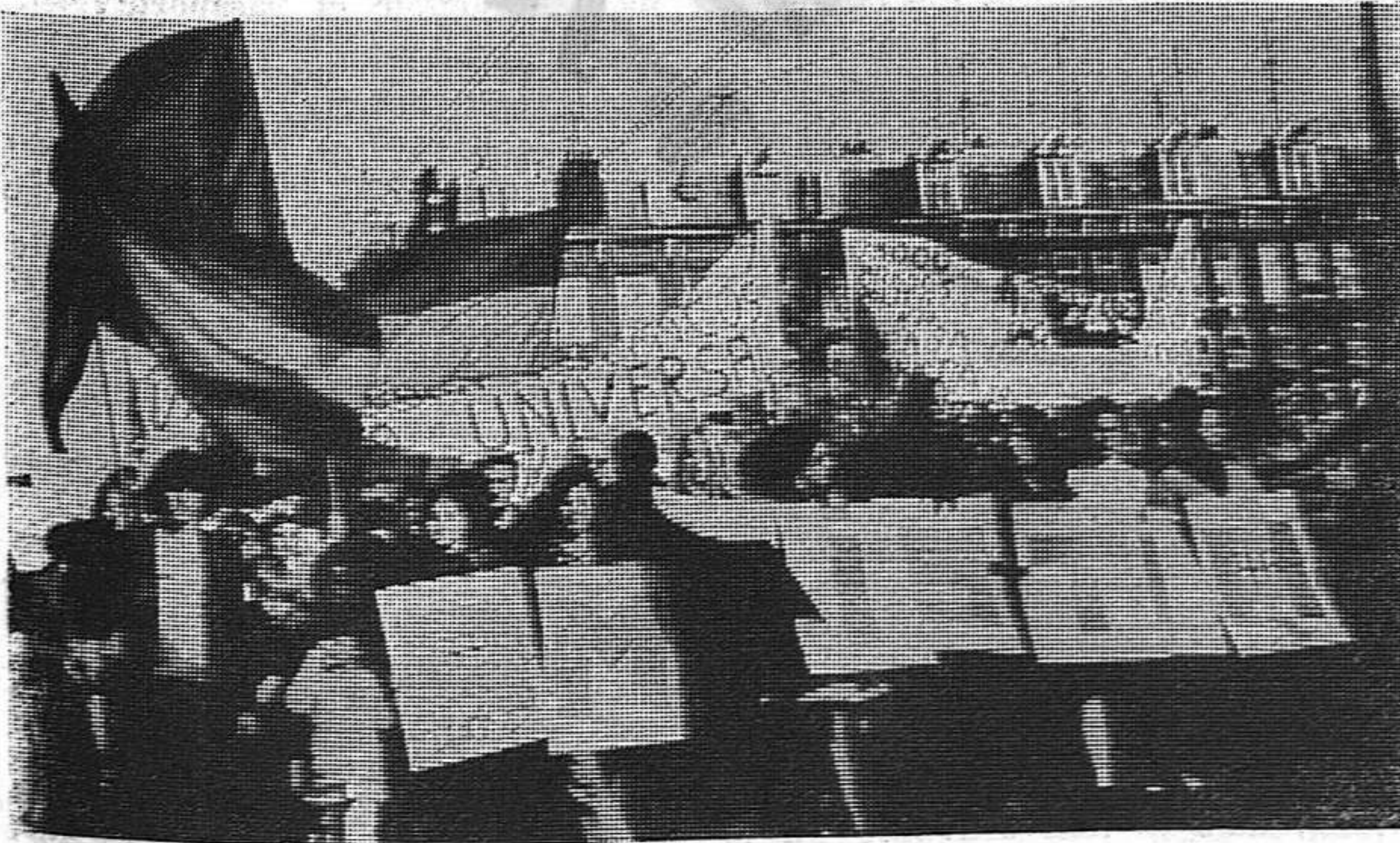
La manifestación de Amsterdam