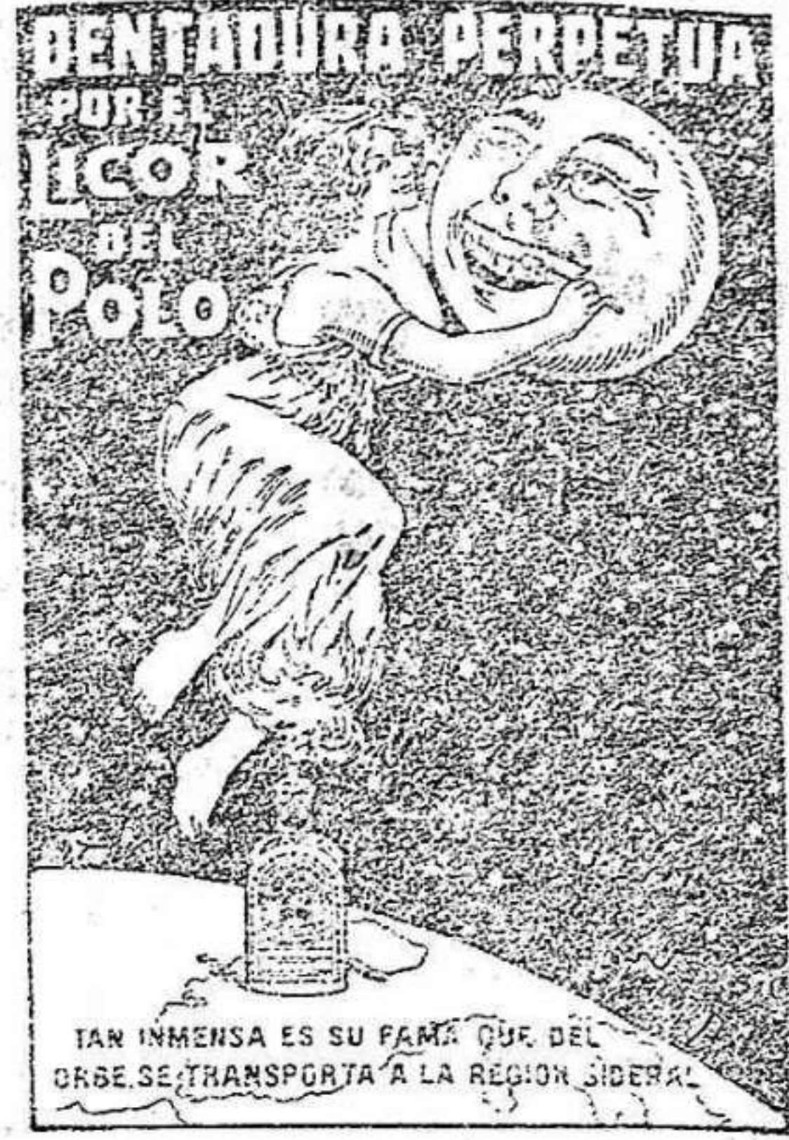
UNA INMENSA ES SU FAMA QUE DEL ORBE SE TRANSPORTA A LA REGION SIDERAL