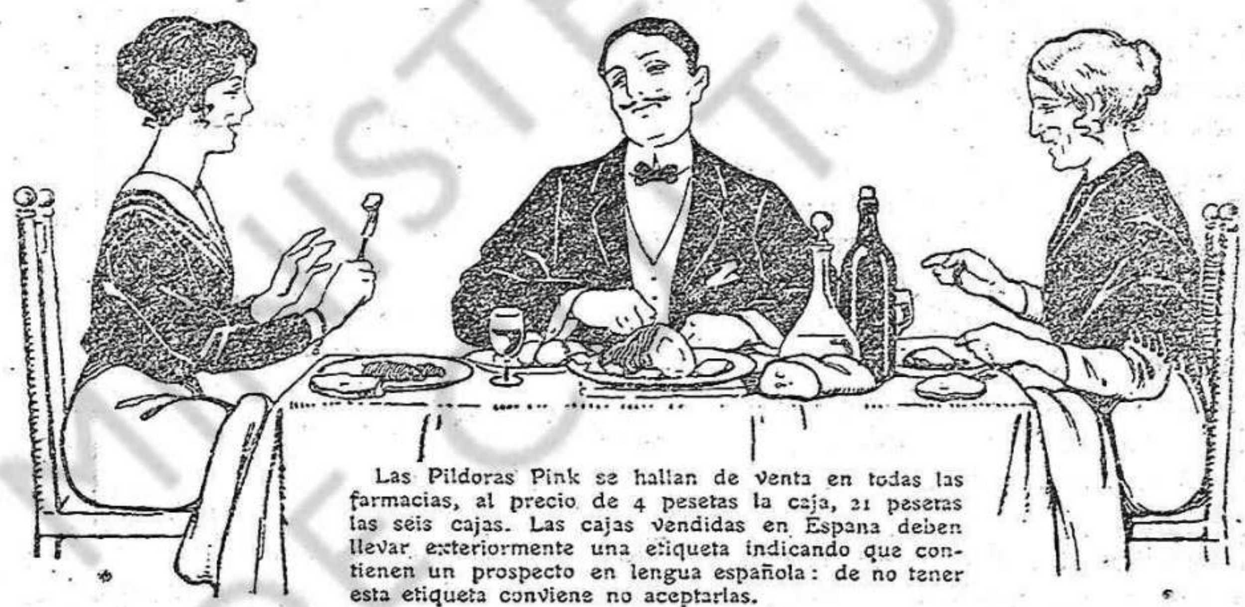
Las Píldoras Pink se hallan de venta en todas las farmacias, al precio de 4 pesetas la caja, 21 pesetas las seis cajas. Las cajas vendidas en España deben llevar exteriormente una etiqueta indicando que contienen un prospecto en lengua española: de no tener esta etiqueta conviene no aceptarlas.