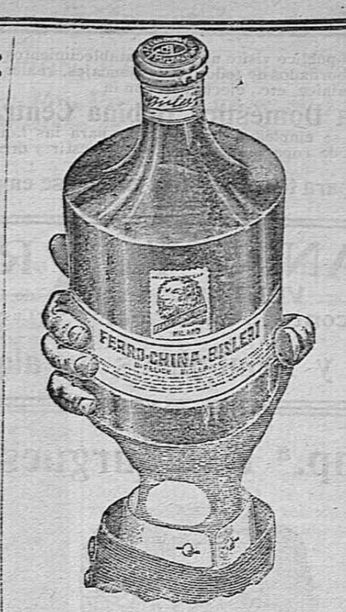
Ferro - Quina - Bisleri. APERITIVO HIGIÉNICO. Reconstituyente de primer orden...