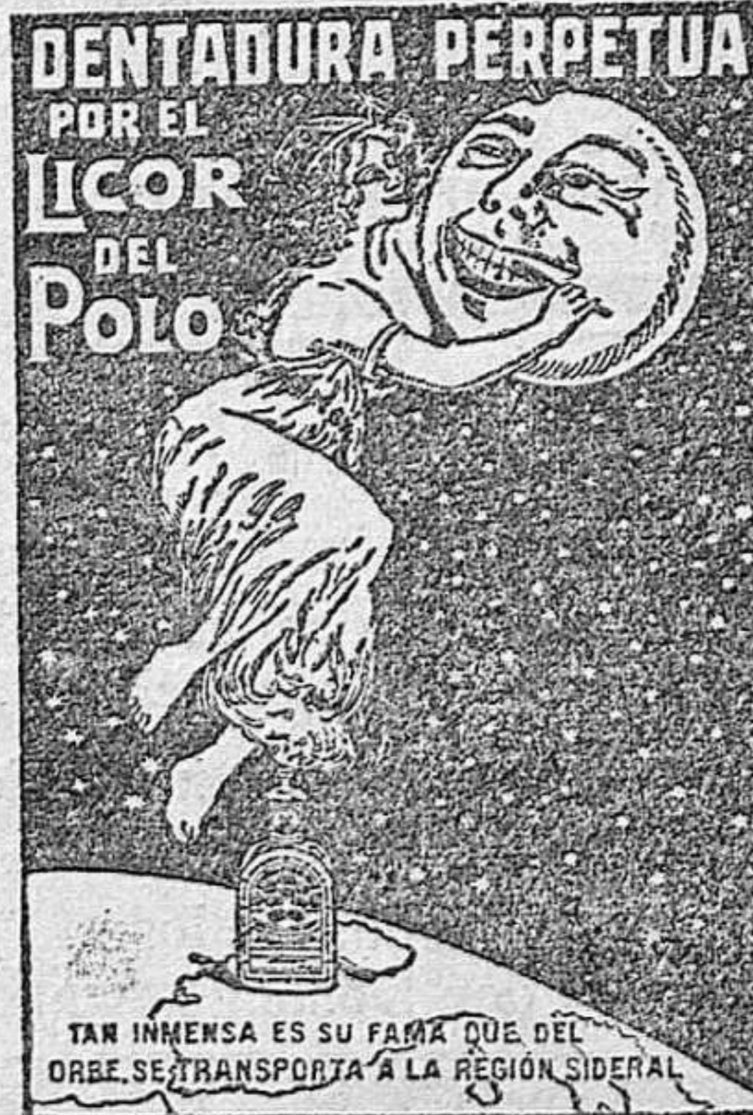
TAN INMENSA ES SU FAMA QUE DEL ORBE SE TRANSPORTA A LA REGION SIDERAL