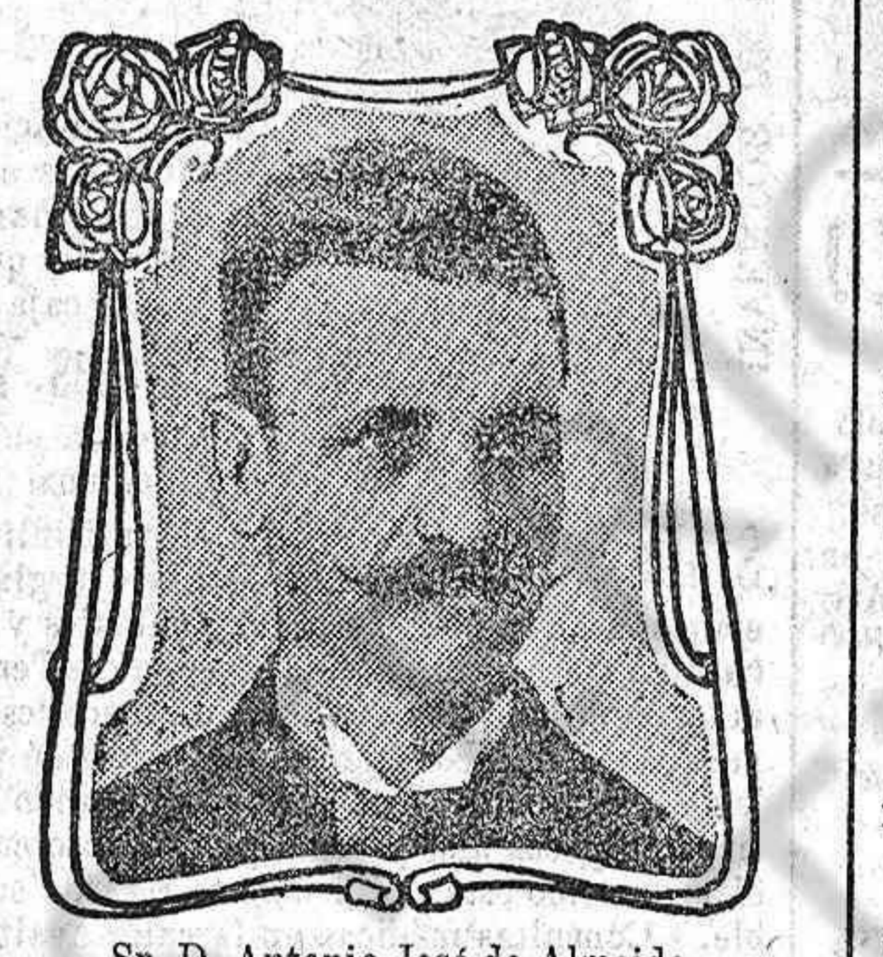
Sr. D. Antonio José de Almeida

En verano comemos tanto como en invierno y sin embargo deberíamos comer menos. Es incontestable que la facultad de asimilación de los alimentos es menos activa en verano que en invierno. Esto se comprende fácilmente; comemos para darnos fuerza y calor. En verano, el calor de la temperatura nos es suficiente y necesitamos pedir menos calor a los alimentos. Los estómagos se tornan perezosos, y bajo la influencia de los platos fuertes, ácidos y bebidas demasiado frescas, se descomponen. Entonces ya no digieren y los alimentos quedan detenidos en el estómago donde se corrompen en vez de ser digeridos. Recordad que las Píldoras Pink son un excelente medicamento para desinfectar,