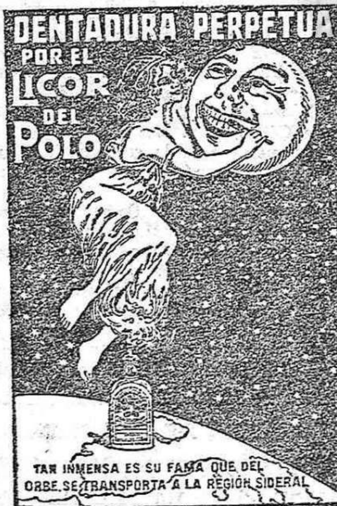
TAN INMENSA ES SU FAMA QUE DEL ORBE SE TRANSPORTA A LA REGION SIDERAL