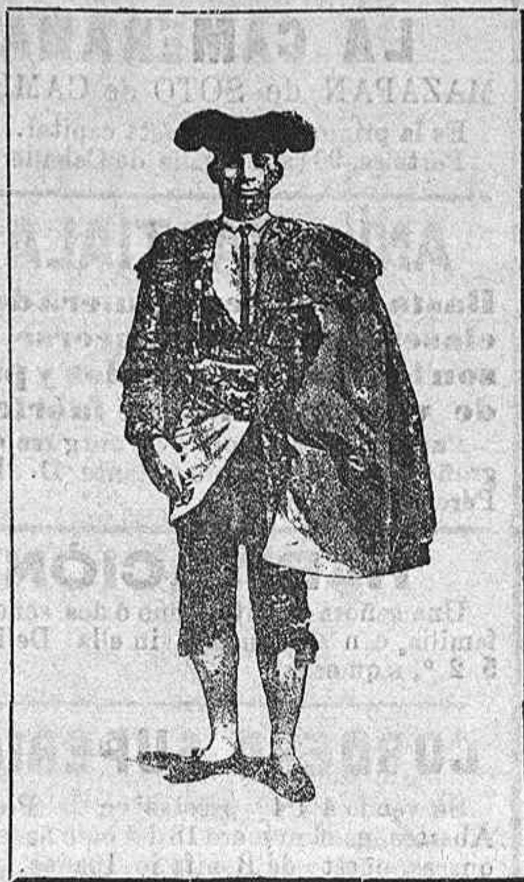
RAFAEL GUERRA «GUERRITA»