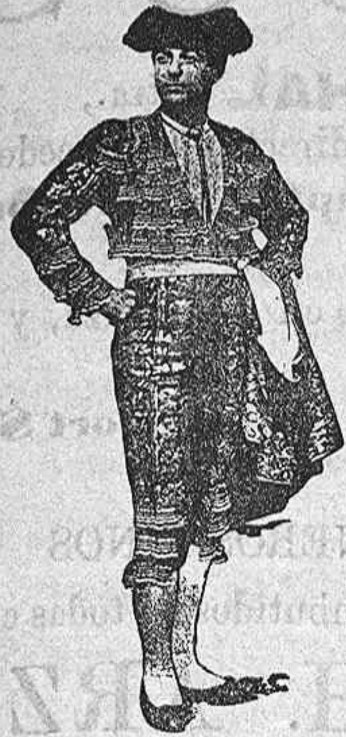
LUIS MAZZANTINI Y EGÜÍA

Desde el extenso y fértil llano de Alfaro hasta los vericuetos de nuestra Sierra, de Cervera y Arnedo, a Nájera y Haro tan sólo suena un nombre, que es el de «Guerra» «Guerra», grita la moza de Cenicero, «Guerra», repite un guapo de Cuzcurrita, «Guerra», contesta un chulo que es muy «torero», «Guerra» el Califa, el monstruo, Guerra, Guerrita. Y Guerra armó la idem; valiente cisco, y a verlo vienen miles de forasteros en tren, en diligencia y a uso de arrieros y algunos en el coche... de San Francisco. Y en las calles y plazas es un jaleo, todas llenas de gentes, gentes felices, que vienen a los toros de San Mateo: conquie, a ver, San Mateo, no nos bautices.