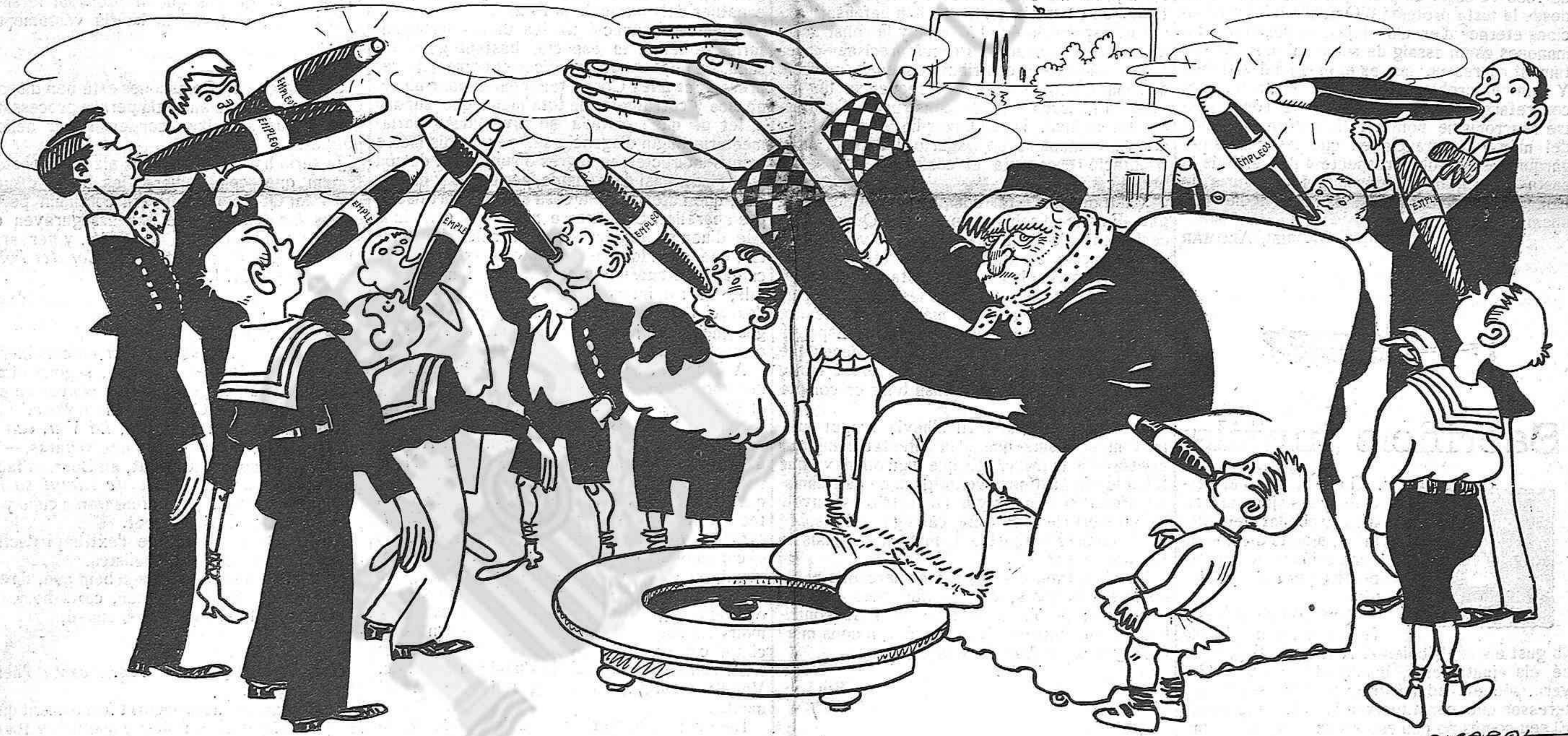
— Fumeu, minyons, fumeu..., que'l fumar també escalfa, poc o molt.