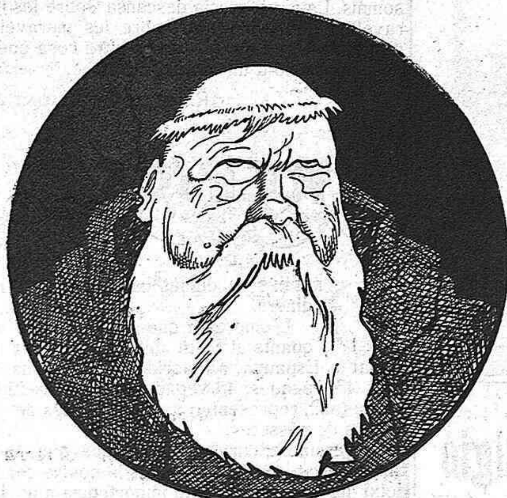
—Fòra de Filipines, fòra de Fransa, fòra d'Espanya... ¿Ont anirem, doncs, a fer mal?