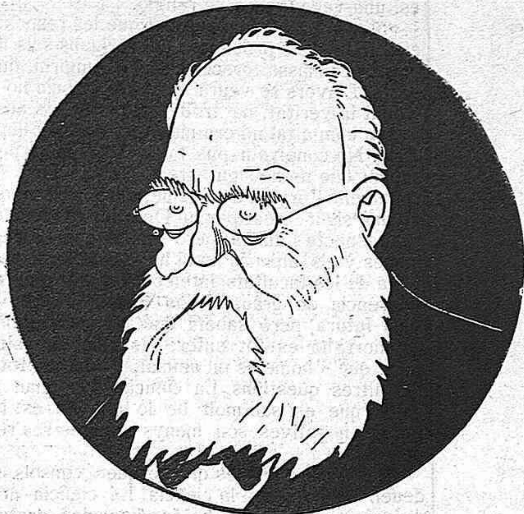
—¡Duro, Duro!... Ara va be!...