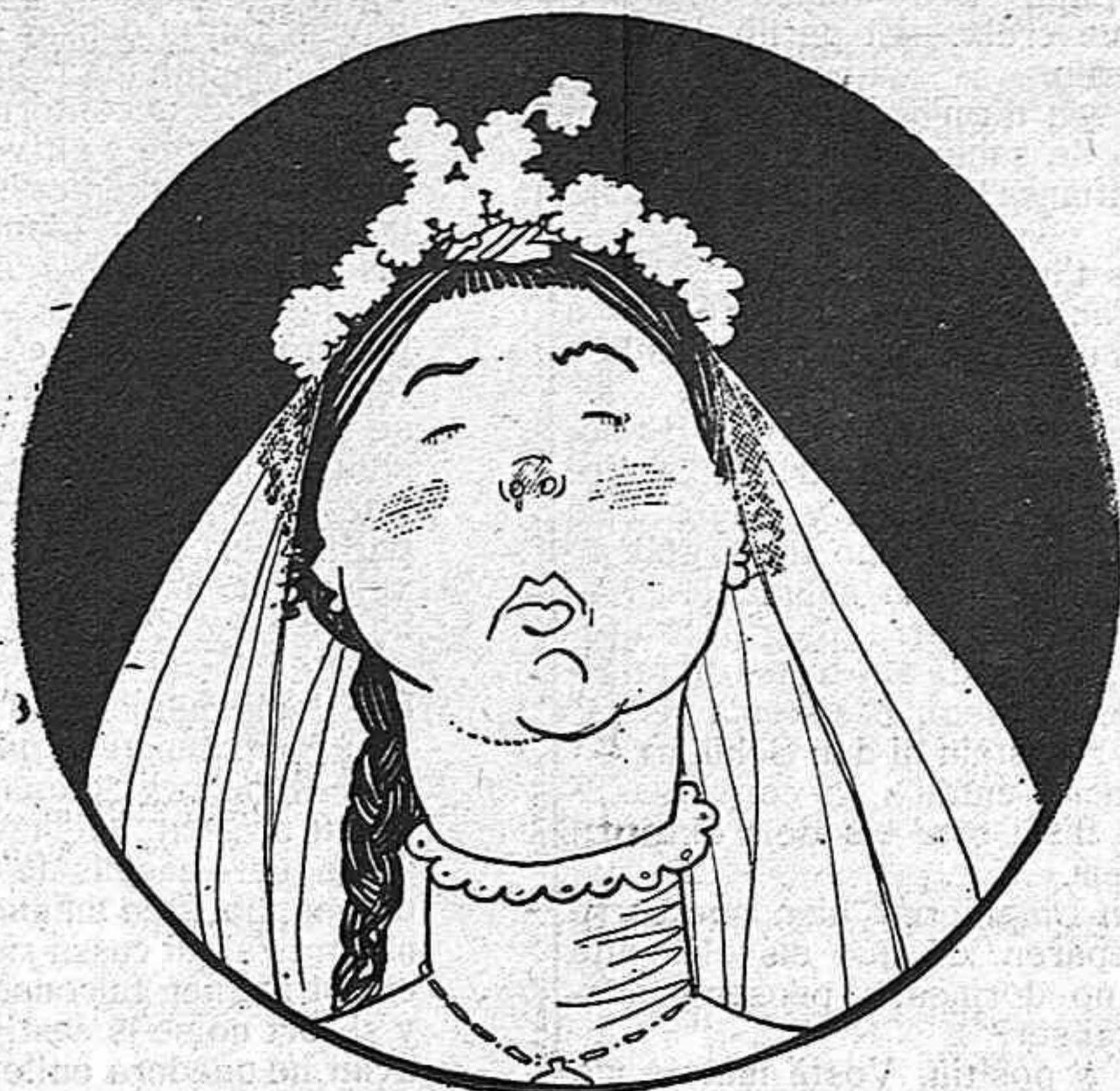
—¿No volen associacions?... ¿Es a dir que'l vicari y nosaltres haurem de disividirnos ?