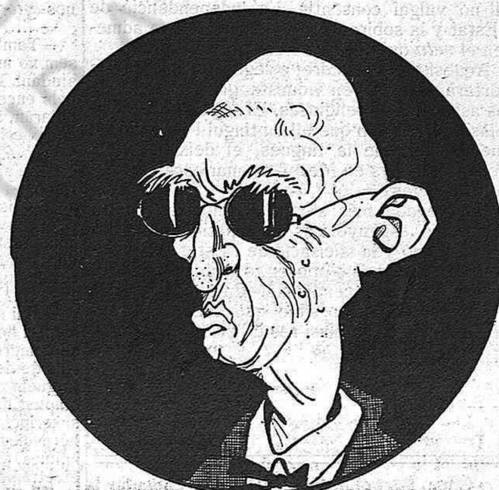
—Avui se reuneix el Comitè, y a veure què's determina.