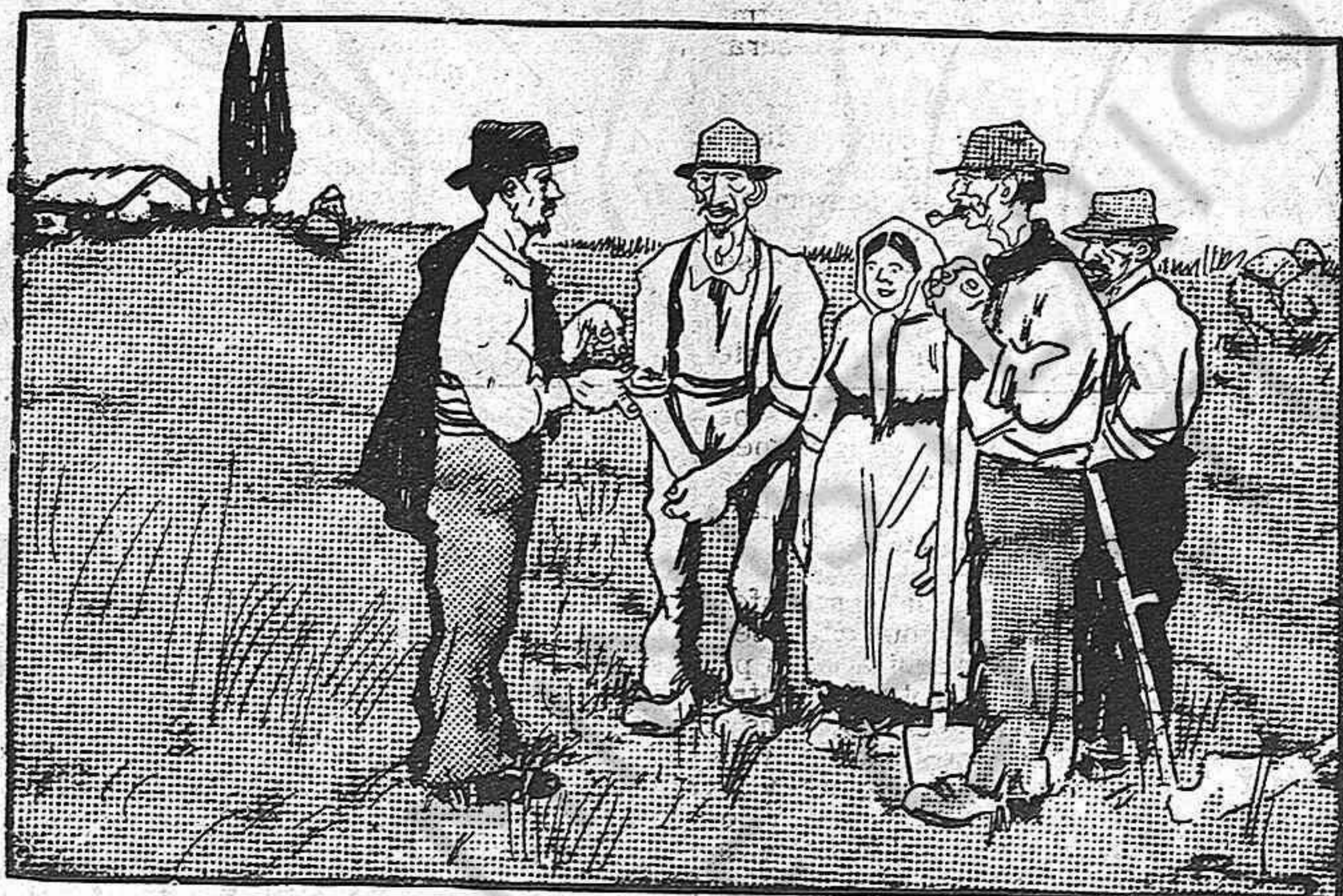
EL SOCIALISTA.— Lo qual vol dir, amics meus, que ls rics tindran dues bonas vides: una al cel... y una a la terra.