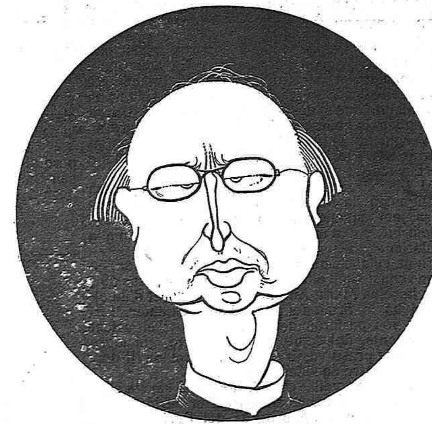
—¿En Canalejas cuantra els frares?... ¡Ja va!... Me sembla que si no ho arreglem nosaltres...