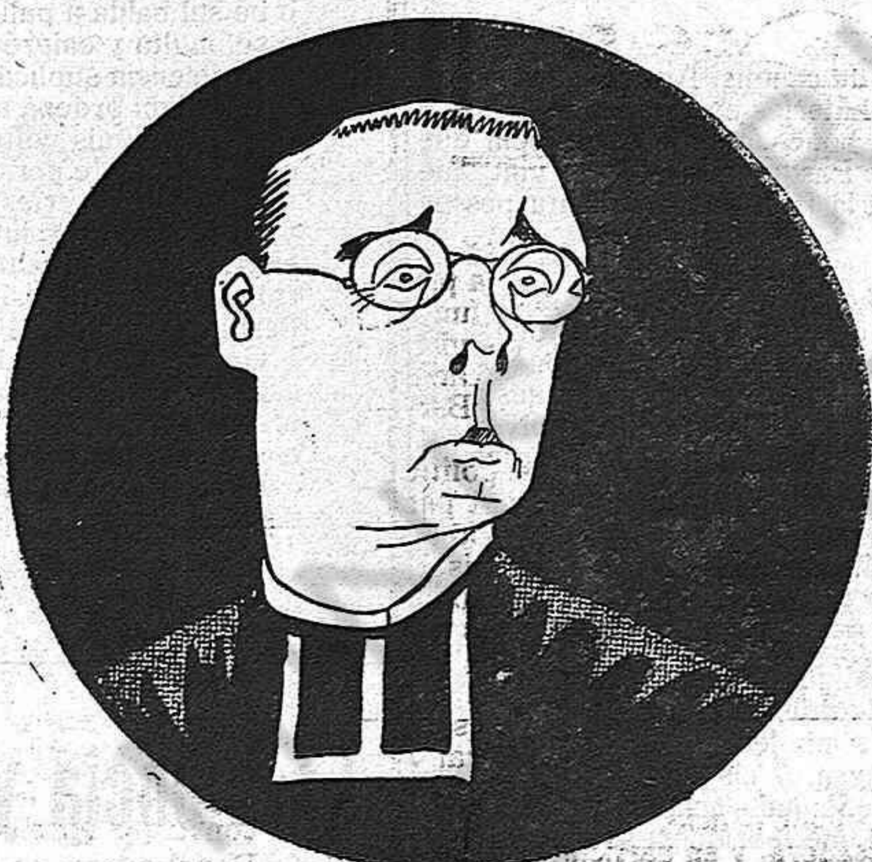
—Lo que es jo, ja ho tinc pensar: me fare torero.