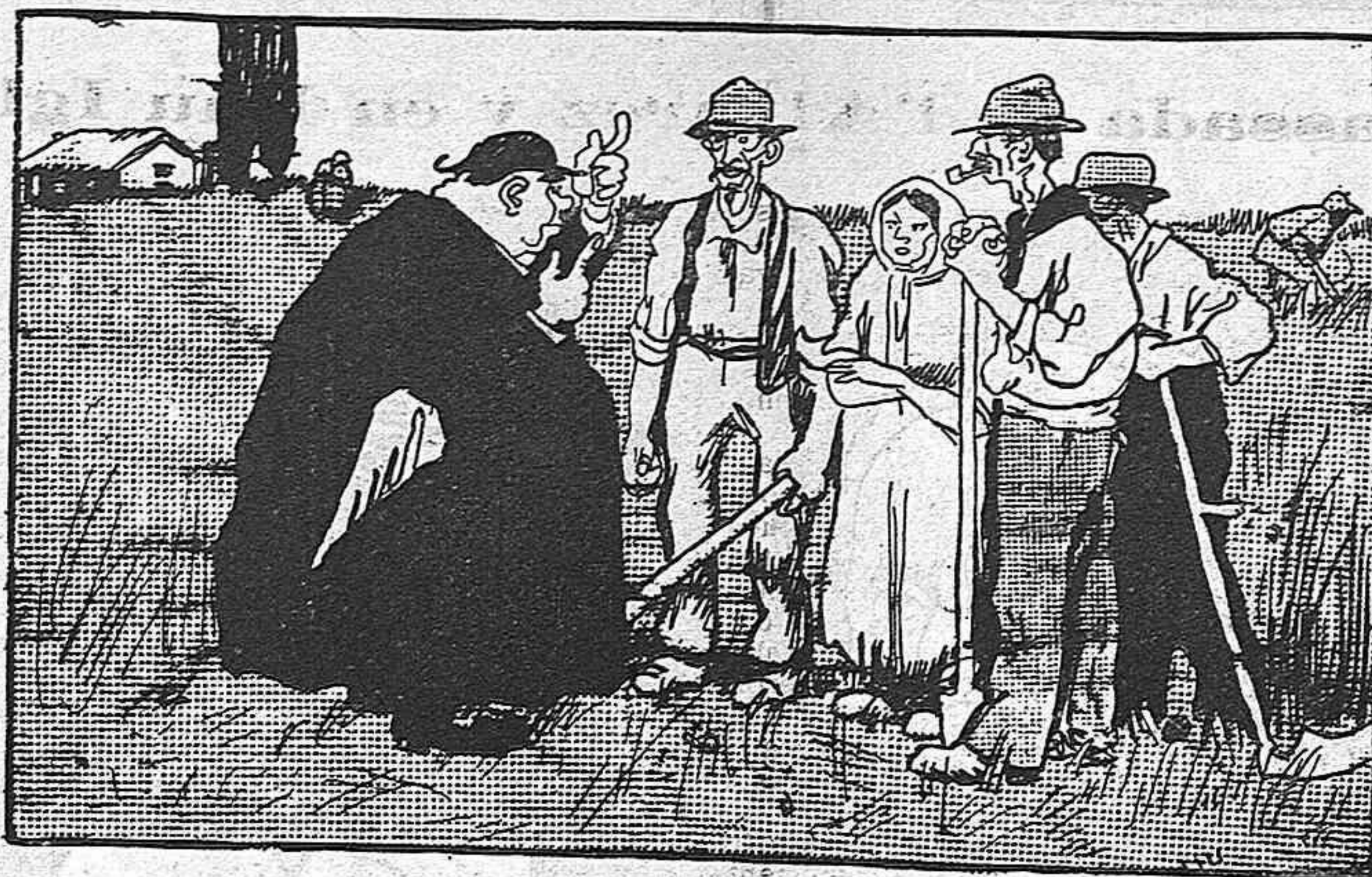
EL CAPELLÀ.— No'ls envejeu, fills meus, an els que tenen quartos. La bona vida es al cel.