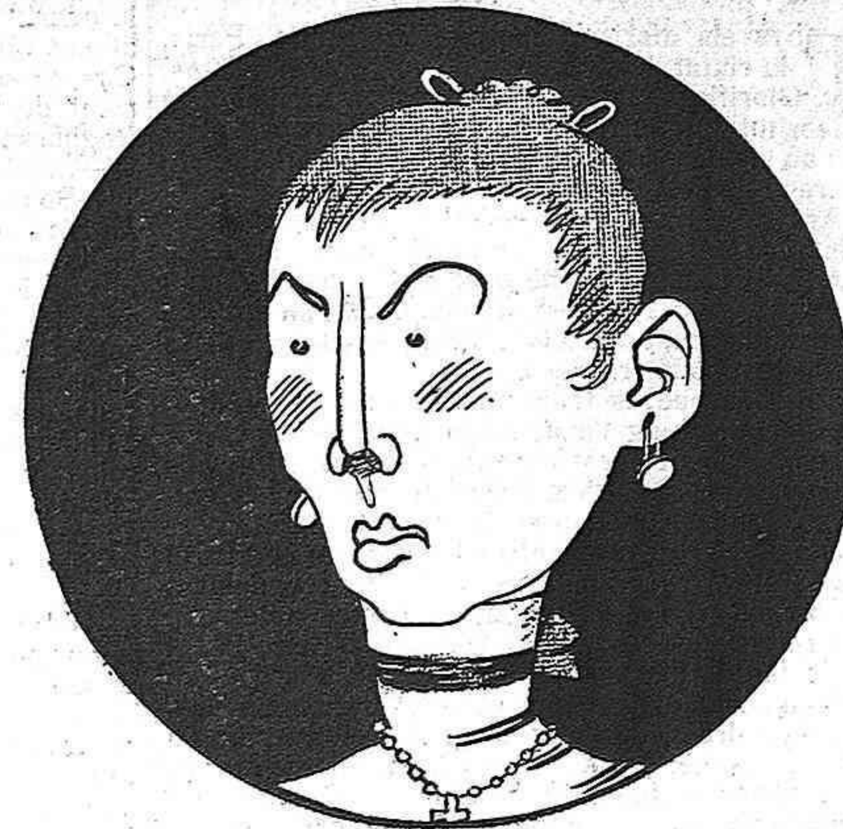
—Si els salessians se'n van, jo m'en vaigs ab ells.