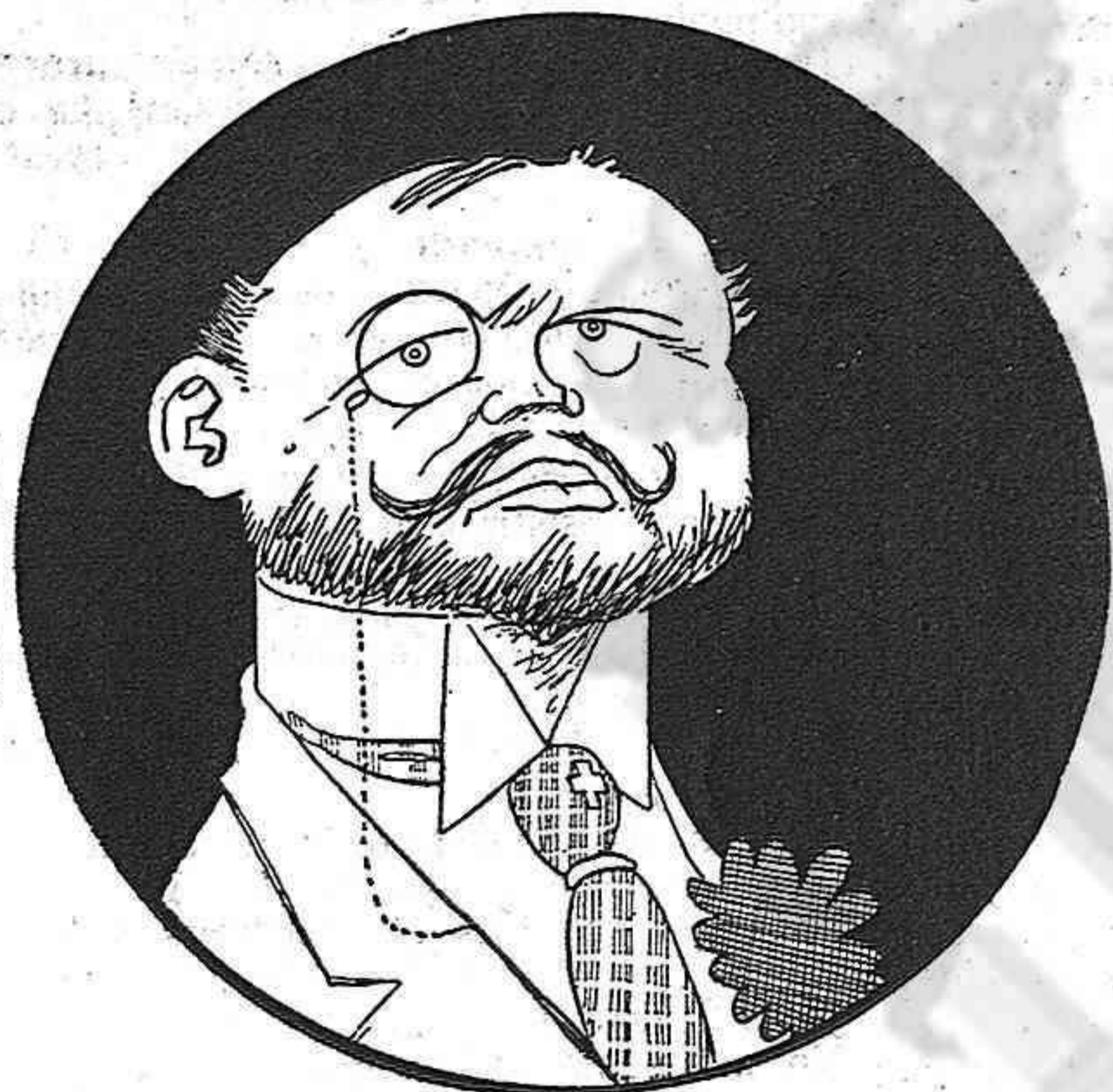
—Vaja, bona nit professons lluides!...