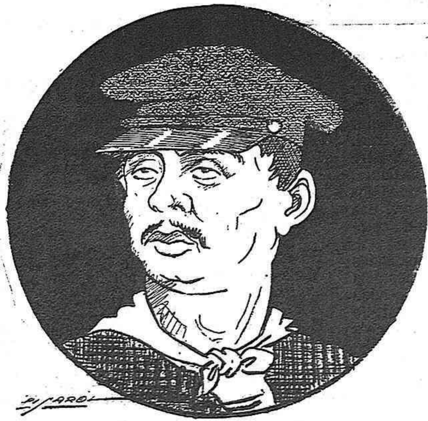
—¿Fins pera tocar l'orgue haurem de pagar contribució?