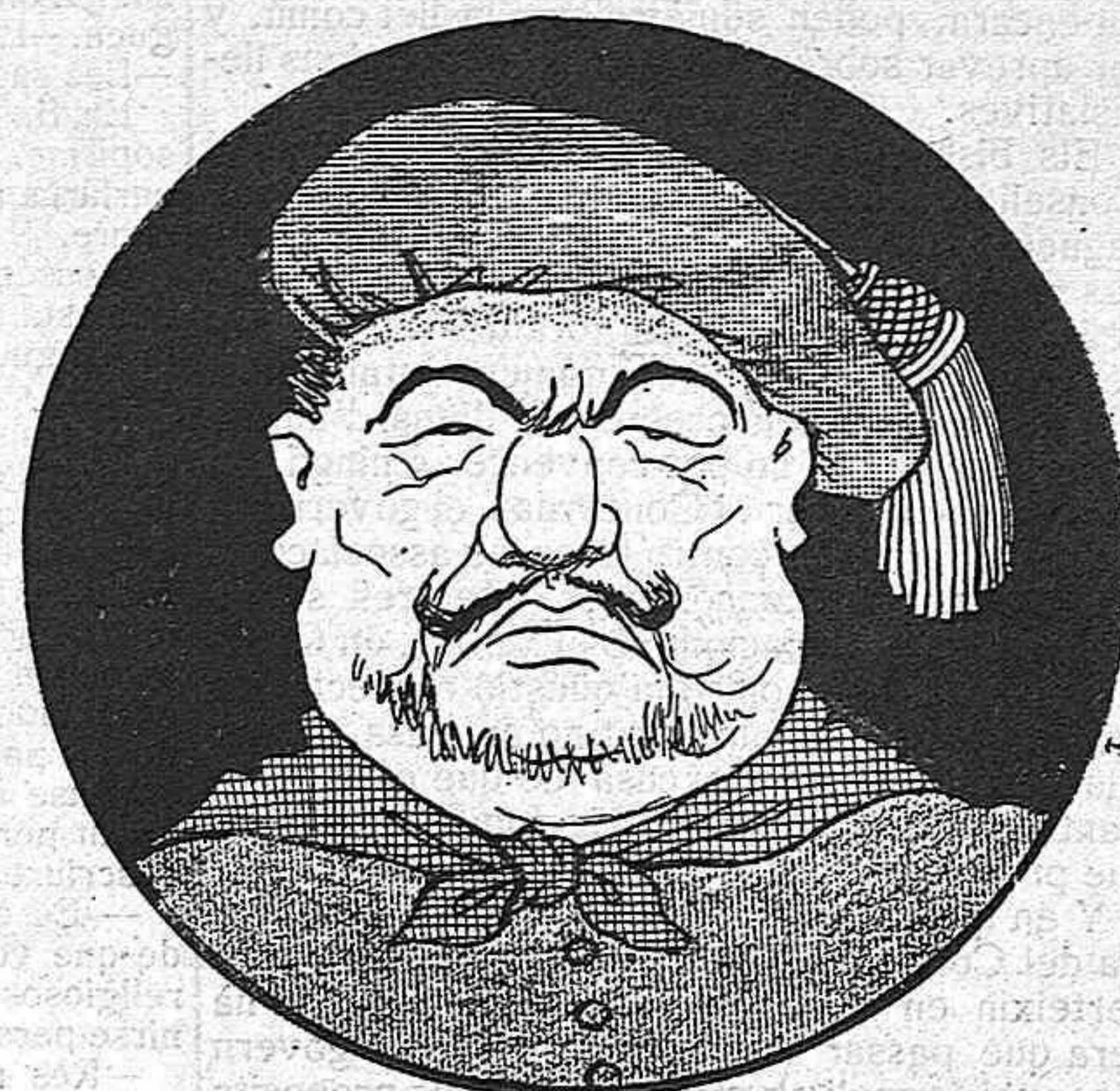
—Sort que crec que això va de broma... Que si anés de debò...