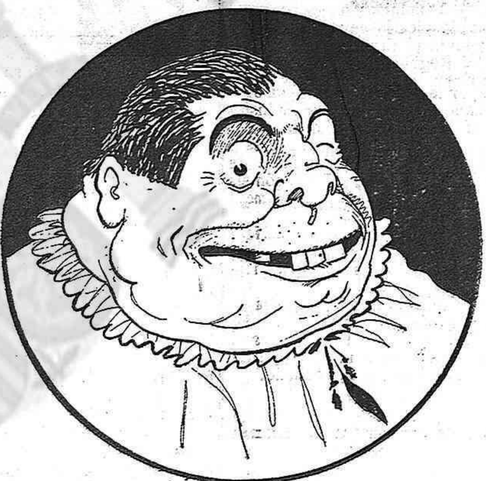
—Me n'alegro! Tot això favoreix al clero pacífich.