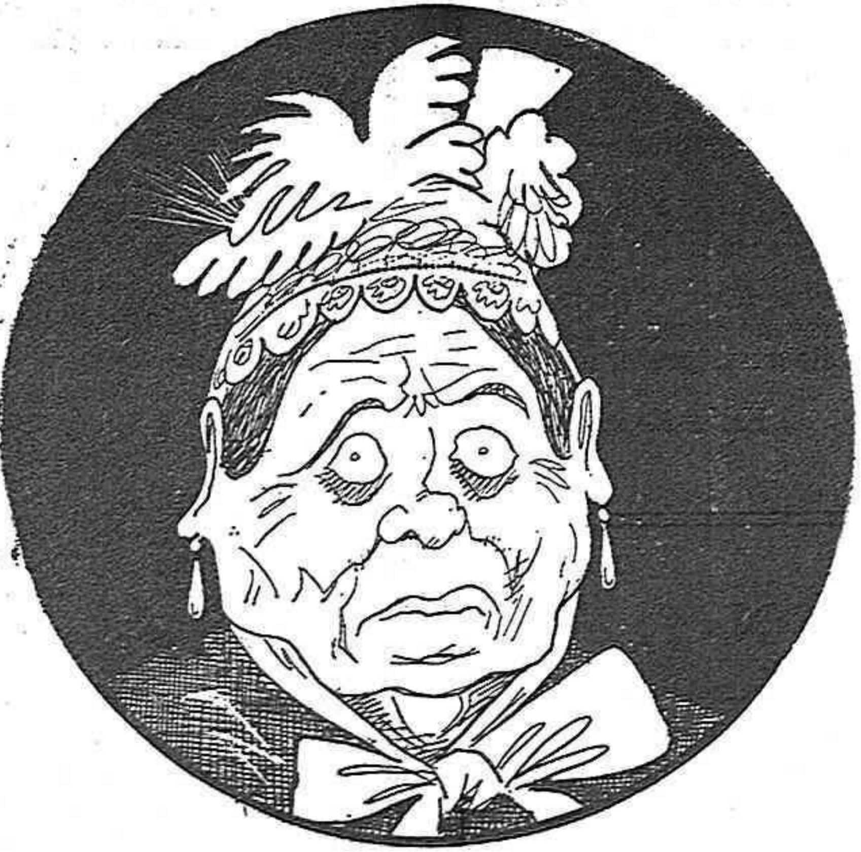
—Pobre confessor!... Que n'està d'amoinat ab això de la real ordre!... Avui no m'ha dit cap gata-da de les seves.