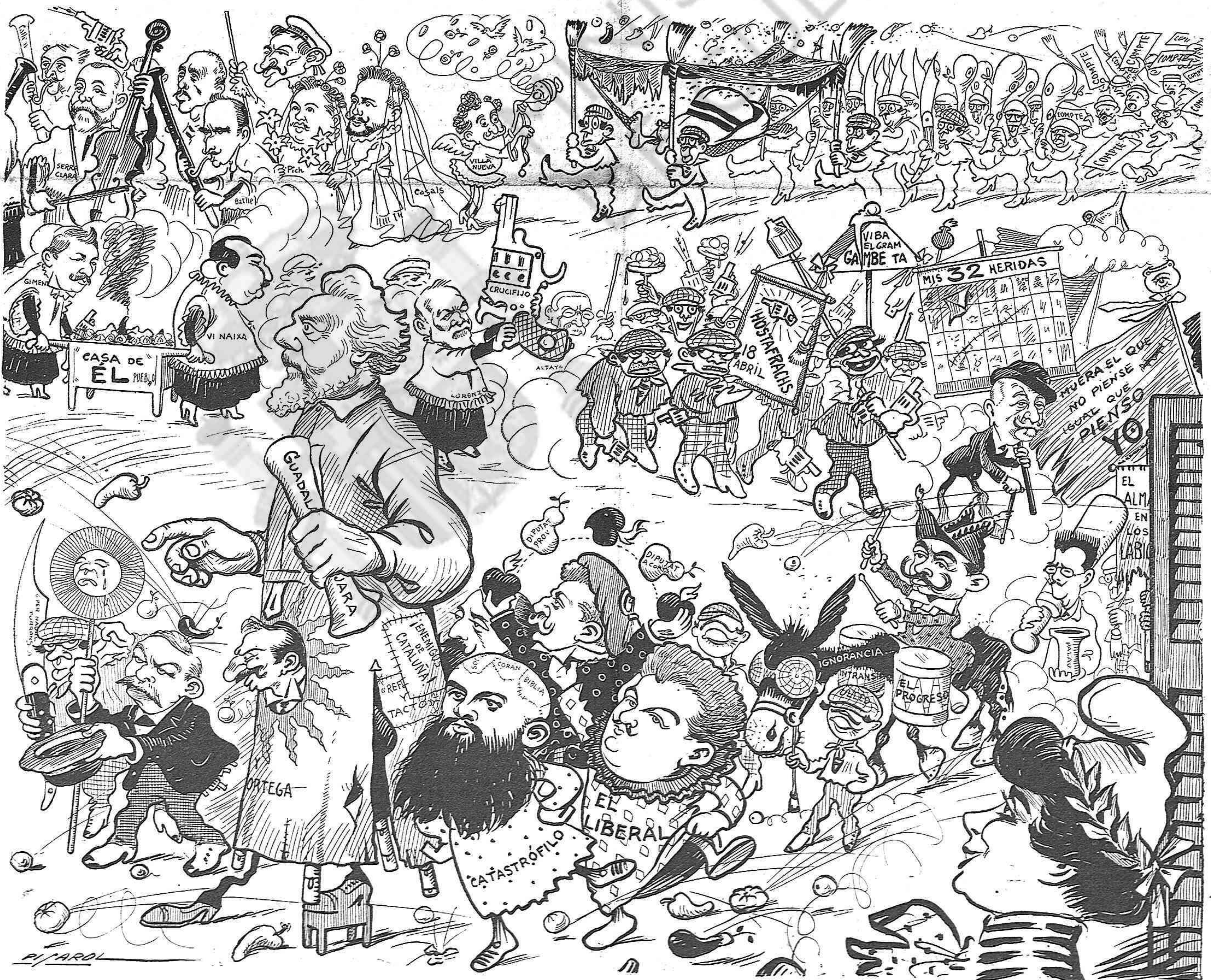
La professó del Corpus.