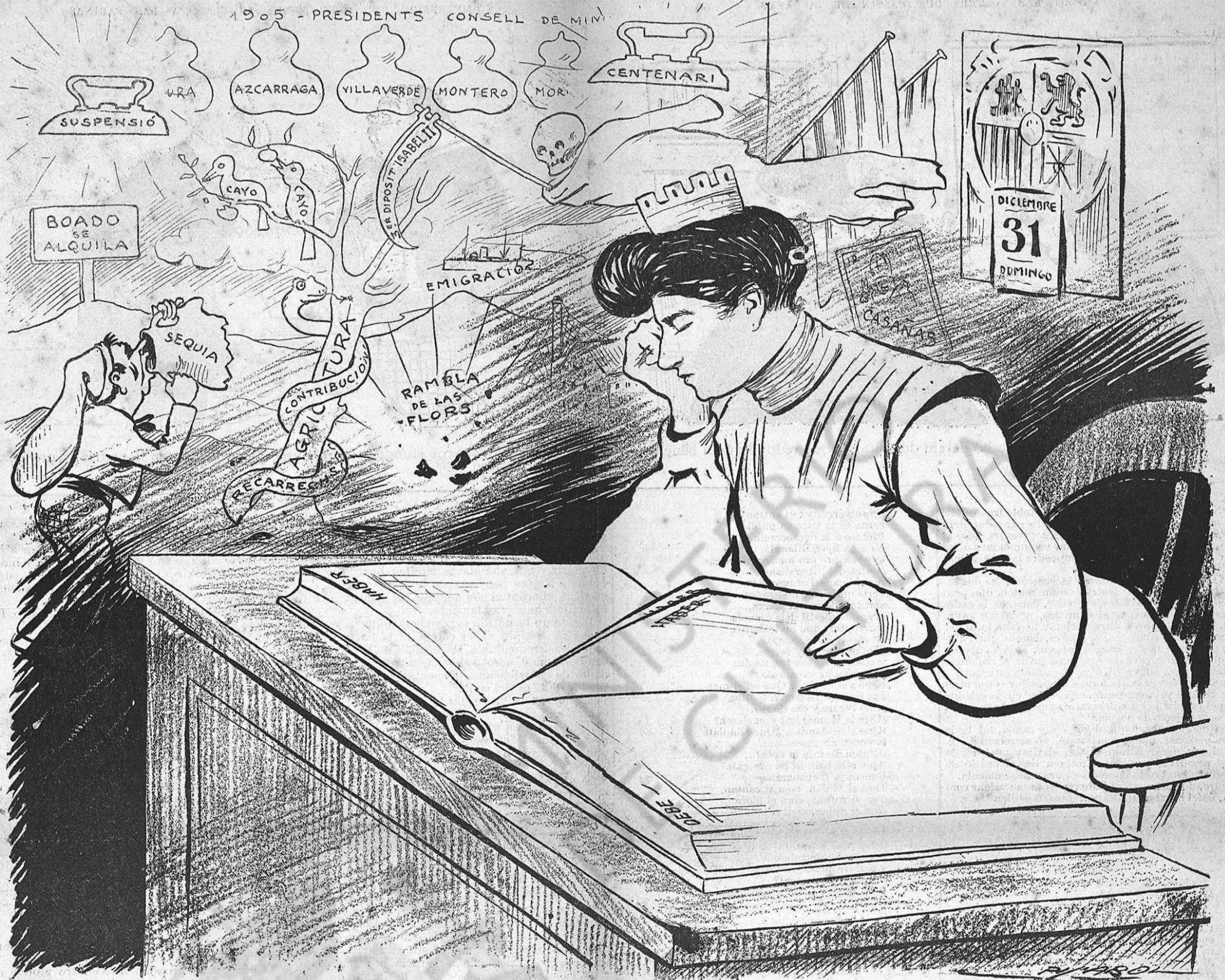
—Ja ho sé: lo de tots els anteriors balansos. Més deutes, més gana... y menos llibertat.

lla? ¿Donchs, per qué no han de complir ab l' Evangelí, donant al Cèssar lo qu' es del Cèssar?