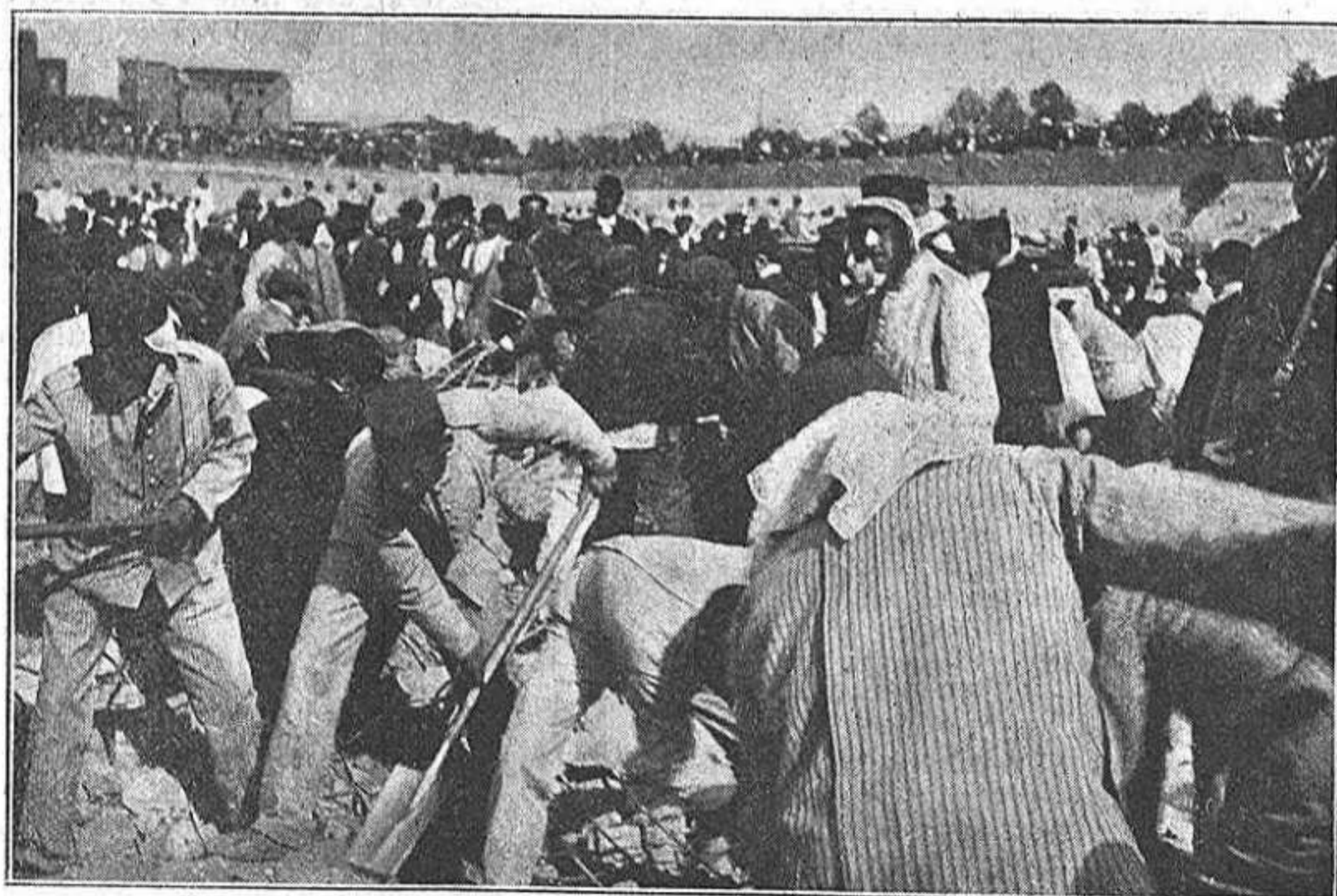
Alsant un munt de runa, pera salvar á un ferit.