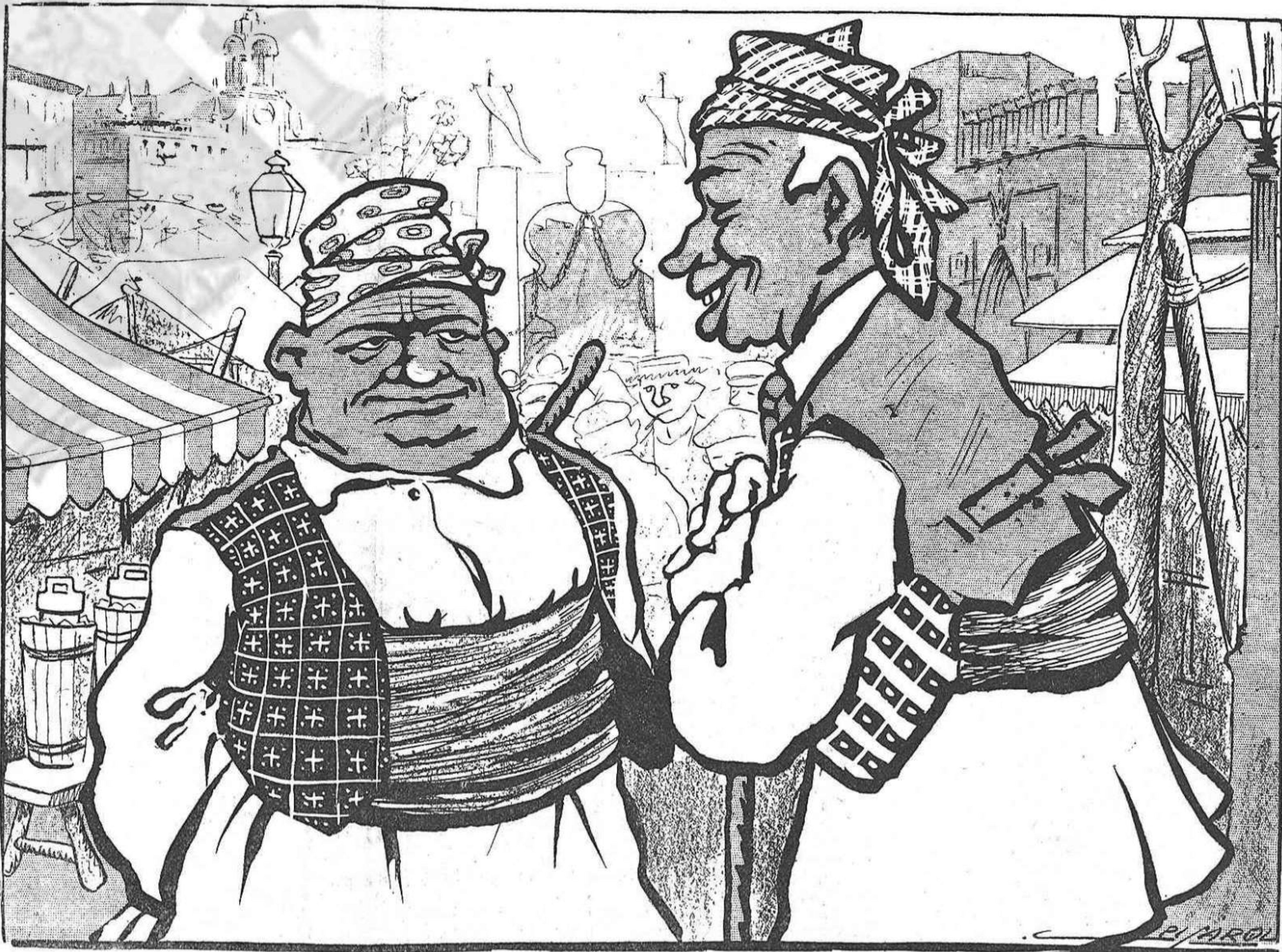
—Lo cortés no quita lo valiente, ché. Ara 'ns hem mostrat respectuosos, pero ¡veurás tú, veurás tú quan vinga en Nozaleda!