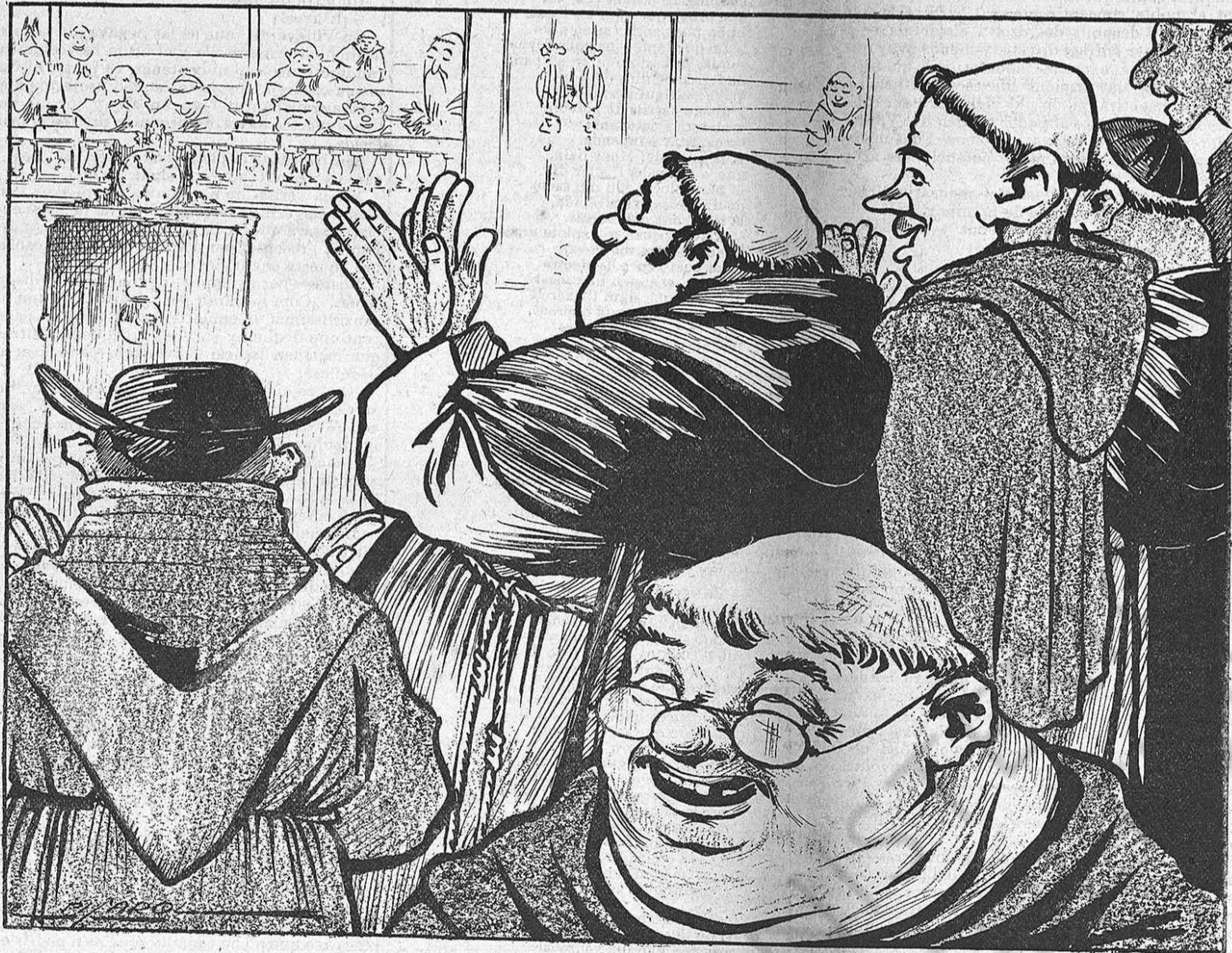
— ¡Dona gust sentir aquest home!... ¡Quin prior ne resultarà l' dia que 's retiri de la política y 's fiqui en un convent!

una lley aplicable als que fan vot de castedat, en virtut de la qual se 'ls posés en condicions de cumplirlo encare que no volguessin?