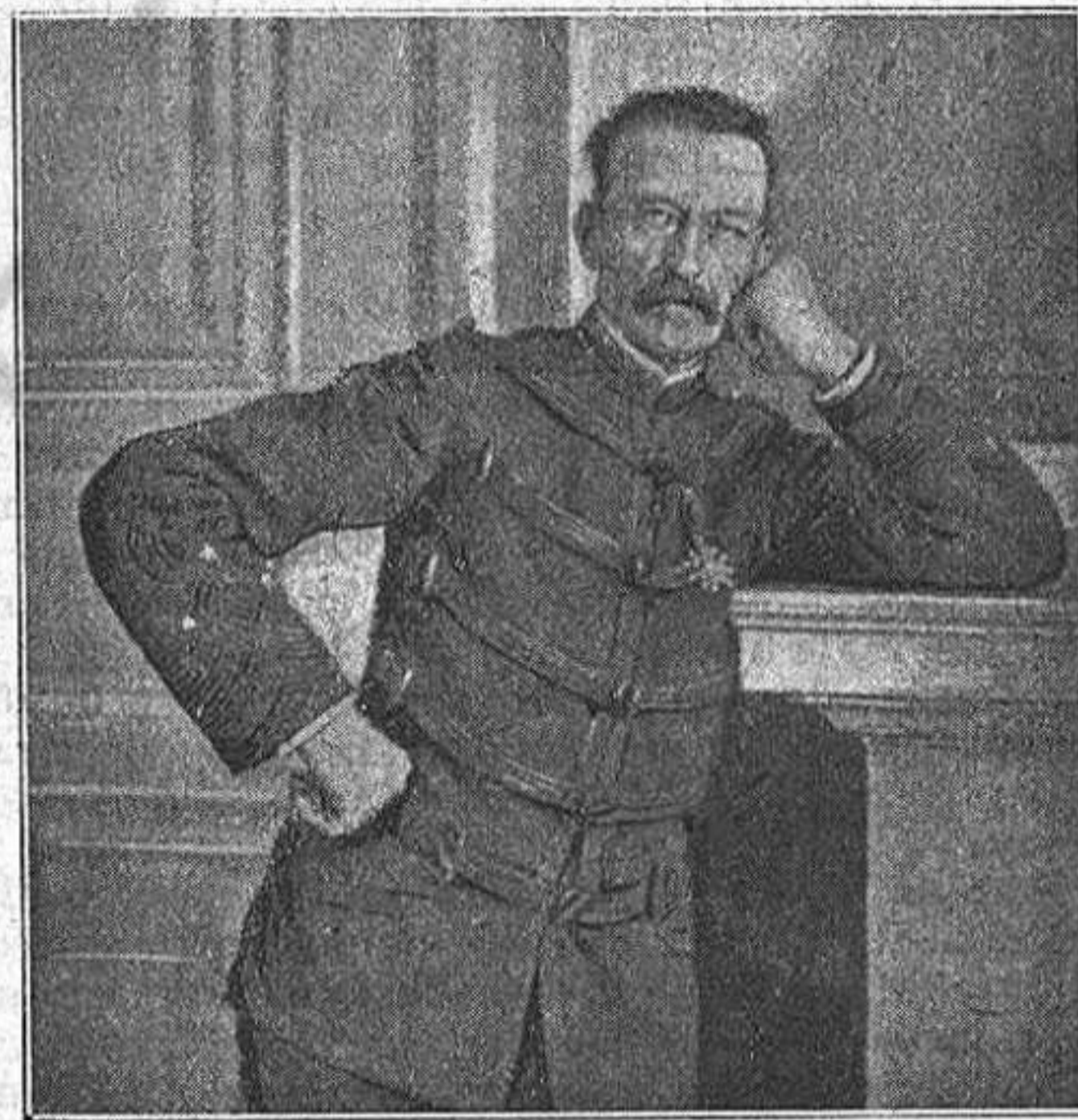
General ANDRÉ Ministre de la Guerra de Fransa.

Ultimament van dirigir las baterias contra l' ministre de la Guerra, l' general André, militar de grans prestisjs y republicá de cor que també, al igual que Mr. Pelletan, s' ha proposat republicanisar l' exercit y reparar en lo possible las injusticias comesas quan en la forsa pública hi predominavan las influencias reaccionarias.