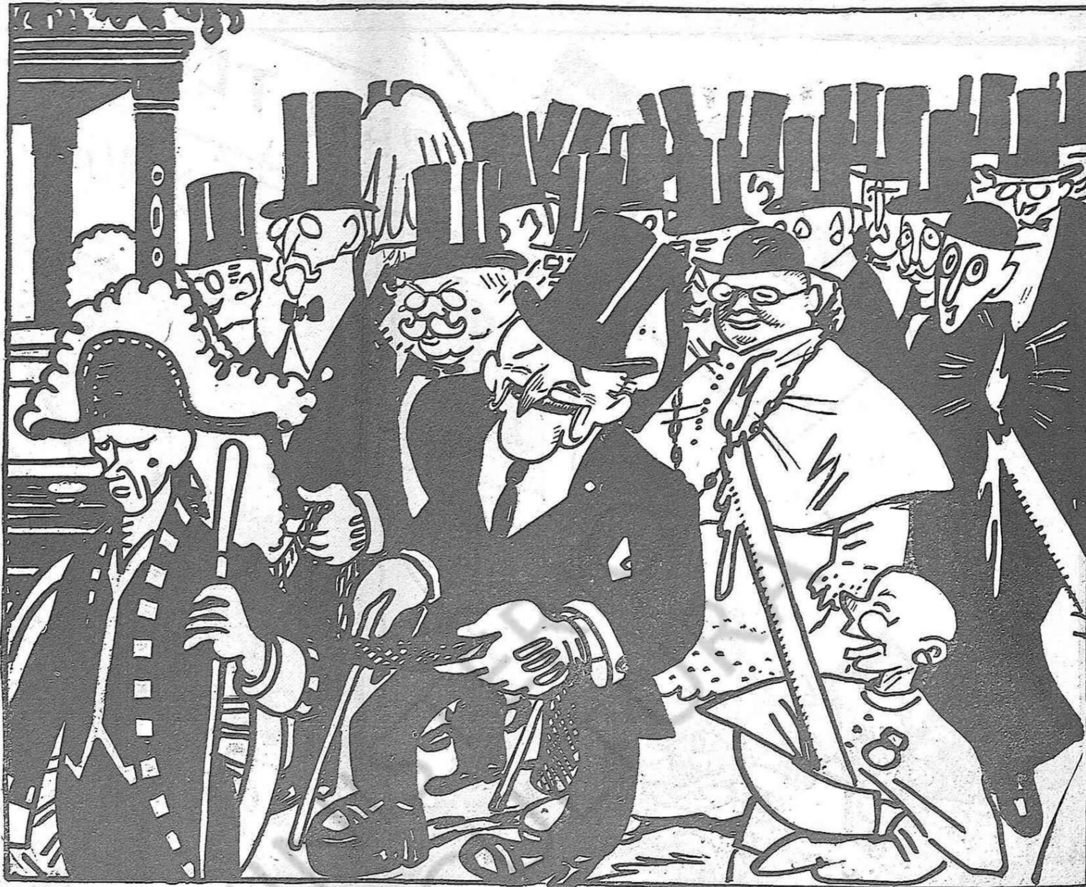
—Jo piulant, piulant, els vaig enterrant a tots.

L'activitat aèria ha estat vivíssima, però no hi ha cap fet especialment remarcable.