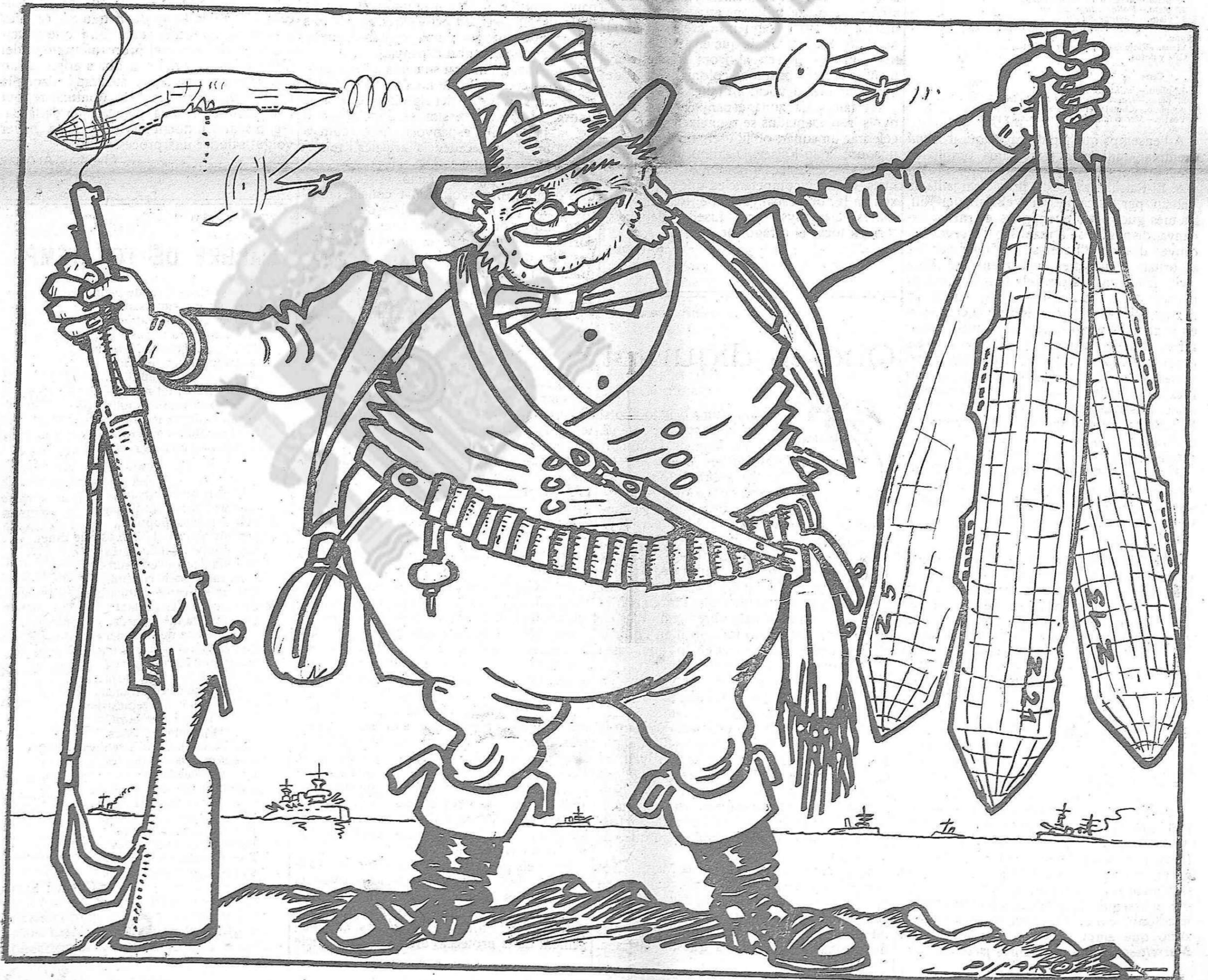
—Ja n'he caçat tres!... Ja n'he caçat tres!...