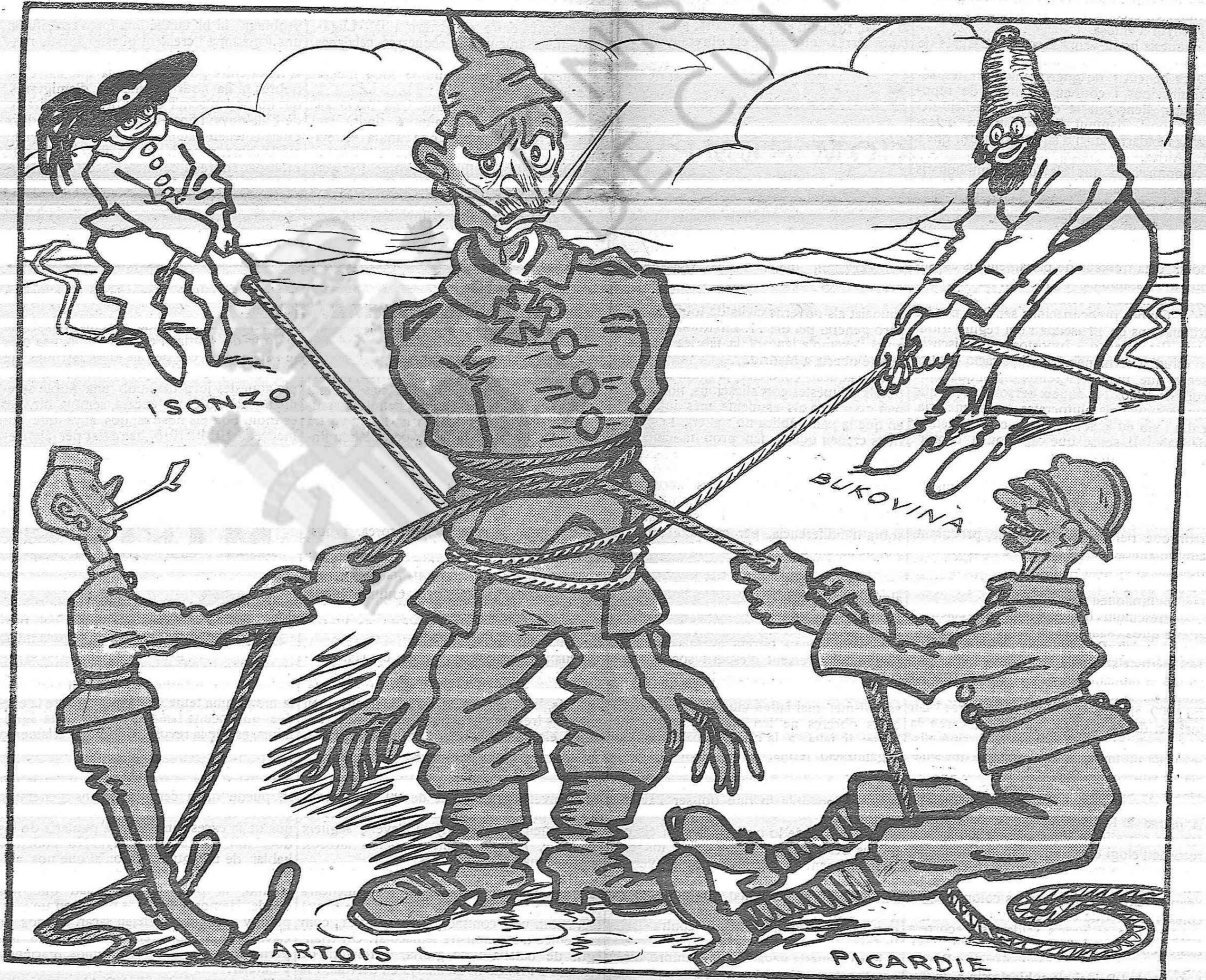
Els al·liats. — Au, nois, una empenteta més, que no's pot dir blat que no sigui al sac i encara ben lligat.