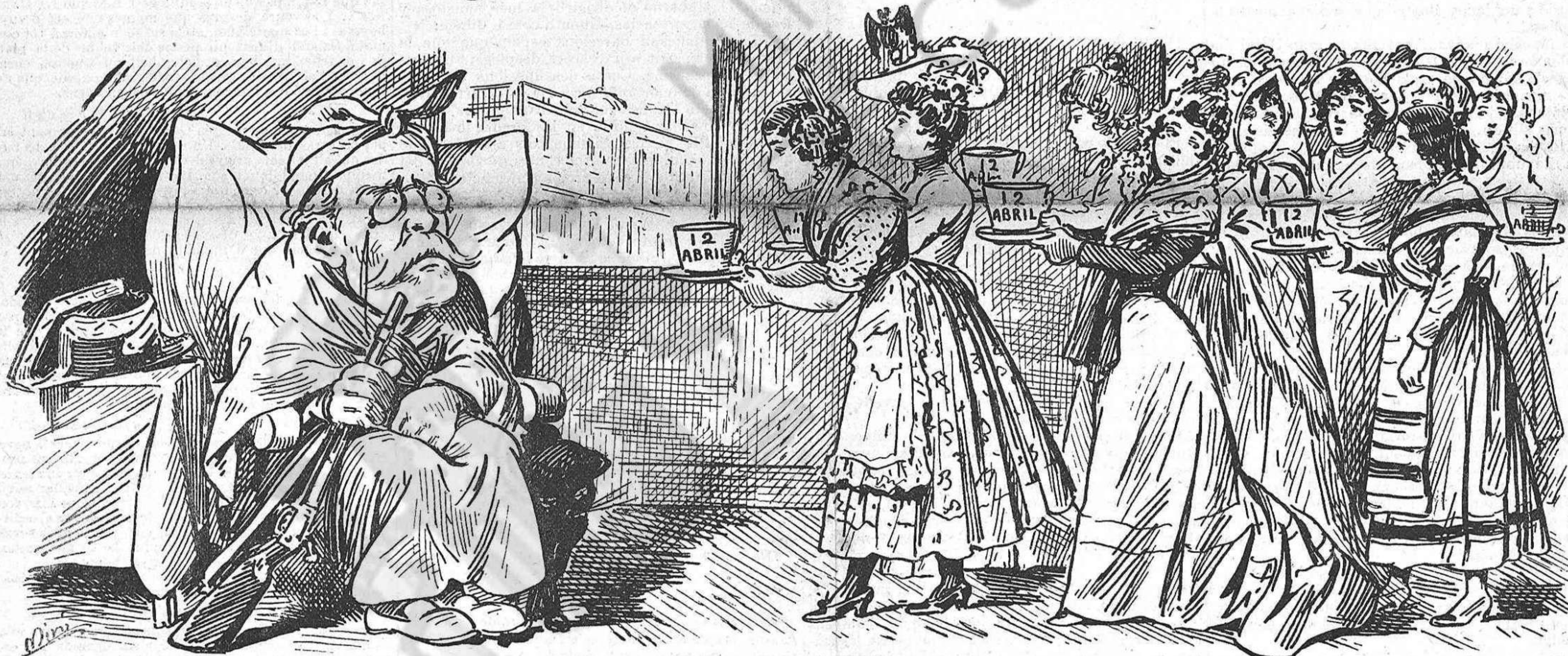
—Al qui no vol caldo, cent tasses.

Al sortir dels «meetings» celebrats en tota la nació el diumenge passat