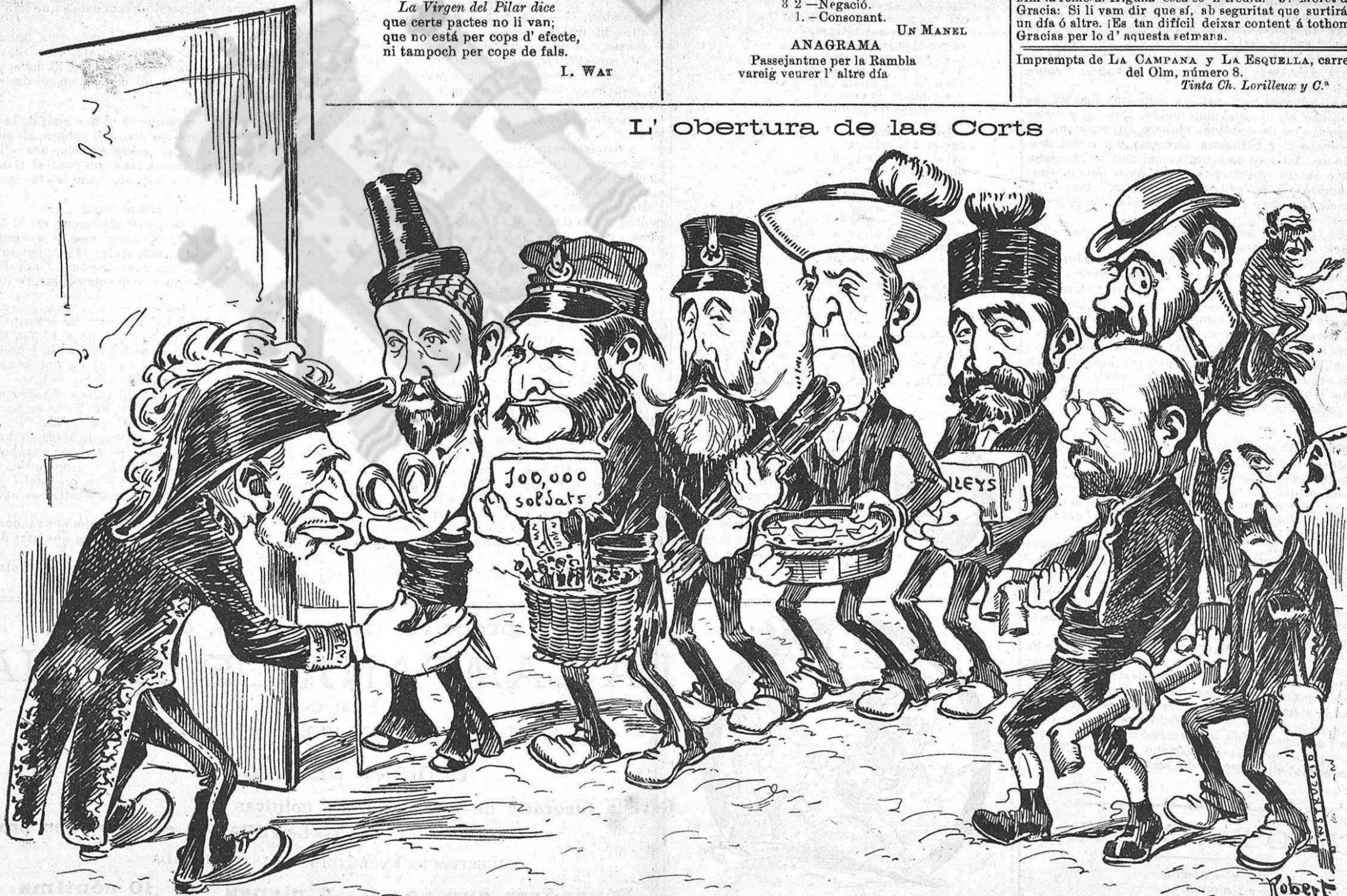
—Aneu entrant, noys, aneu entrant. Y procureu no deixarvos espatllar las joguinas per la quixalla de l' oposició.