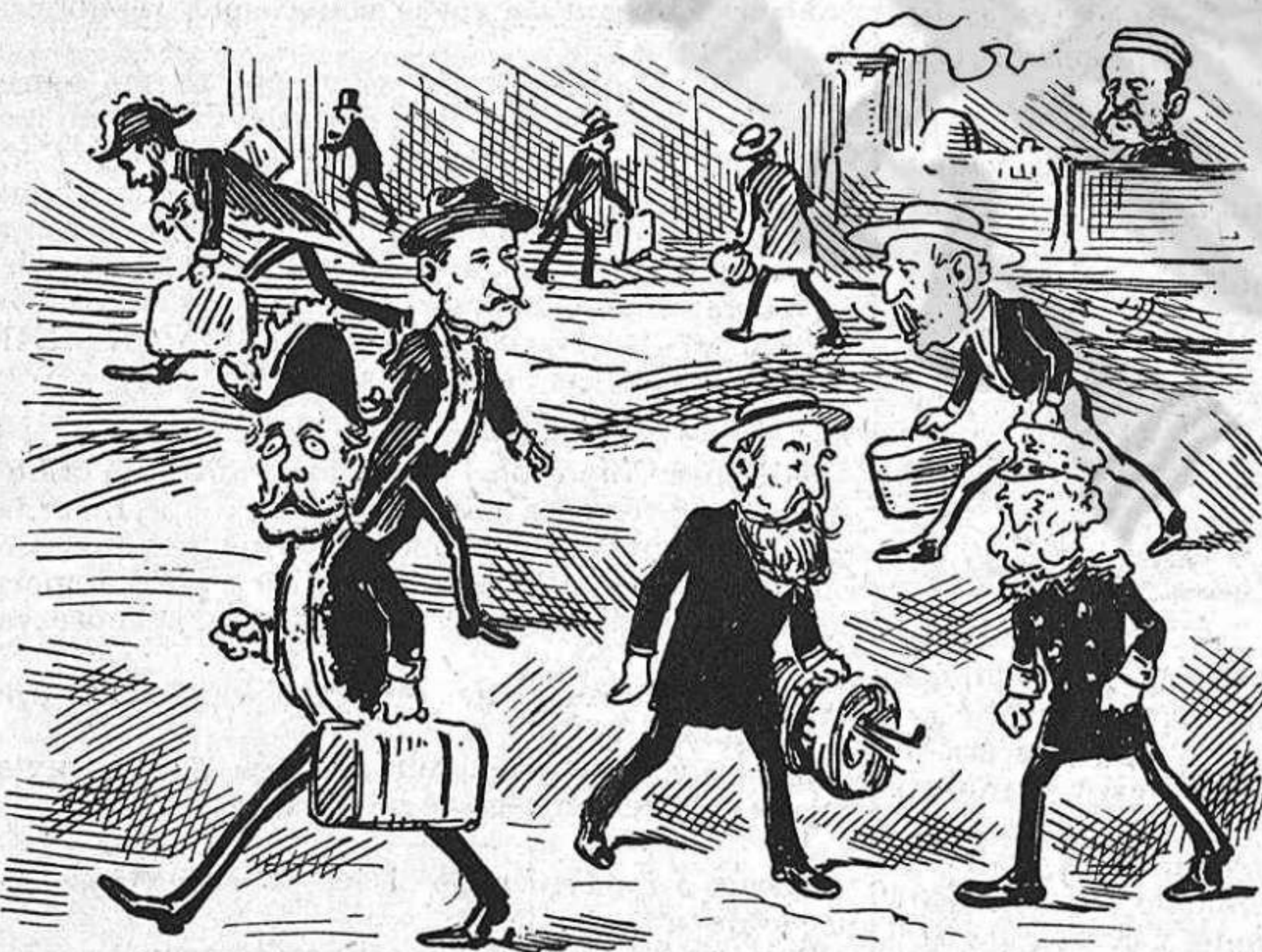
Las nostras eminencias polítcas ja han comensat las imprescindibles vacaciones del verano.