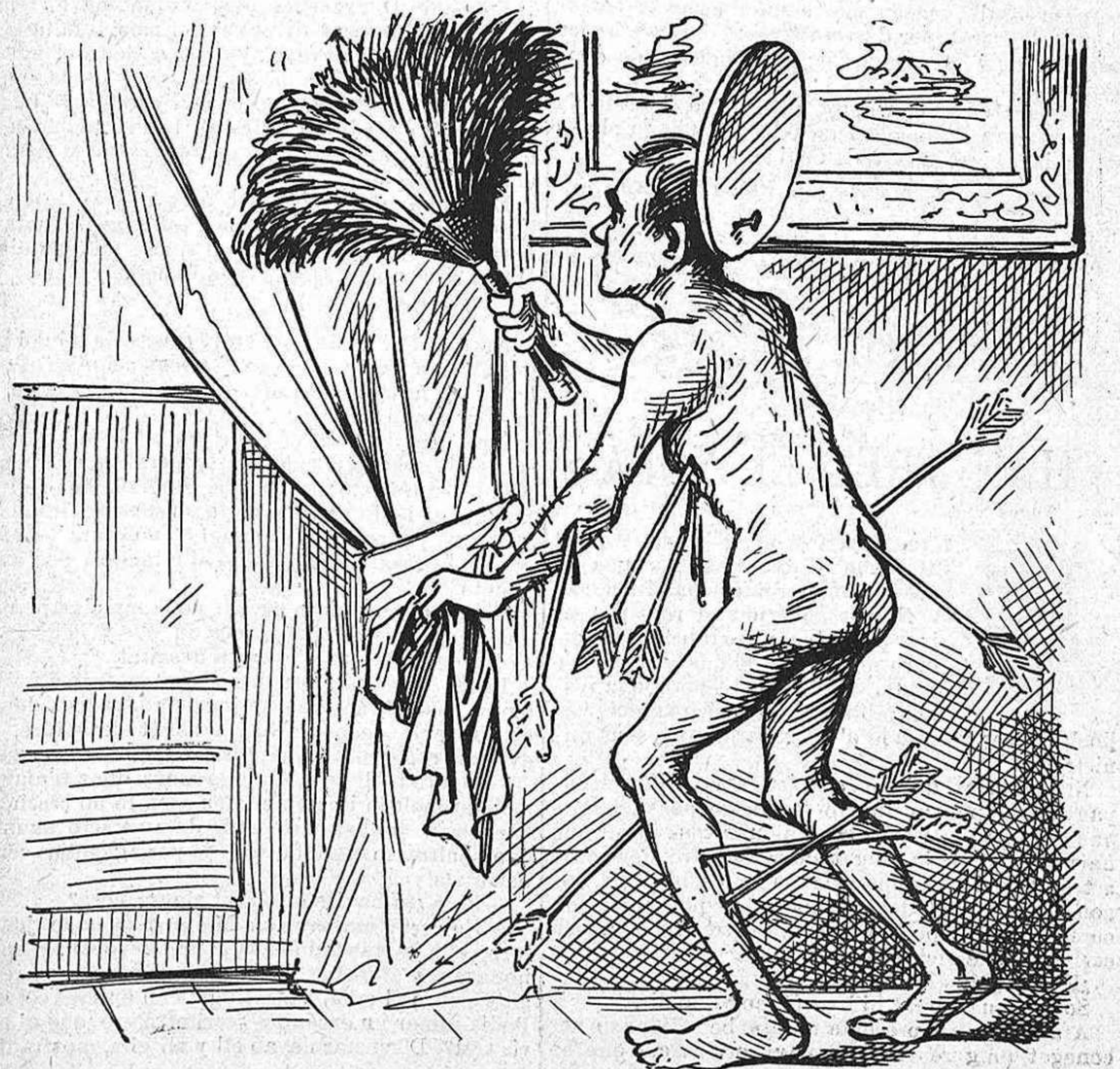
Sant Sebastiá, arreglant la casa pera rebre forasters.