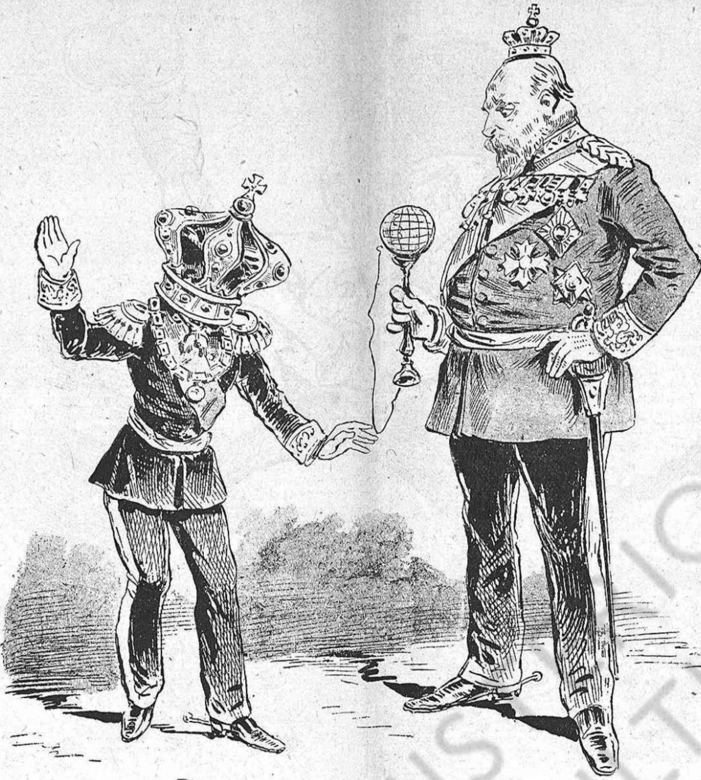
Dugas coronas que no son fetas á la mida.