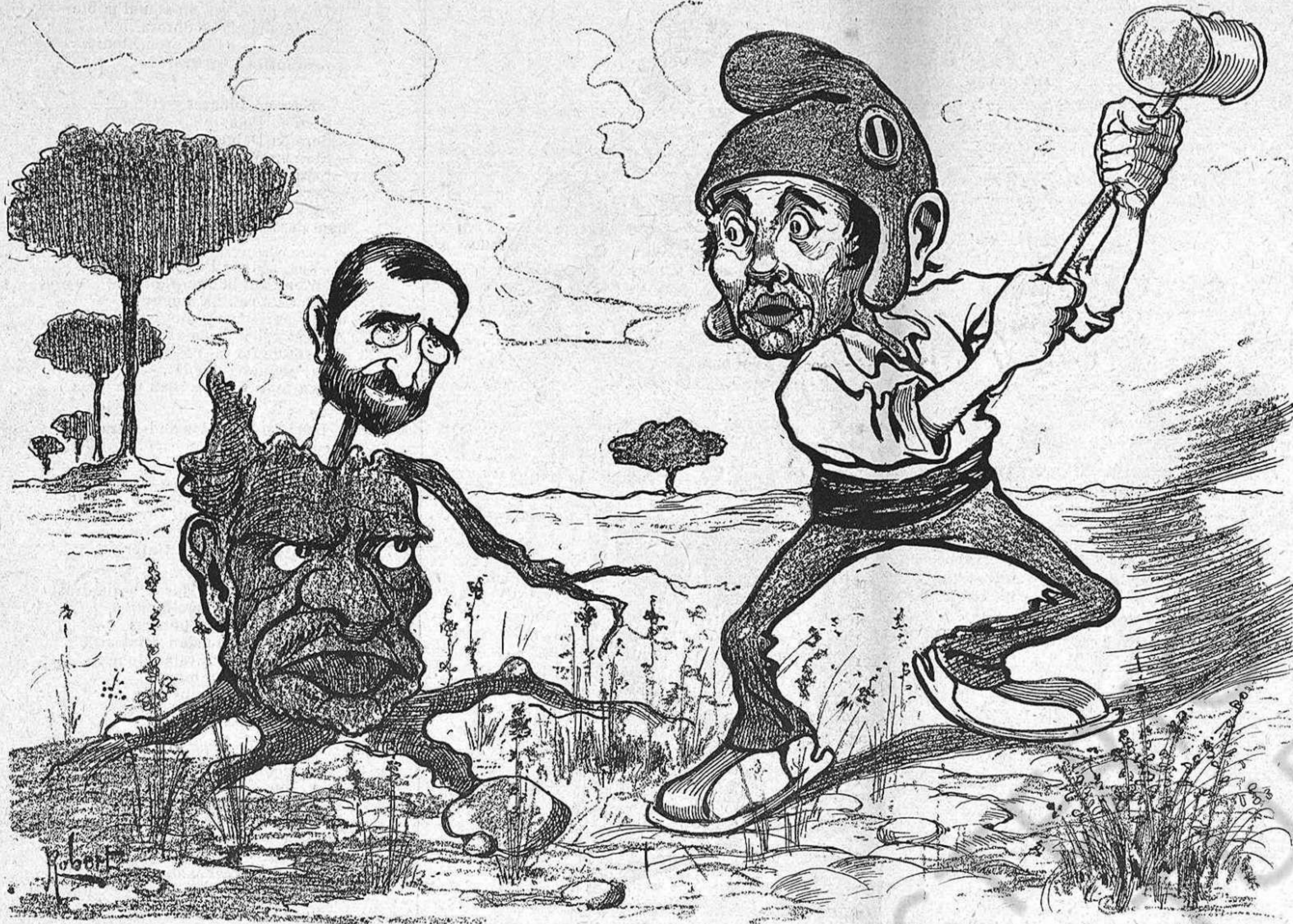
—[Qué se 'n fa aixís de feynal... Té rahó 'l ditxo: no hi ha pitjor tascó que 'l del mateix tros.

punt lograren anarse fent cárrech de aquella tremenda realitat.