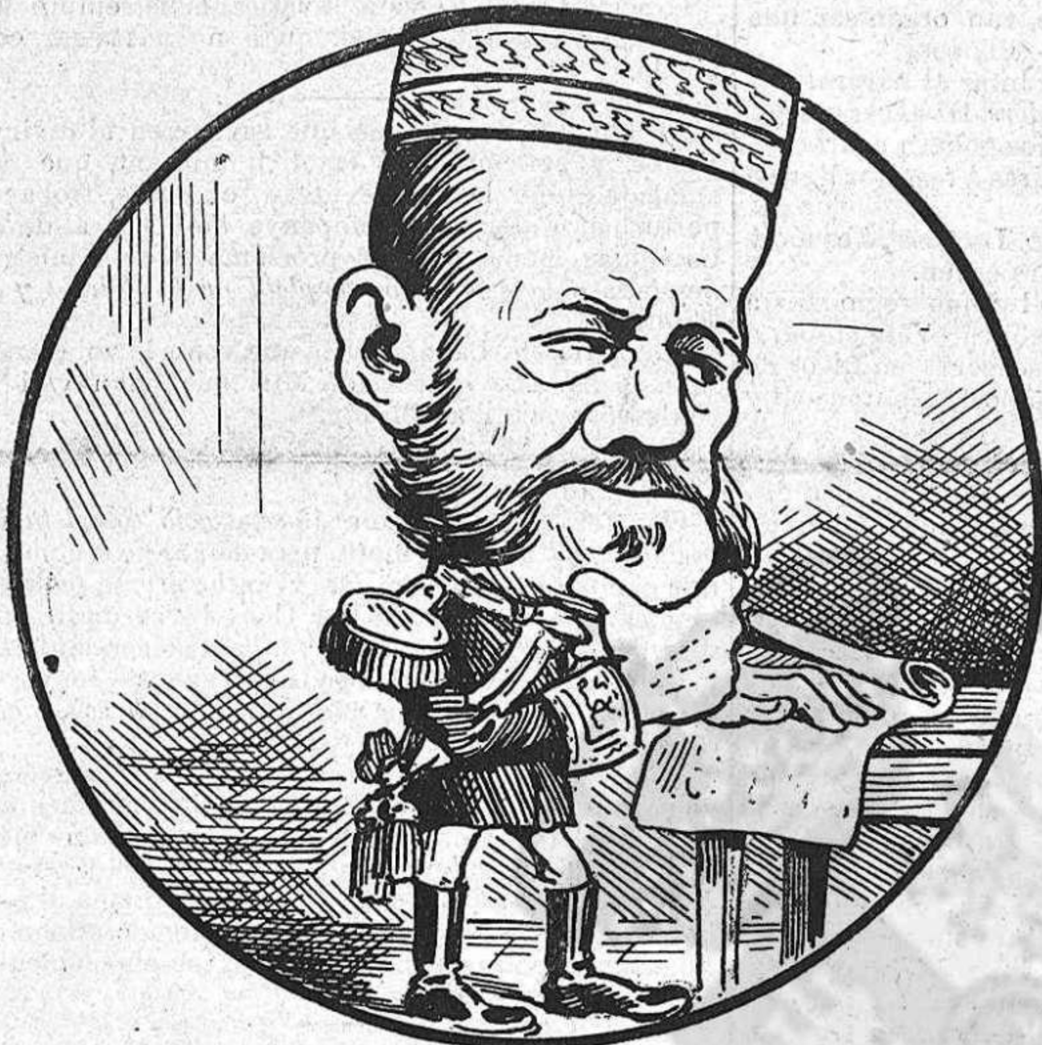
—¿Dimiteixo? ¿No dimiteixo?... (Fa quinze días qu' está aixís.)