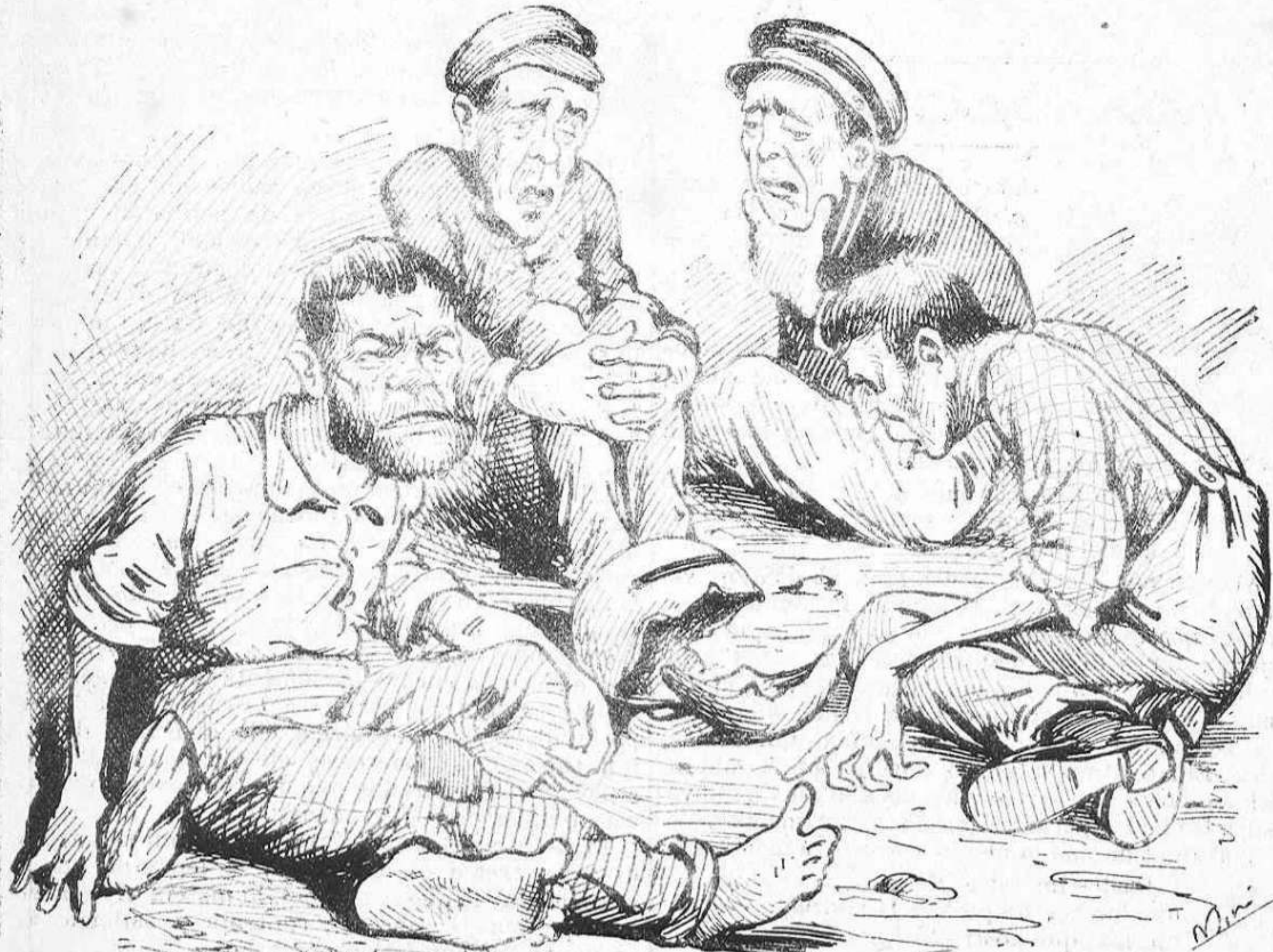
—Zero, zero, sempre zero!... Cada any solém fé l' mateix.