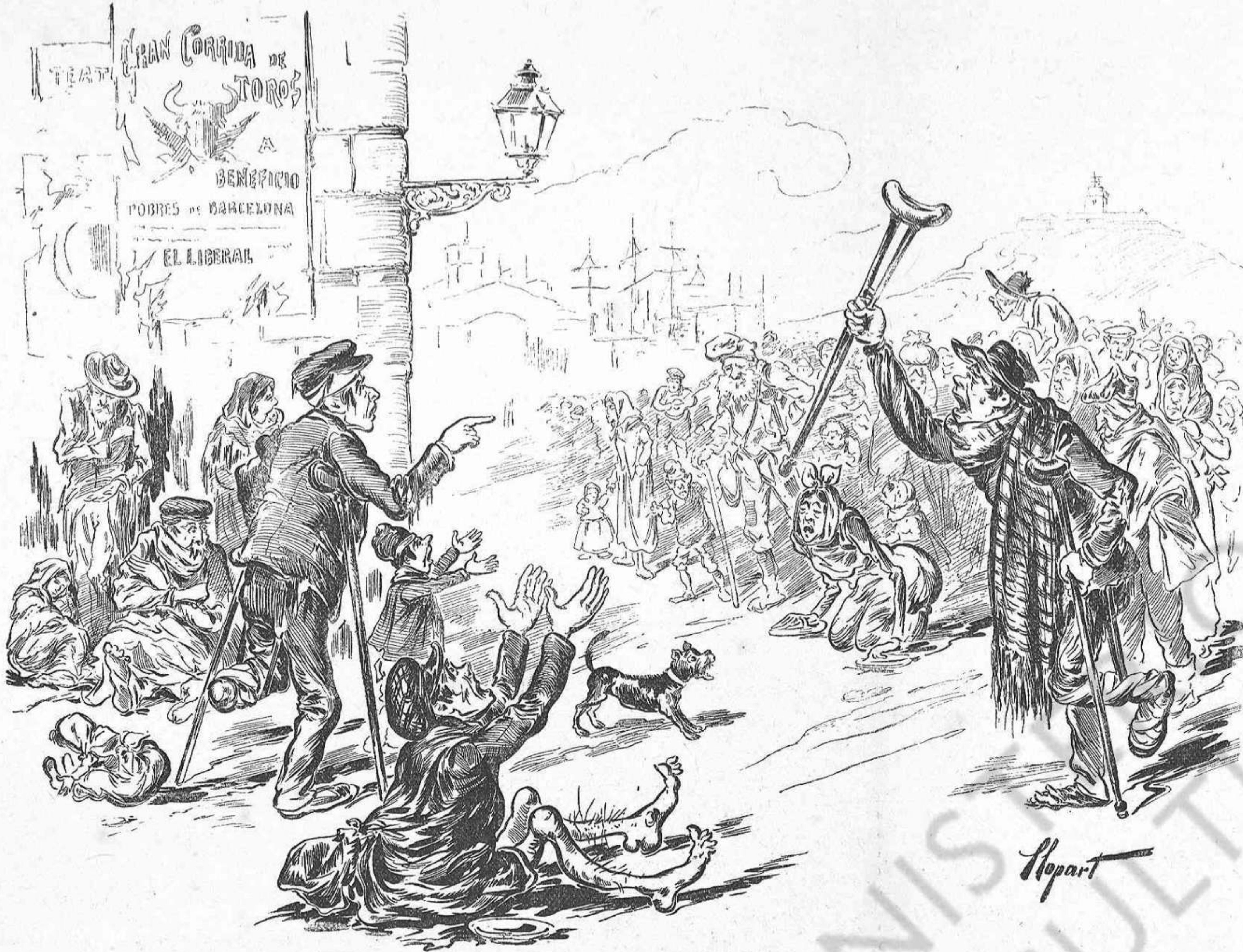
—Tots heu baixat cap aquí? —Naturalment!... Com que per fora tothom diu que Barcelona es una vinya y que hasta s' hi donan corridas á benefici nostre...

se convencin de unas veritats tan irrefutables. El ser cap de rata no es una bicoca pels qui, en altres partits á penas si passarian de quas de sargantana. »Ab pocas, ben poquetas excepcions.» En Nakens té rahó de sobras, y es hora de que li donguin, ja que no 'ls fomentadors de la discórdia obrera, que aquests no li darán may pel compte que 'ls te, 'ls incautes treballadors que figurantse candidament treballar per idees mes radicals que las de una simple República democrática, han acabat per esterilitzar l' acció del poble espanyol, convertintse en joguina de unas quantas dotzenas de ambiciosos vulgars, els quals, prácticament, resultan ser els auxiliars mes poderosos de la reacció imperant. «Divideix i triomfarás»—diu l' aforisme. Y en efecte: ells divideixen y la reacció se 'n aprofita.