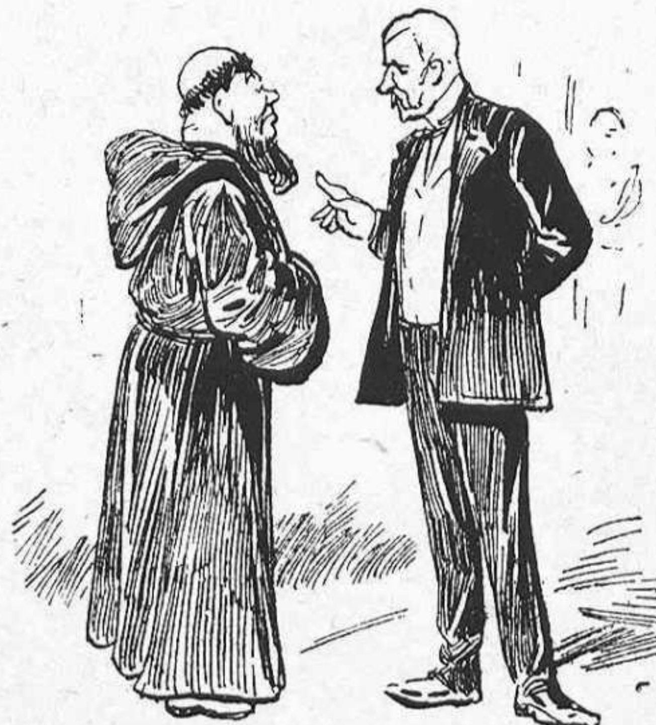
—Nosaltres á la Iglesia no li volém cap mal: ó sino vosté mateix treguis 'l hábit de frare, afaytis, y ab el temps potés encare 'l farán bisbe.