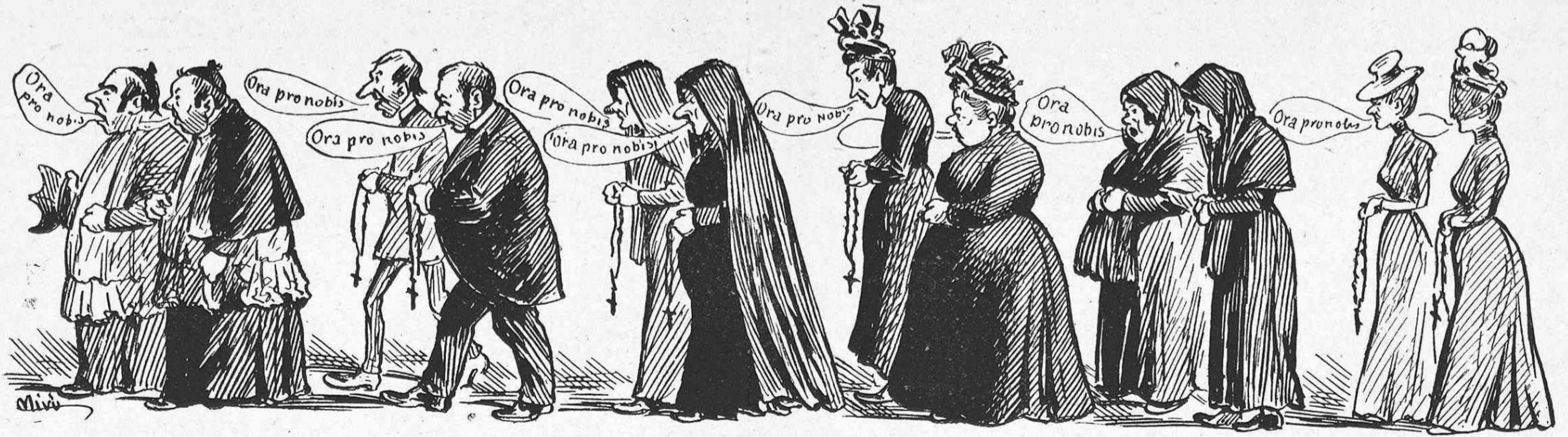
El Jubileu de portas enfora.