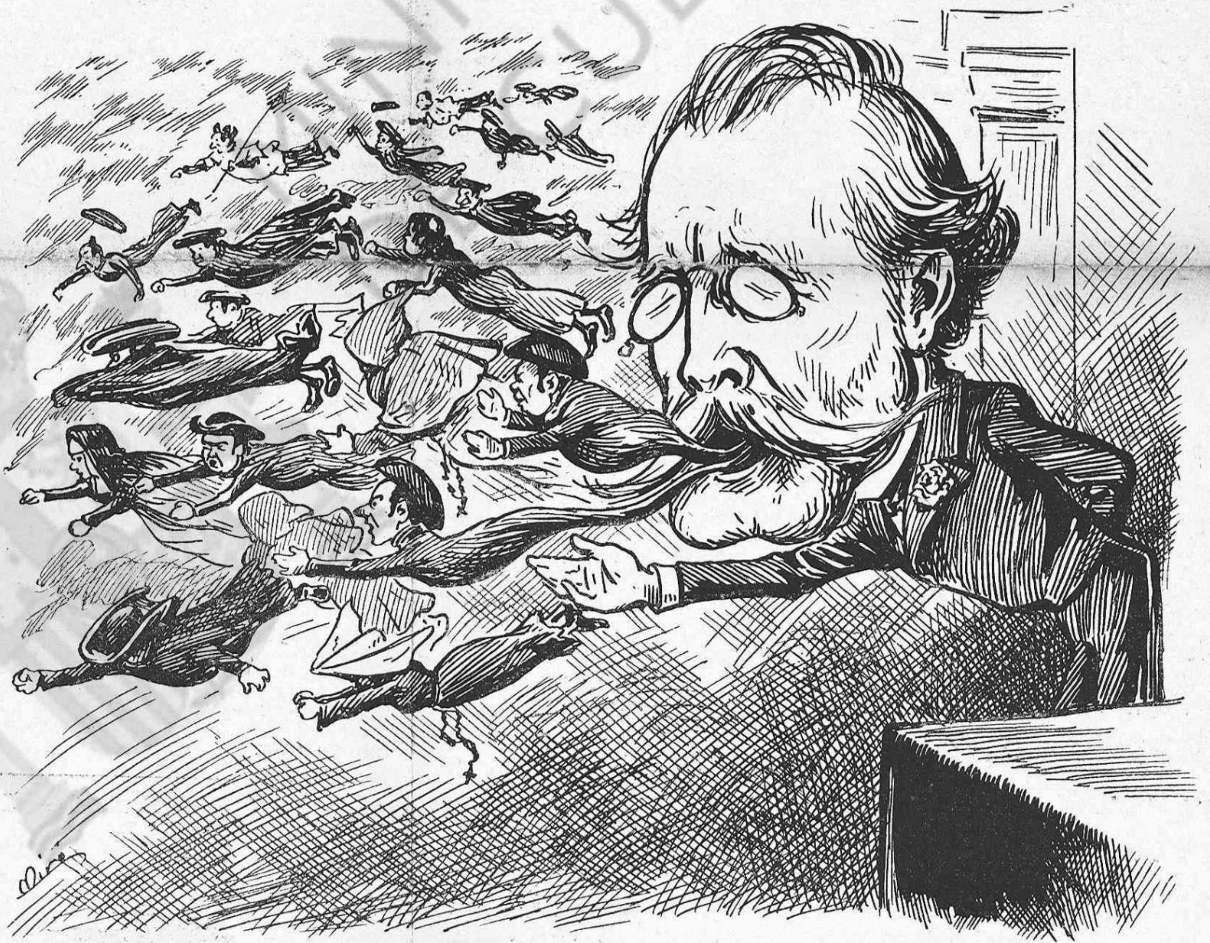
¡Ja s'coneix qu'es clerical, perque no va fer res mes que tirar capelláns!

El mateix Papa no ha tingut mes remey que calmar la exacerbació dels clericals, aconsellantlos que s'arrossessin. El Papat ho fa sempre aixís: molt super ab els que s'humillan; molt humil ab els que s'imposan.