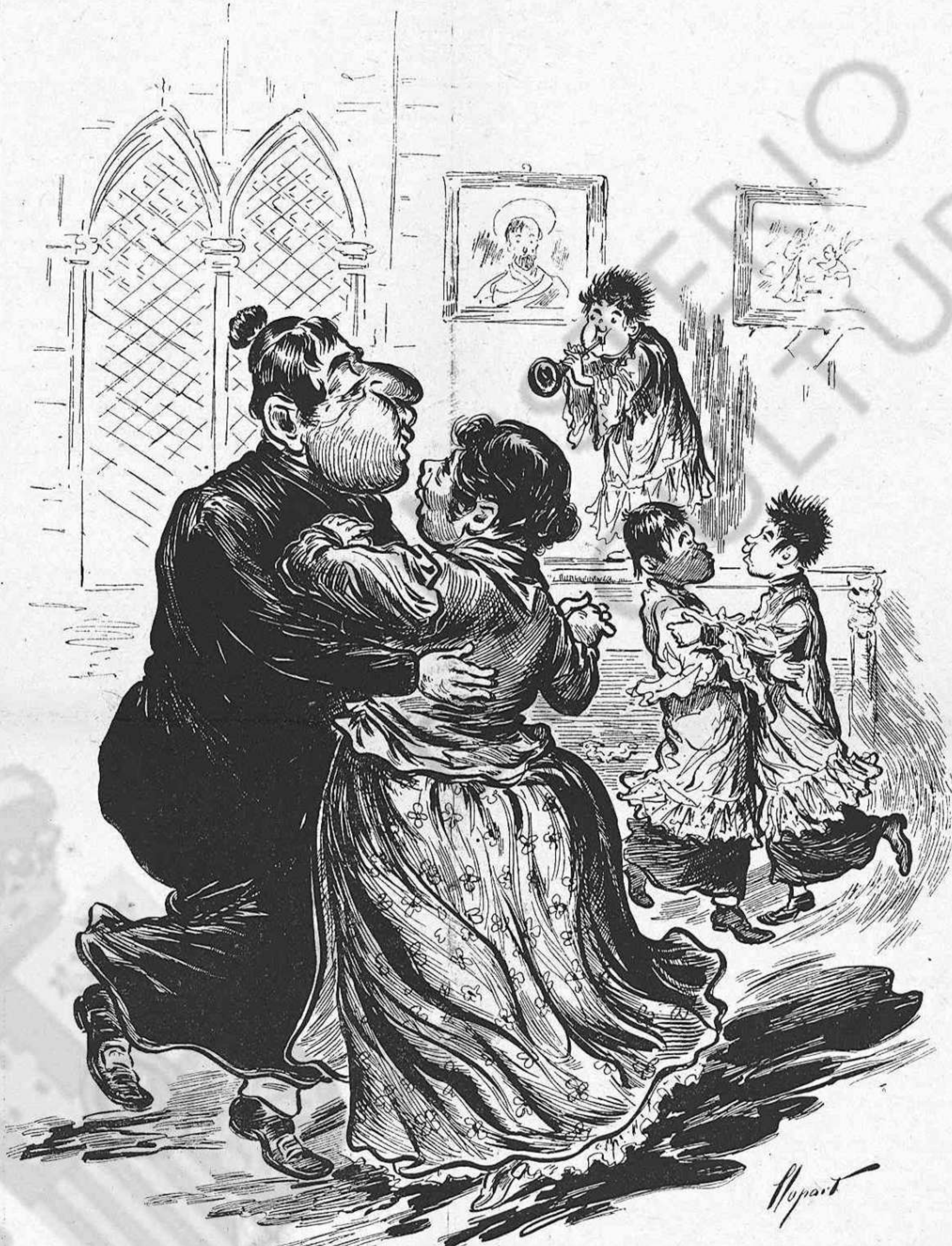
El Jubileu de portas endintre.

Apenas acaban d'obrirse las Corts, ja 's parla del dia en que 's tancarán.