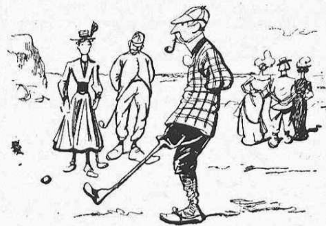
Per mes que á la guerra del Transvaal li vajin tallar la cama, sempre li queda la ganga de poder jugar al golf ab la cama de fusta.