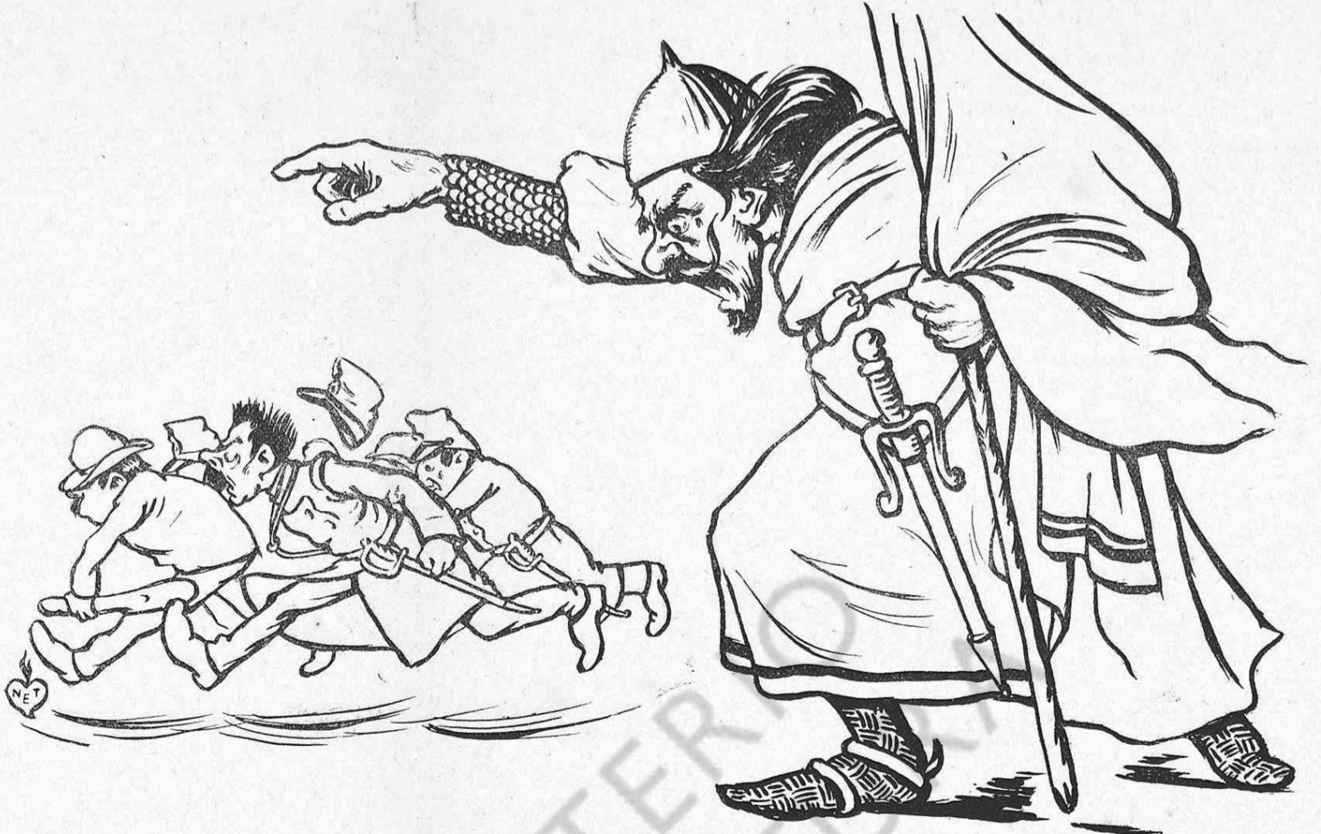
—¡Arri, allá, que no serviu per arreglar aquestas cosas! A copia de llenya encare enceneu el foch. Jo en cambi las passo per aygua, y apagadas desseguida.