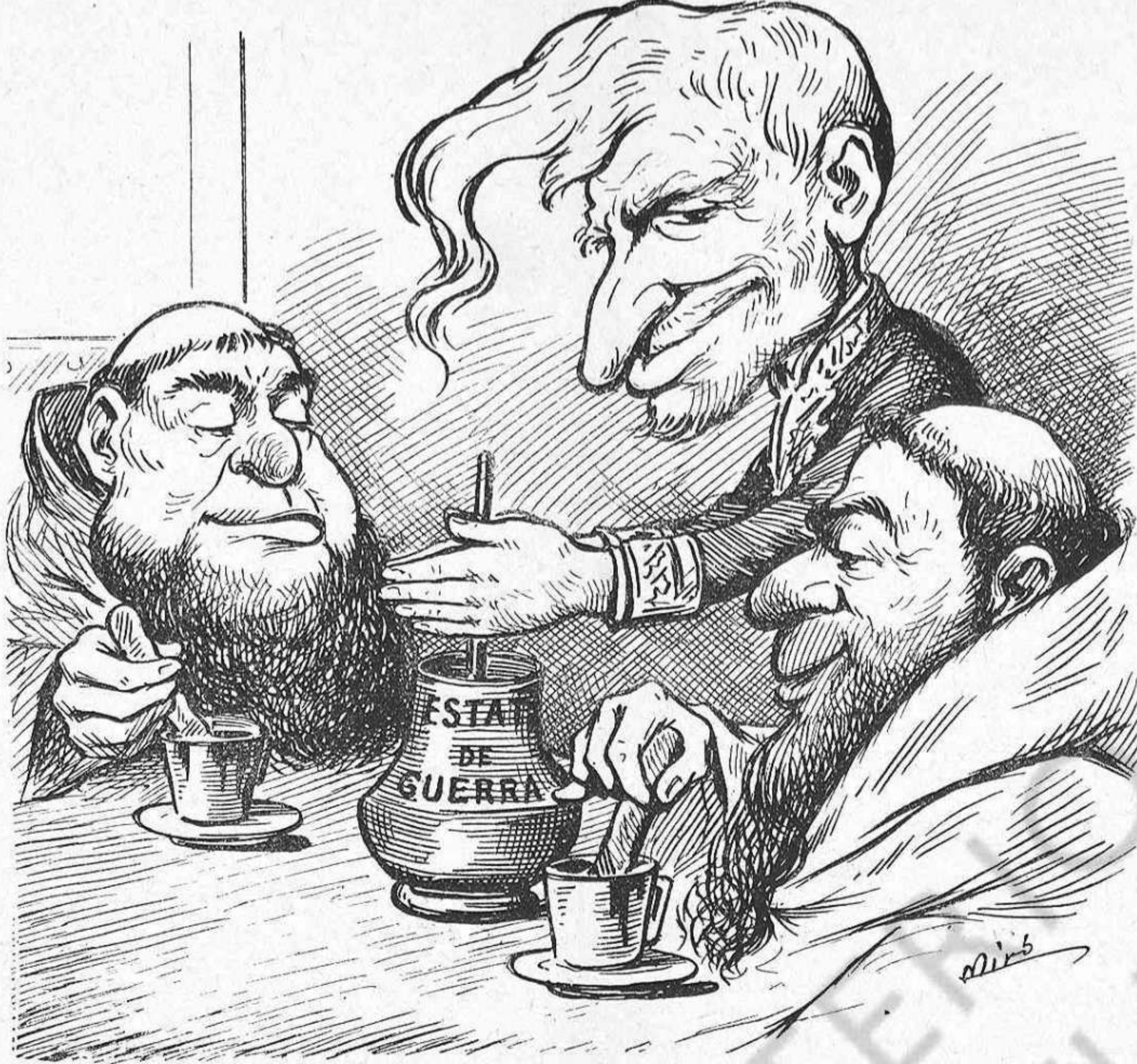
—Ja se'n poden riure sas reverencias de la eridadissa anti-clerical, mentres jo 'ls hi pugui desfer el xacolata.