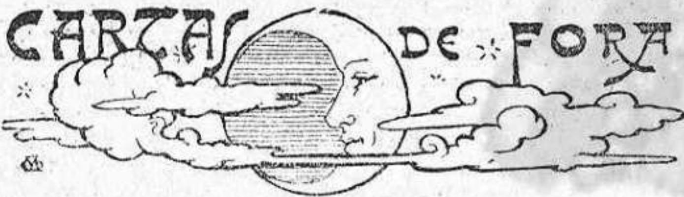
CAPELLADES, 13 de maig