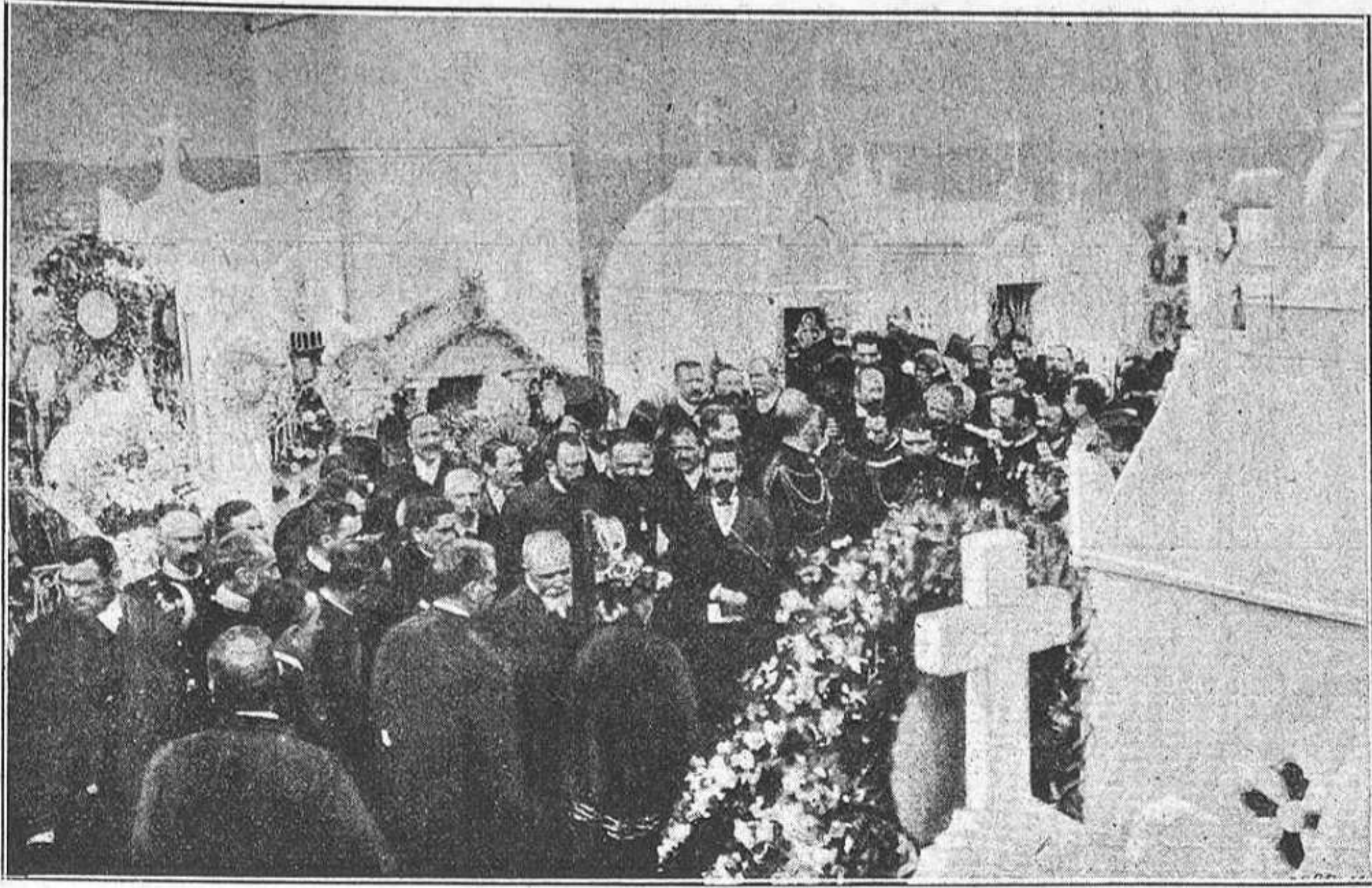
M. Loubet visitant el sepulcre de n Gambetta en el Cementiri de Niza.

á aqueixa munió de vils insaciables sangoneras, que ab l'afany de ser poder ab mala sombra 't guberman, xuclantne d' en viu en viu la noble sanch de tas venas. ¡Desperta del débil son que 't té amodorat la febra! ¡No vulguis morir cobart tenint foras pera véncer! Desperta, y al mon enter ta virilitat ensenya, demostrant que estás cansat de tanta farsa perversa, de tan estúpit sens cor, de tanta llei sens consciencia, de tanta maldat infeua y de tan cobart que impera. Desperta si no vols mes sé 'l blanch de sas malifetas, ó 'l ruch que 'ls roda la s'nia, ó 'l gos que 'ls guarda l' hisenda, ó 'l xay que ab sa molta llana els dona abundant riquesa. ¿Preguntas cóm s' ha de fer per sortir de tals baixos? Per la lluyta romp l' esclau las opresoras cadenas. Desperta, donchs, y á la lluyta, y ab coratje, seré y destre, no deixis lloch per seguir, no deixis per moure pedra. Romp obstacles si s' hi oposan, clava 'ls ullals si s' hi empenyan, no paris fins haver fet una radical neteja; fins lograr la llibertat que per deixadés vas perdre; fins que 'l sol de la Justicia brilli ab tota sa puresa. Si aixís no ho fas y poruch no 't mous del jou ahont te tenen, mitj extenuat pels cops, flach, perdut per la miseria, pitjor per tú, puig la mort prompte farà de tú presa, essent l' escarni y riota dels vils que pérdrer pretenen, y després l' afany dels corbs que tas despullan ja esperan.