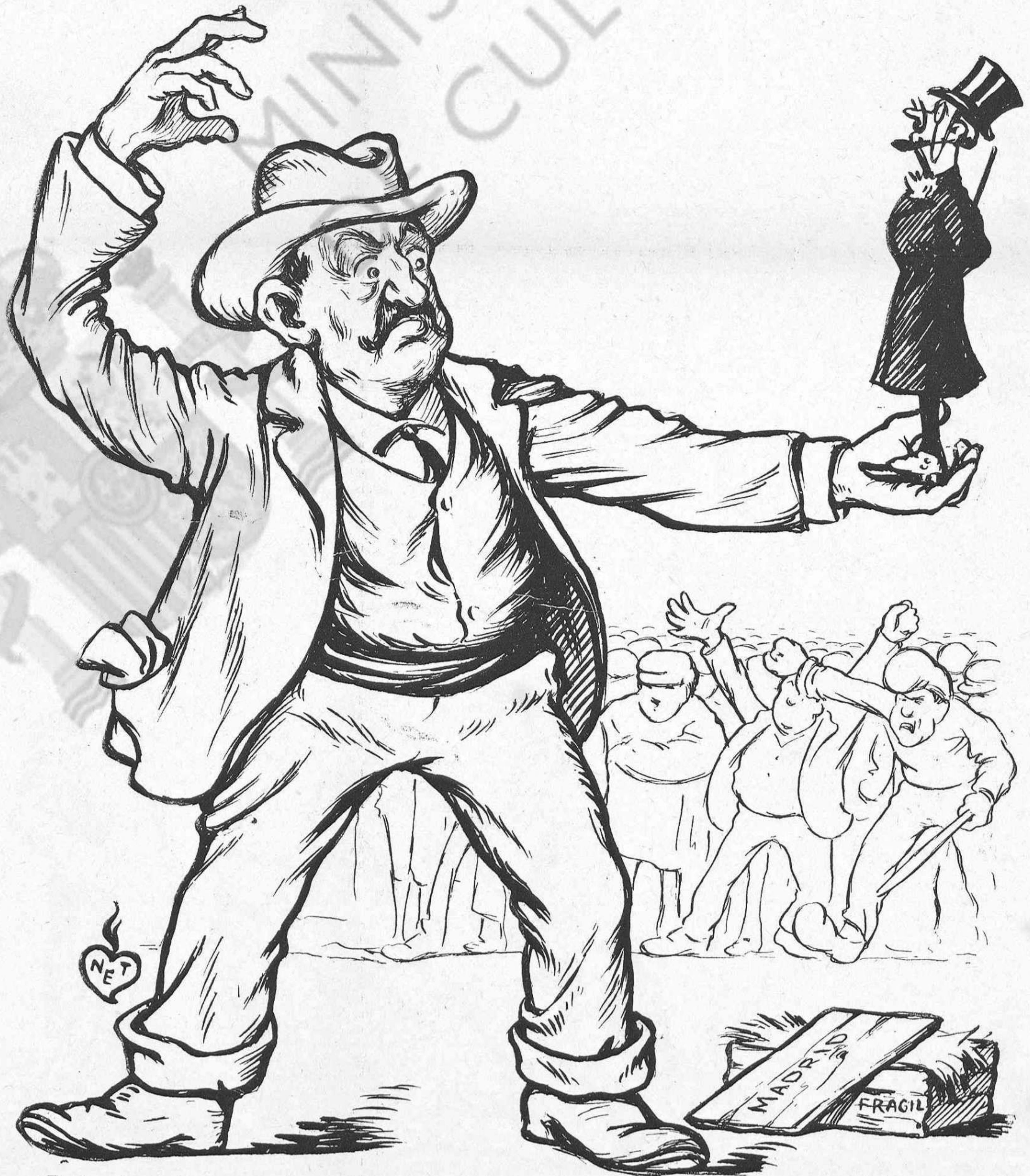
EL CACICH:—¡De Madrid me lo envían!... ¡Ja ho saben. Qui no 'l voti que s' amaneixi: á qui 'l voti, carta blanca per tot.