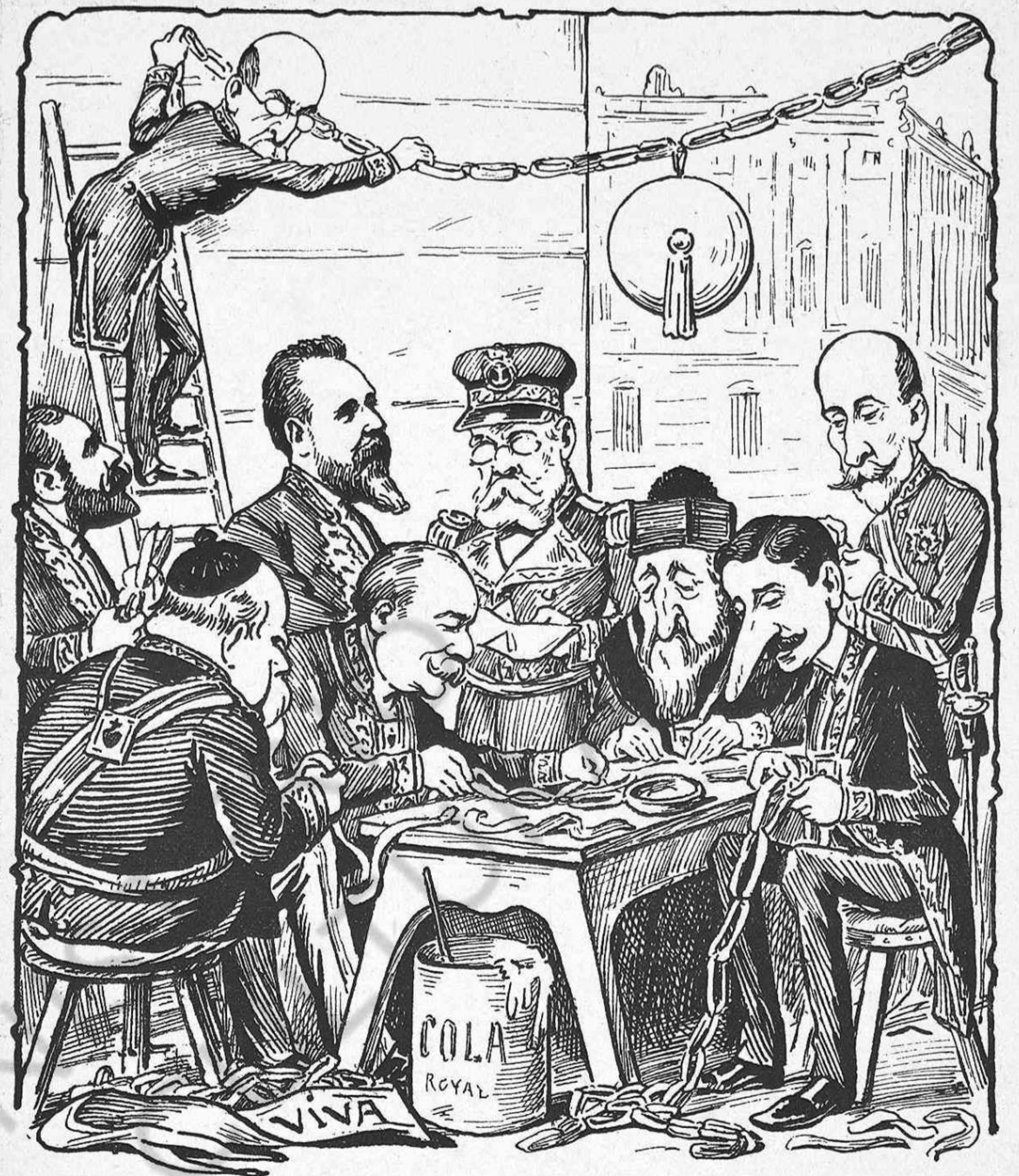
Y es que tenim las bodas de la princesa al damunt y se 'ls feya tart, per preparar adorns... ¡Pobres criaturas!