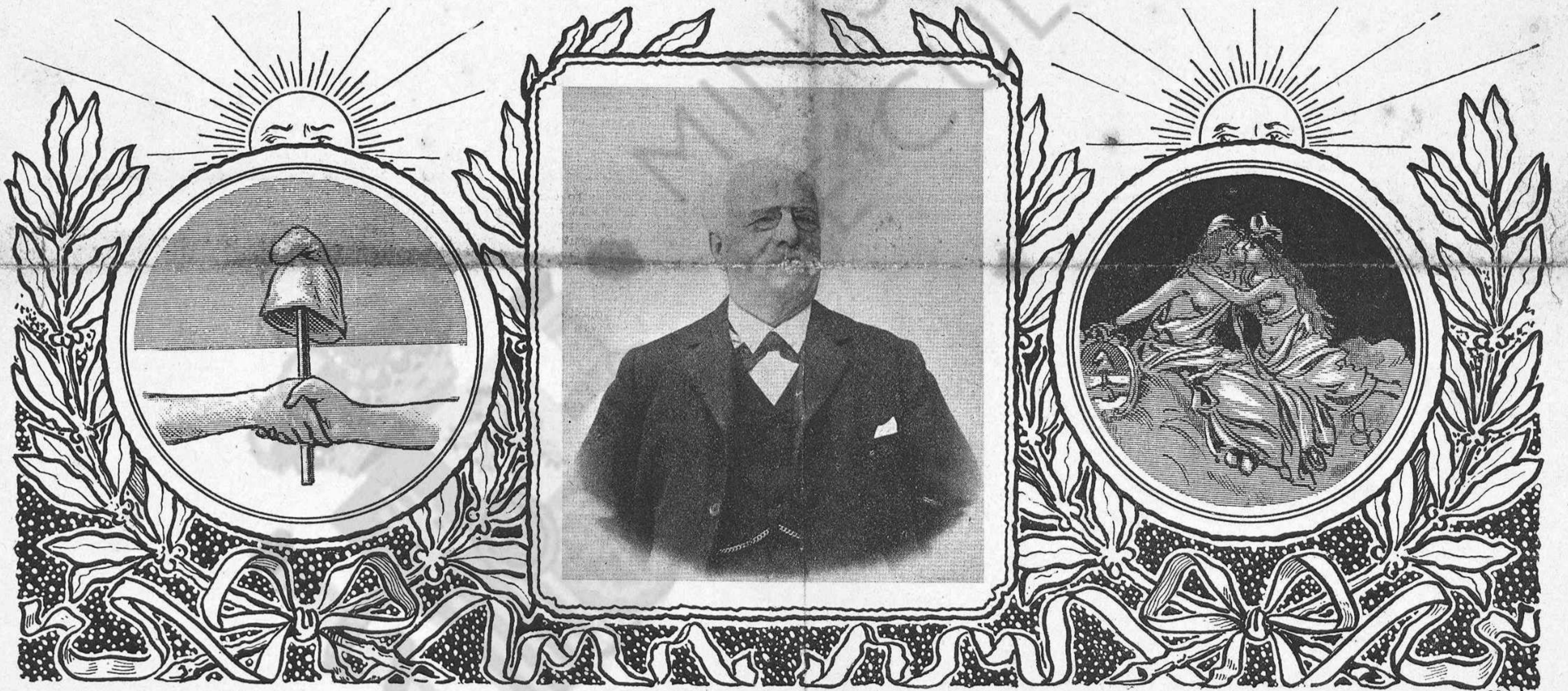
L'escut de la República Argentina.

PREU DE SUSCRIPCIÓ: Fora de Barcelona cada trimestre ESPANYA pessetas 1'50—Cuba, Puerto Rico y Extranjer, 2'50