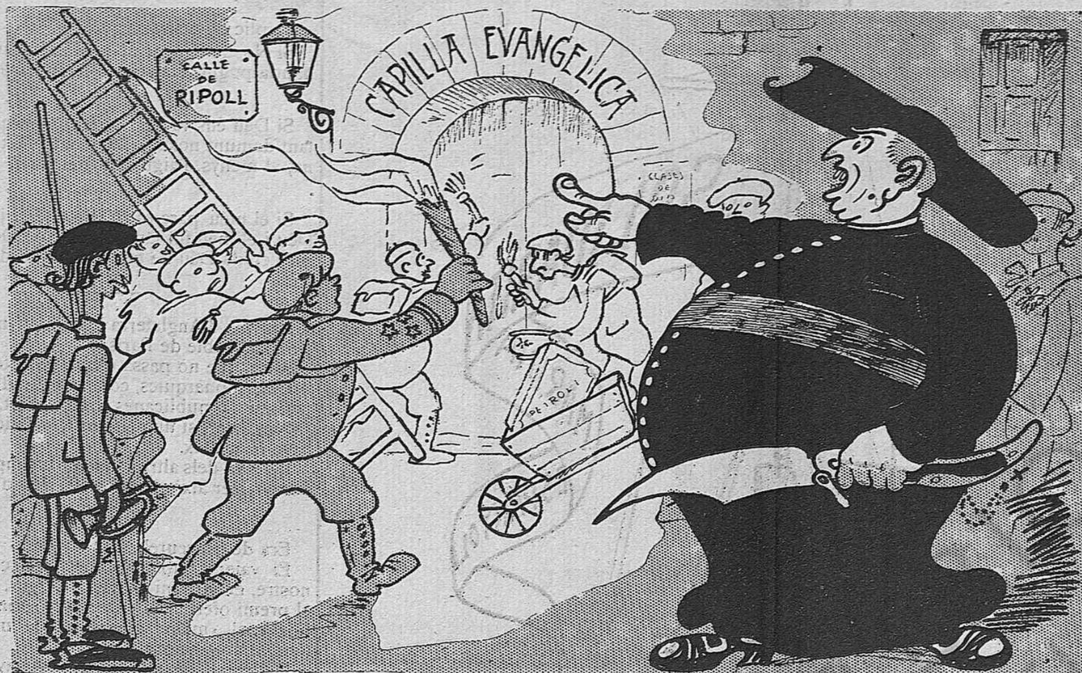
—Sigueu-hi, minyons!. . Ja que no volen aigua beneïta,... petroli i un misto!

dèu o dotze regidors, i, halà!, a rodar per aquests mons de Déu en busca d'un elefant que substituïxi a l'Avi.