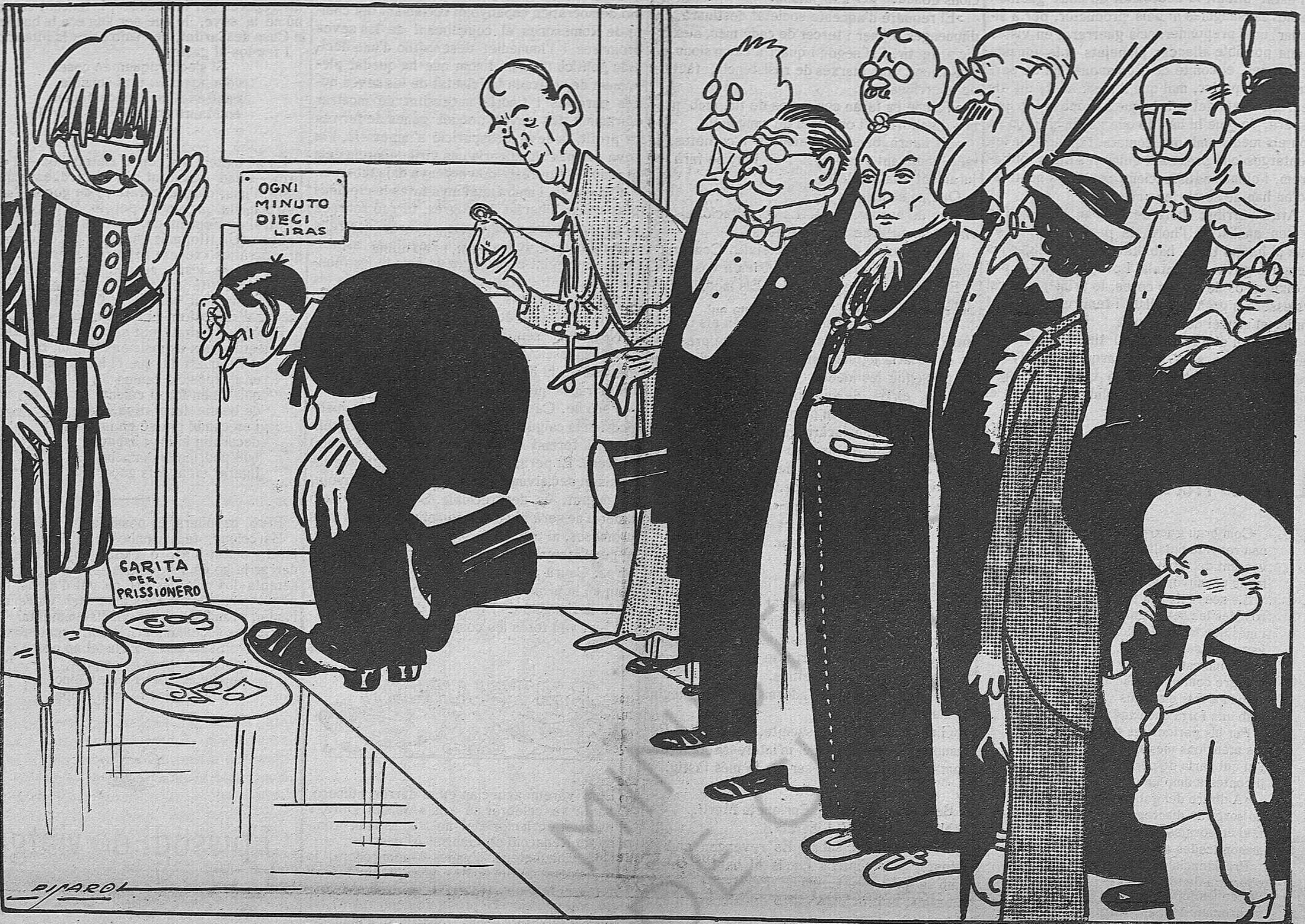
—Jo sí que puc dir que he anat a Roma i no he vist al Papa!