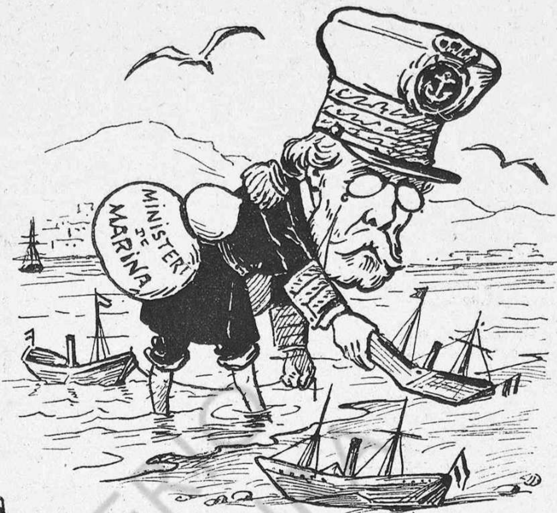
--Trayém els barquets a terra, no fos cas que ab aquest ayret se'm cap-giréssin.