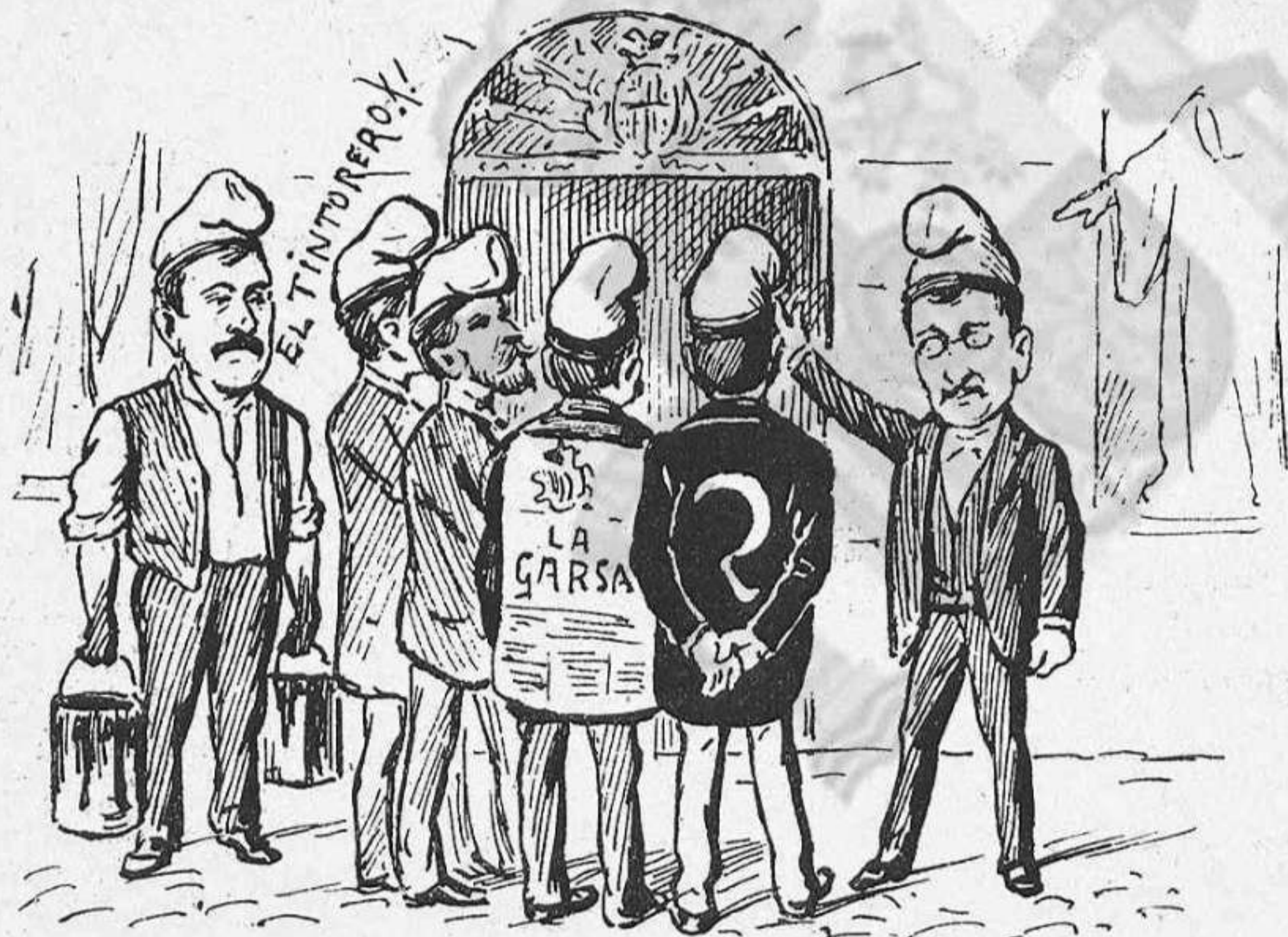
La colla del cop de fals esperant que a la Casa de la Vila 'ls cridin.