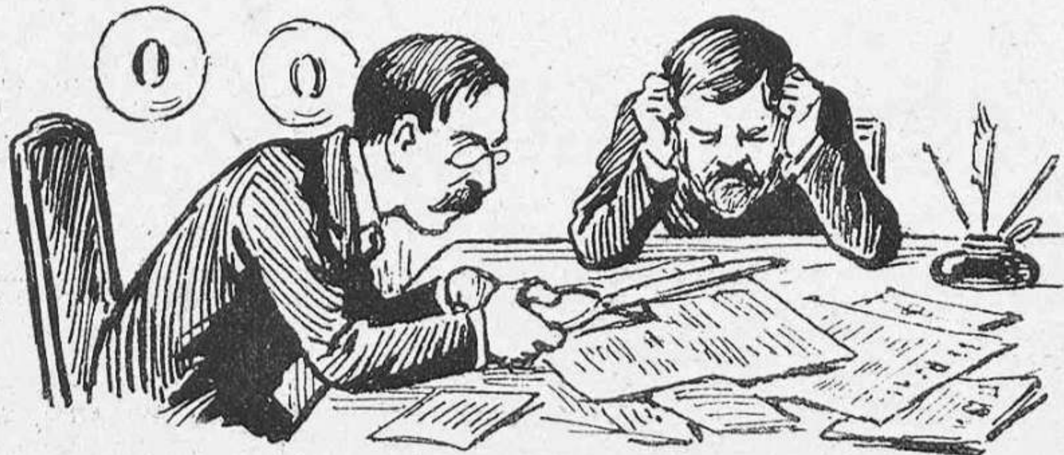
En confiança, ciutadans; la premsa cau de las mans.