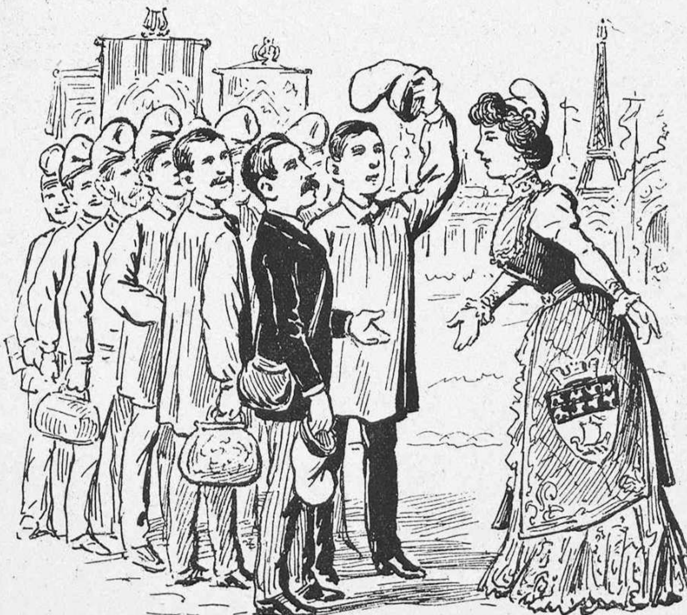
ARRIBADA DELS COROS CATALANS A PARIS:—¡Salut, companys, aqui es a casa vostra!