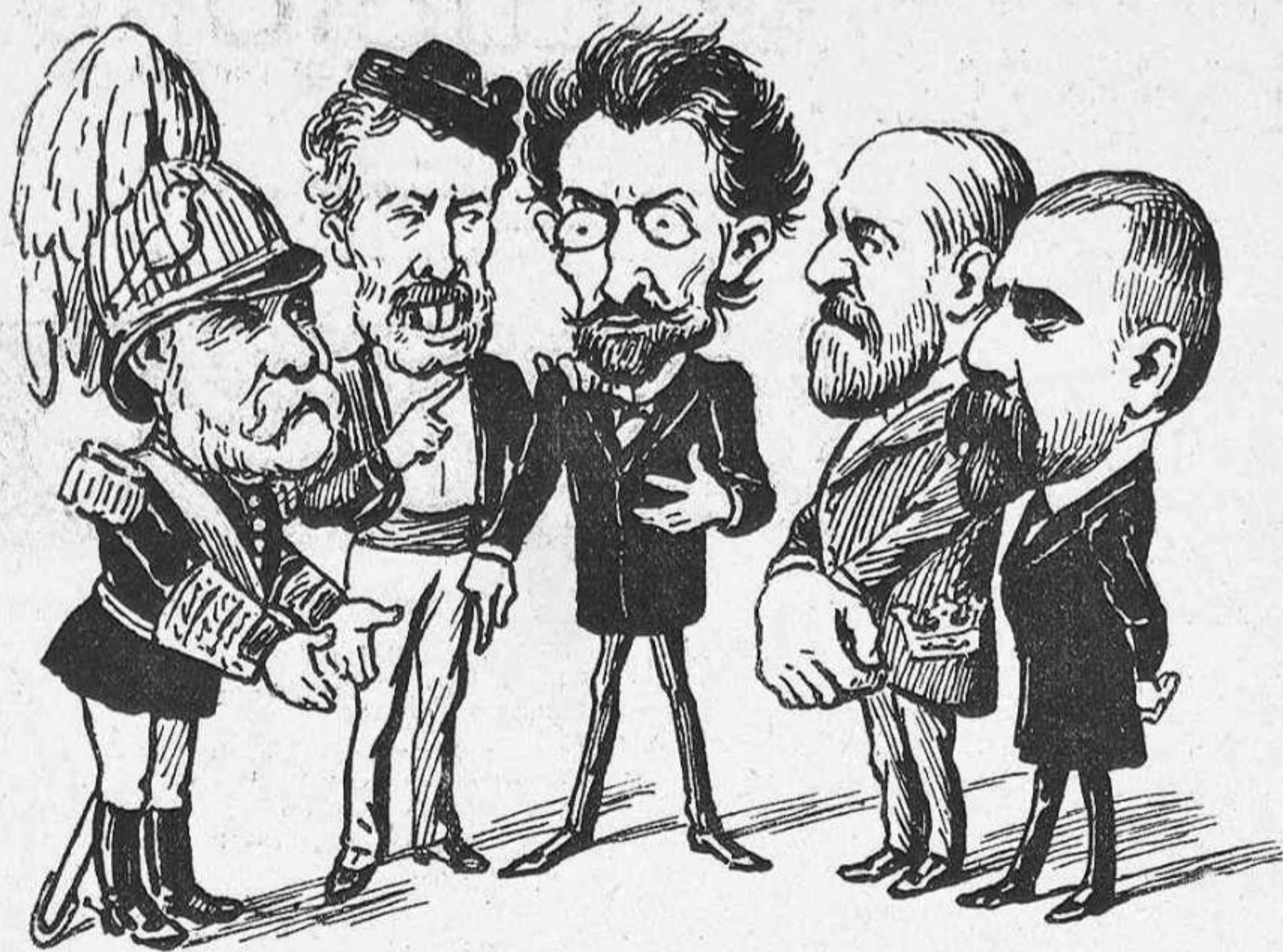
¡Pobre señor Paraiso! Va con malas compañías.