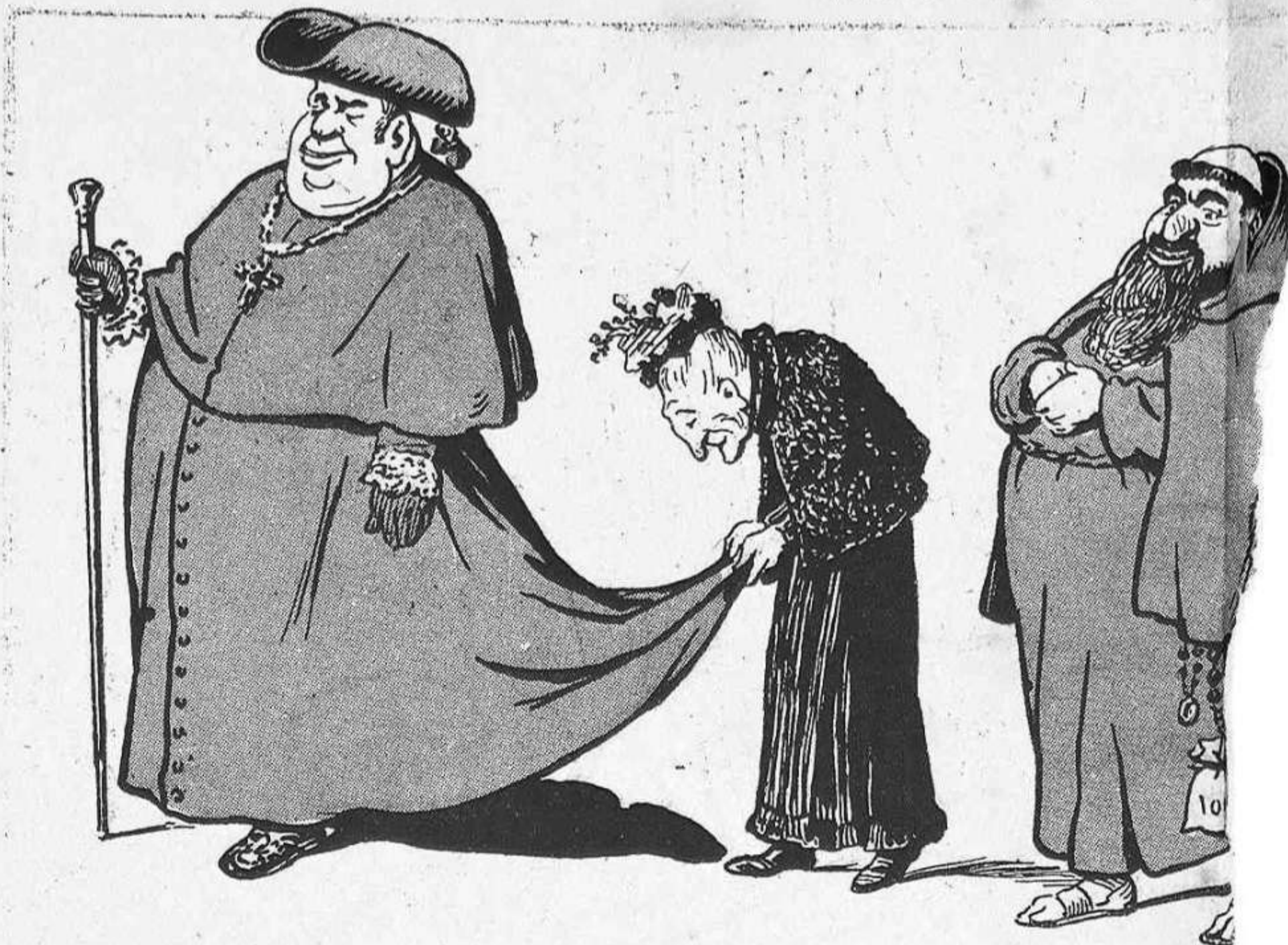
Sistema de anar á remolch, una mica car, pero espiritualment se en malas tentacions.

»Y veliaquí que al notarho 'l mossén, va apelar á una estratagemma, cridant desde dintre: »—Tots els que 's tinguin per cabrons ja poden entrar. »Davant de una tal resposta, cap de aquells ve-hins—figúris si serán mansos!—s' atreví á donar un pas avant, á fi de no passar per banyuts.»