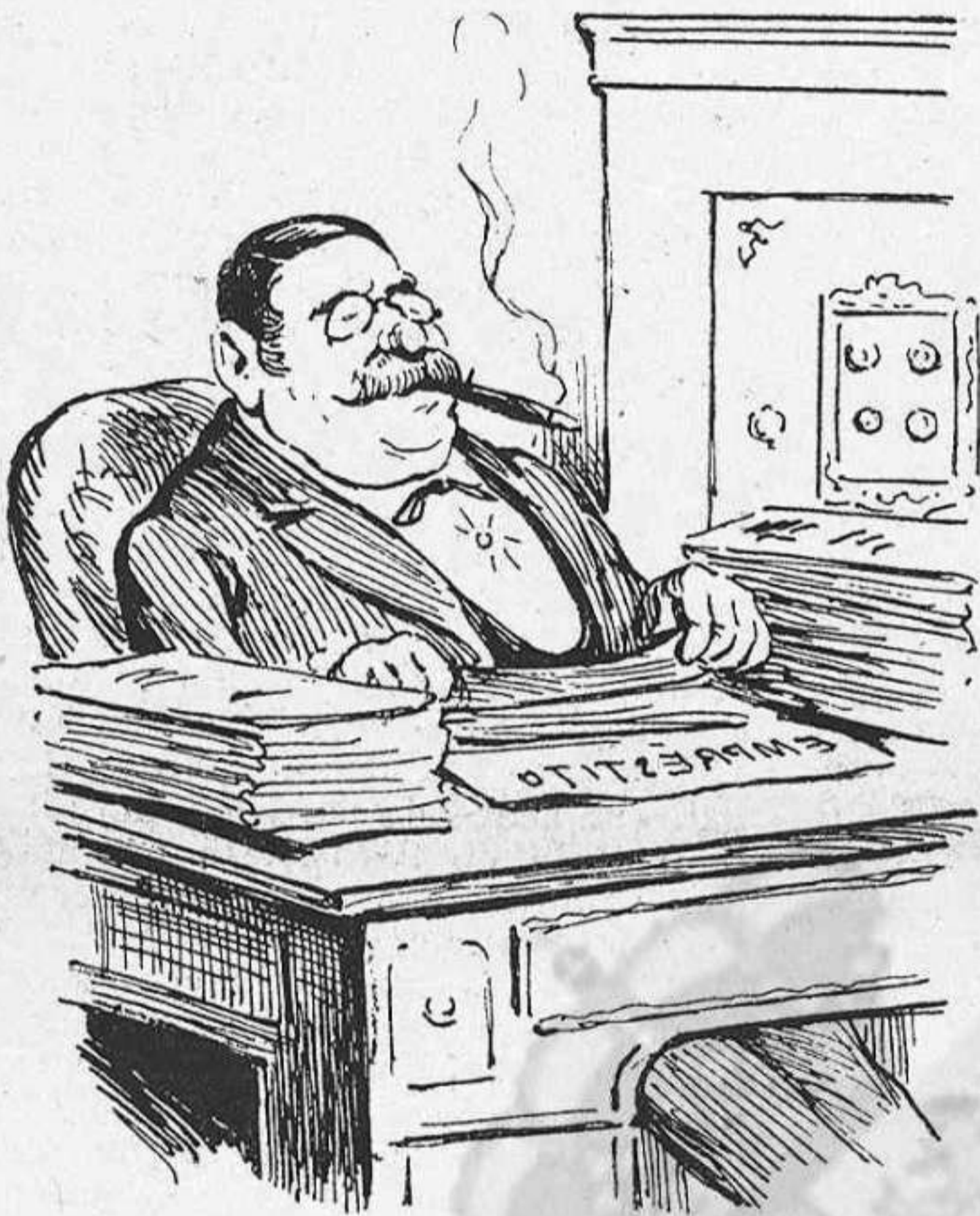
AVUY.—A qualsevol casa de Banca.

—Digans la bonaventura. —¿La bona? —O sinó, la mala: estém ja curats d'espant. —Miréu qu' una, de vegadas, diu coses de cert tenor que al oyent no li fan gracia... —Parla sense pór de res. —¿De debó? —Tens carta blanca. La gitana pren la má del caballer de la daga, y examinantla un moment, comensa á dí ab veu pausada: —Tú acabarás á Sant-Boy. —Bon comensament. ¡Mil gracias! —No las donguis tan depressa, que molt més bo es lo que falta. T' has rifat tant al país desmentintli á mitja tarde lo que al matí li has promés, que la gent al fi, empipada, no 't deixarà treure 'l nas que no corri á esbalotarte, y en veyente obrir la boca te la tapparà cridante: «Calla, florentí farsant, polítich de quatre caras; vé, si vols, á enganyá als xinos, que aquí ja 't coneixém massa.» Y aixó repetit un dia, y un altre y després un altre, acabarà, com t' hi dit, per ferte perdre la latxa y convertí 'l teu cervell en un' orga destrempada. —Bonich pervenir, pubilla, si aixó hagués de realitzar-se. —Ja pots pujarhi de peus: no acostumo á equivocar-me,