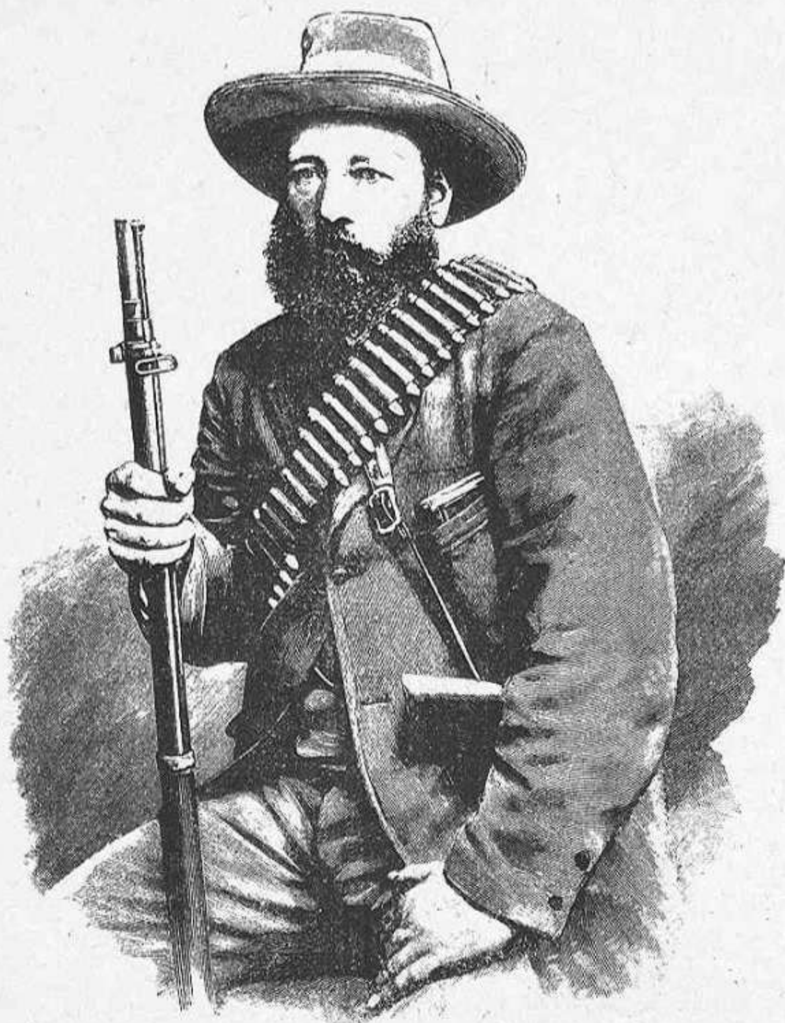
El general KRONGE, presoner dels inglesos.