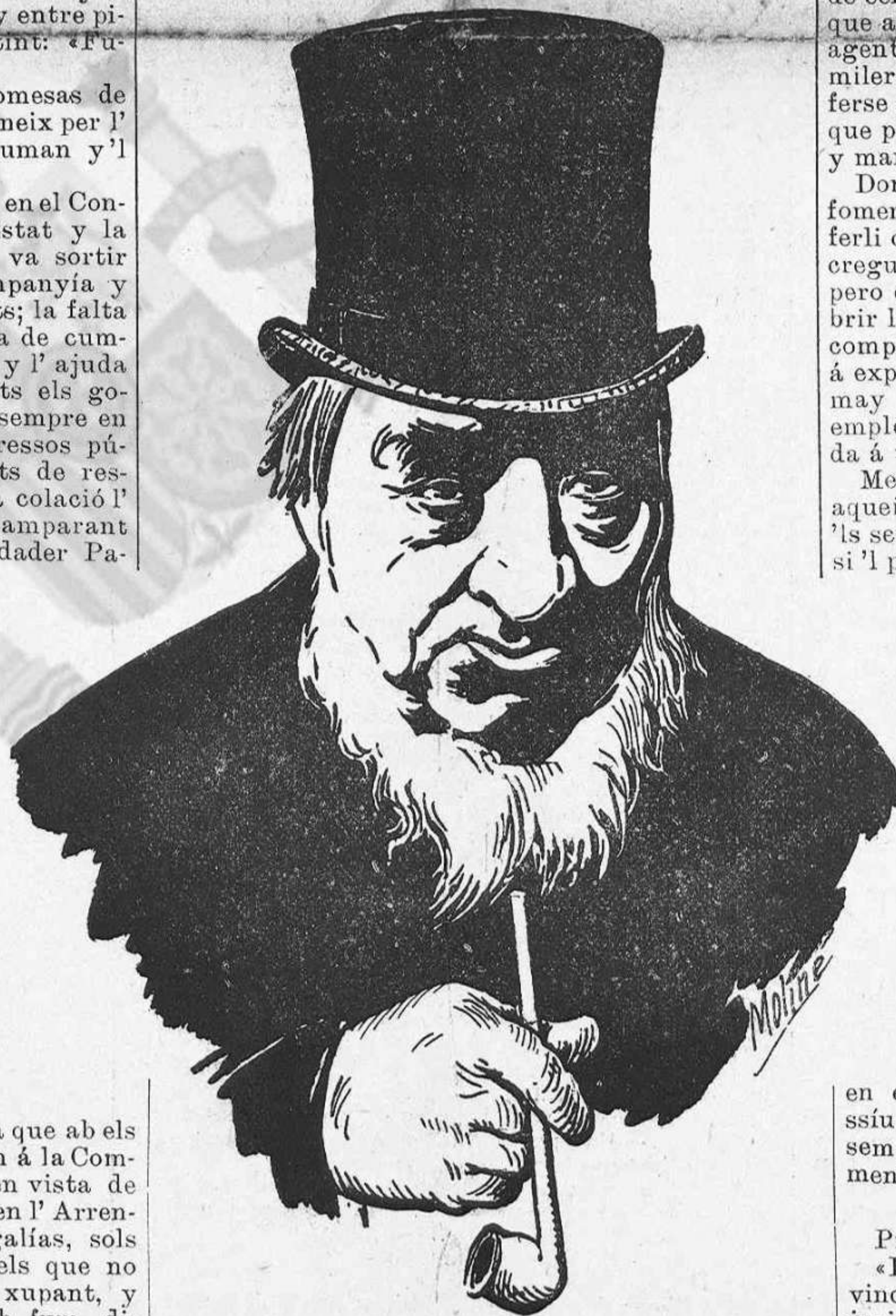
KRUGER, Prsident de la República del Transvaal.

nospreci de una de las cláusulas del contracte, vé impedit de fet el cultiu del tabaco á Espanya.