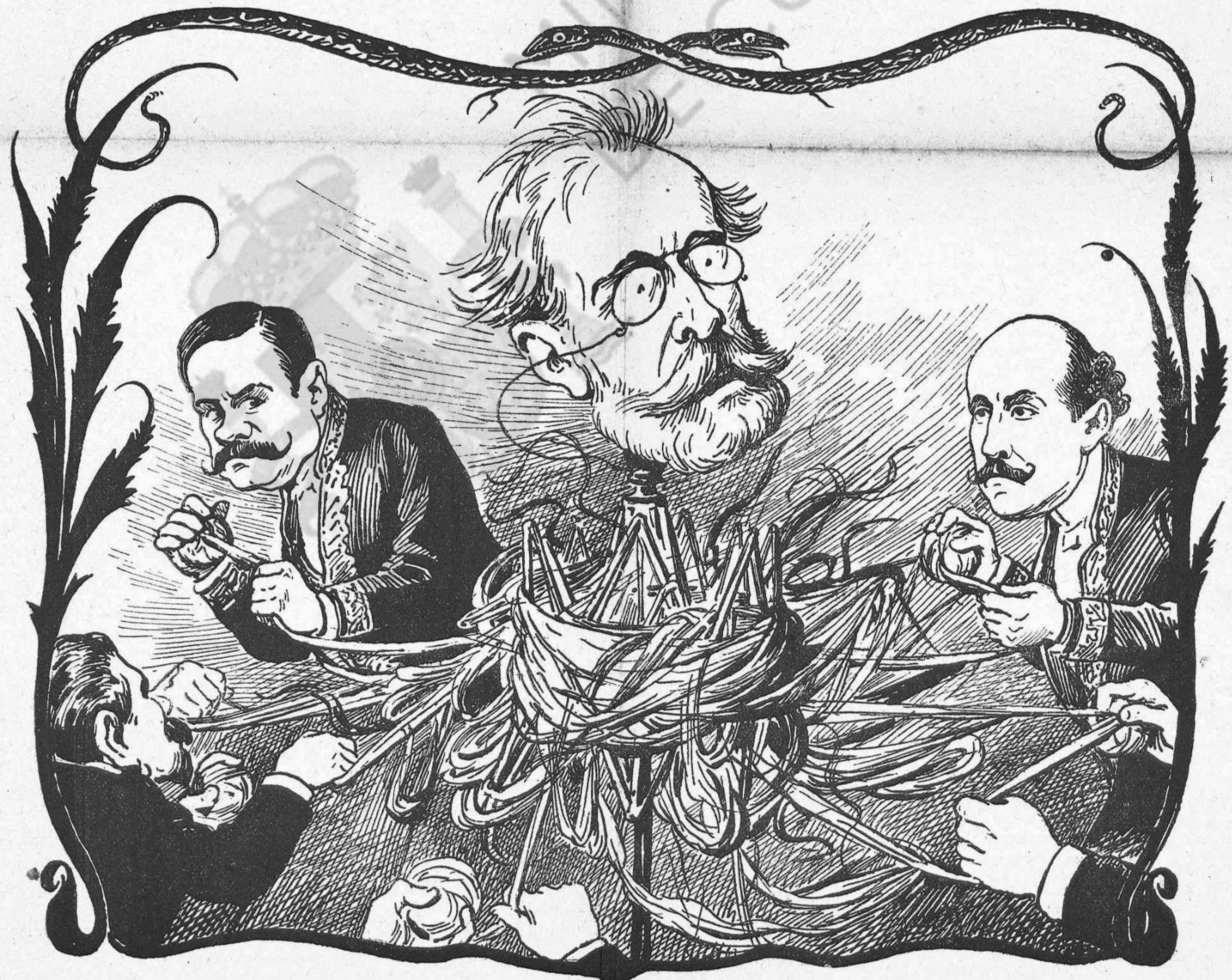
Per haverlo fet rodar en tots sentits, mirin si n' està d' embullada aquesta troca.