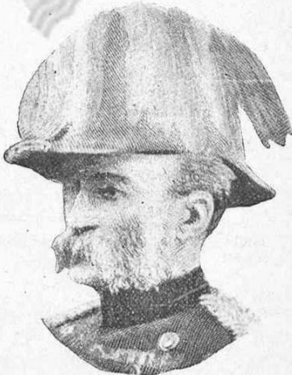
Tinent general Sir C. F. Clery , Comandant de la 2. a divisió del 1. er Cos.