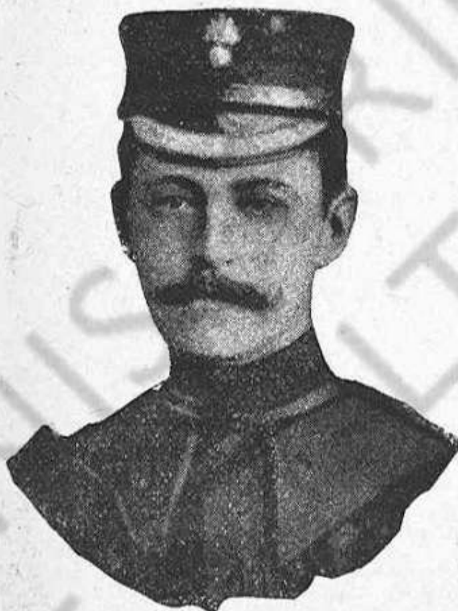
Major Count Gleichen , Ajudant del general Redvers-Buller.