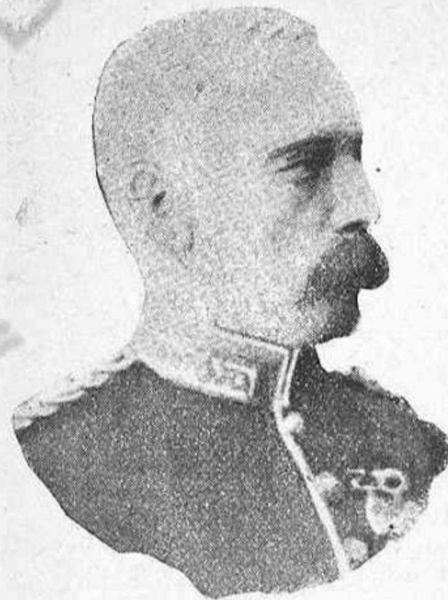
Lo general J. H. Yule , Comandant en jefe dal exercit de Nathal.