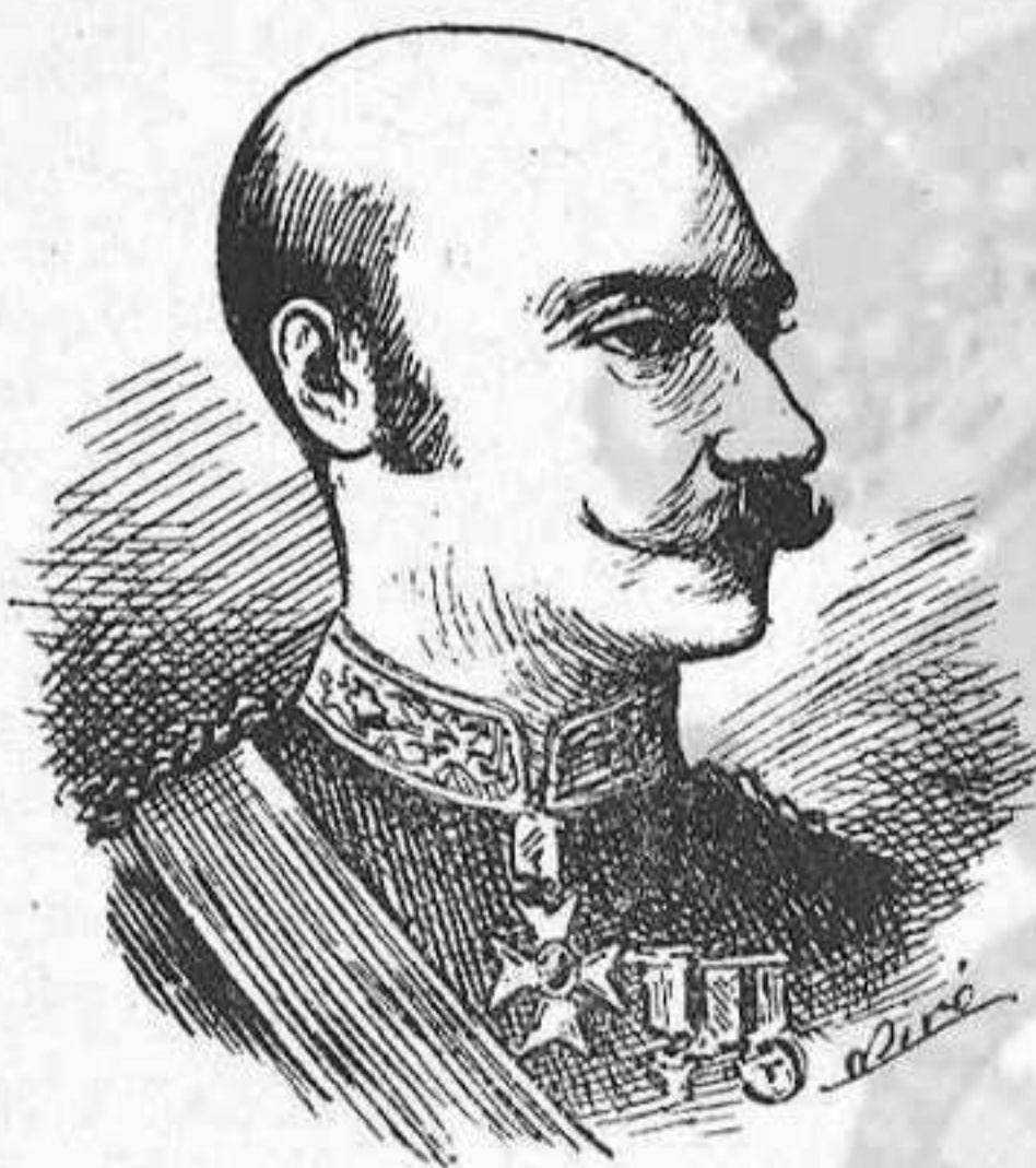
Lo general White , derrotat en las inmediacions de Ladysmith.