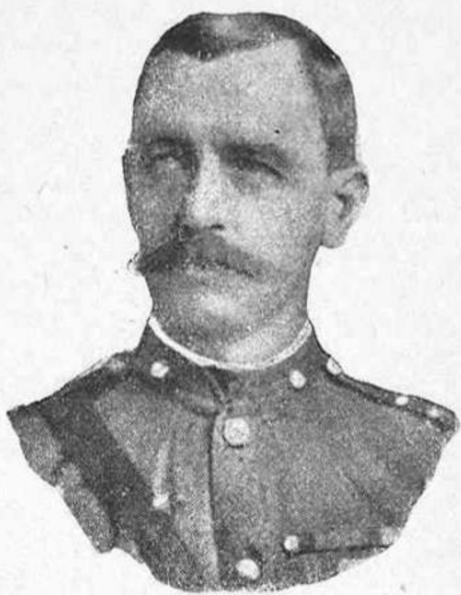
Coronel F. W. Kitchener , del segon Regiment de Yorkshire.