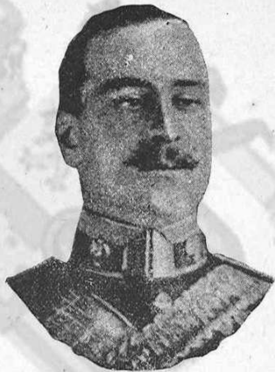
Capità Princep Francisco de Teck , del real regiment de dragons.