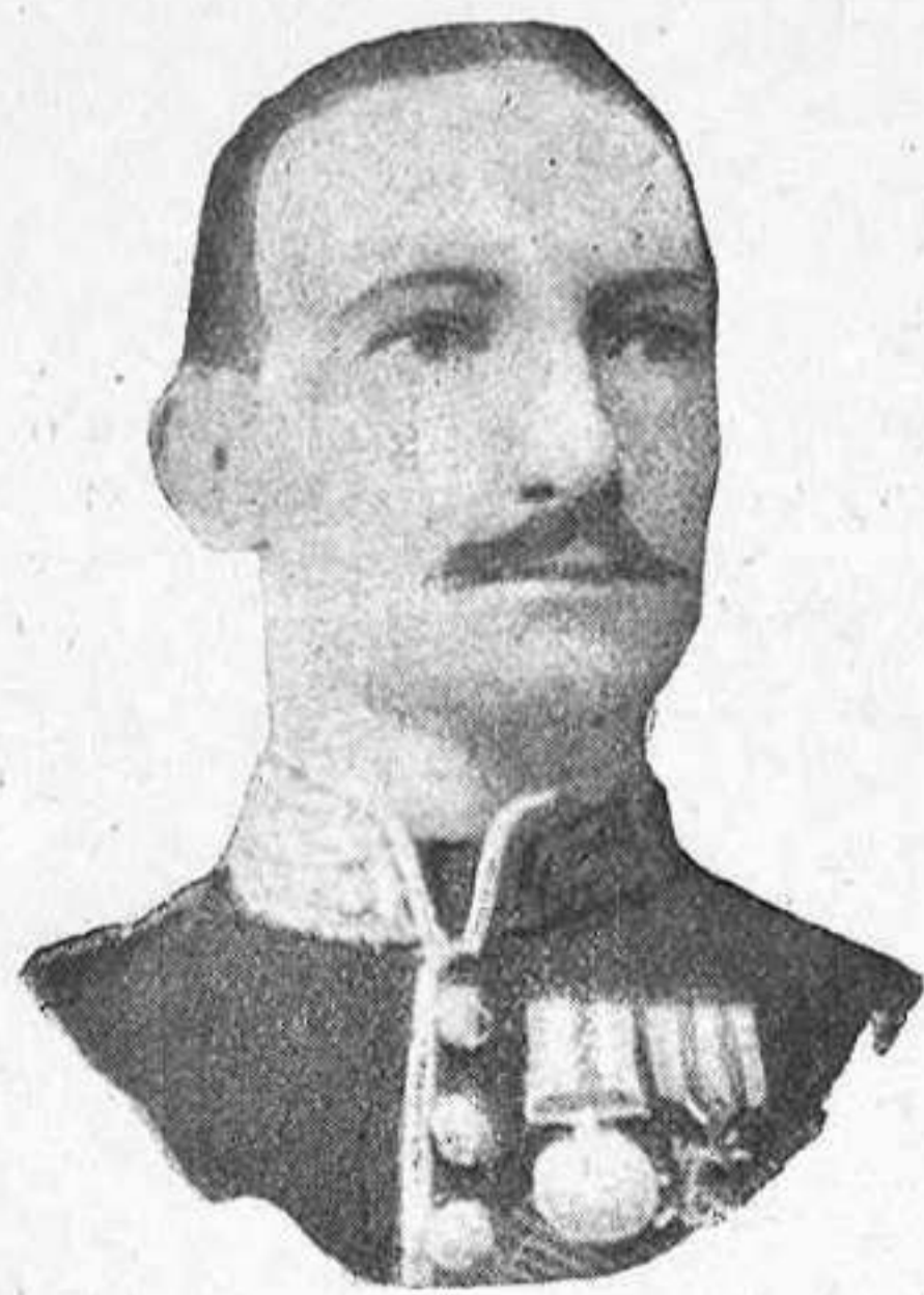
Lo major Baden-Powell , del batalló de Guardias escocesos.