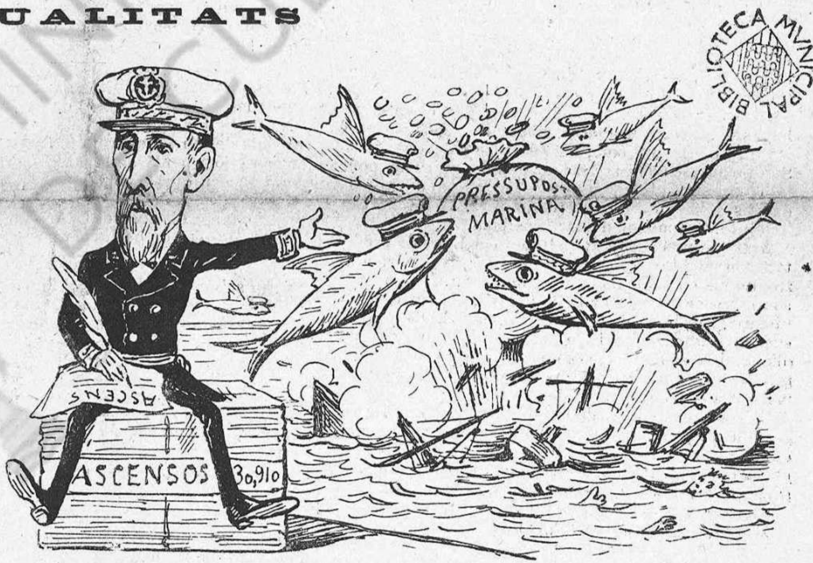
Lo mon al revés: per que hi haja ascensos, hi ha d' haver desastres.