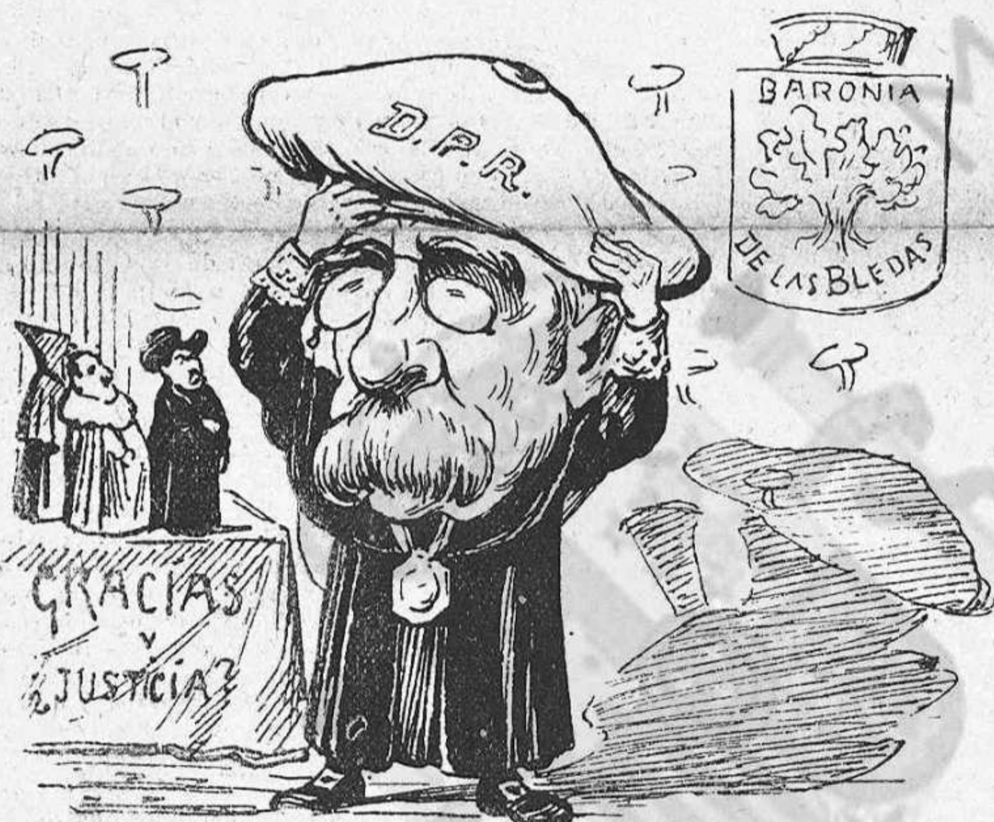
—Jo soch més liberal que Riego!... (Durán y Bledas.)