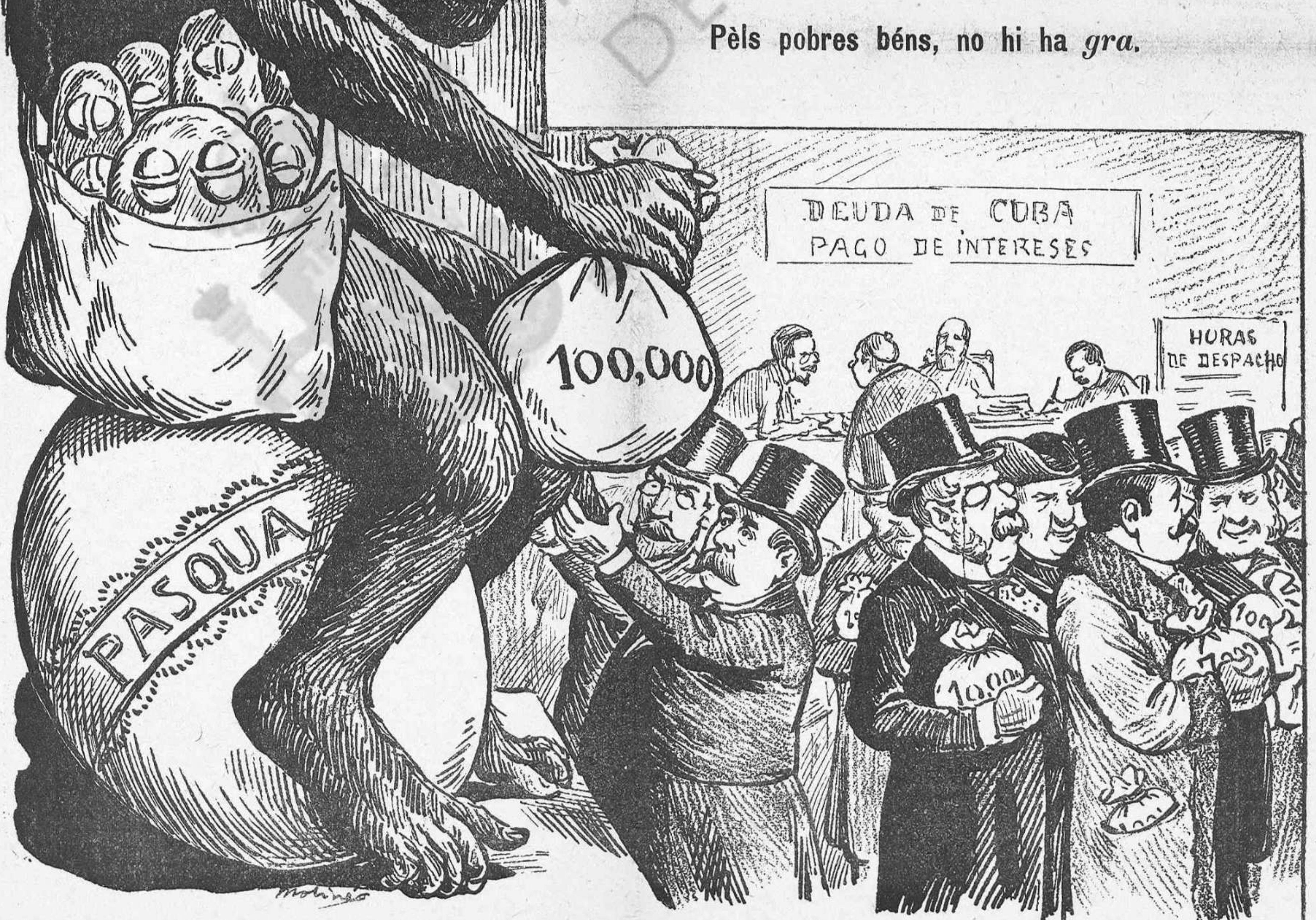
Pèls pastors, sempre n' hi ha.