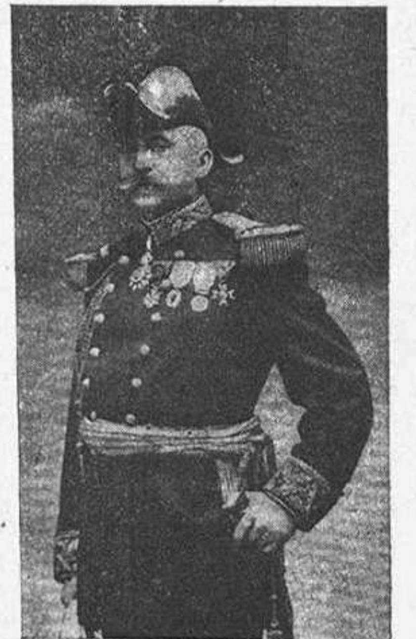
El general Roget

Un periódich ha dit:—Precisa que 'l govern ens retorni á Derouléde lo mes prompte possible: París no pot estar sense 'l seu putxinetli que 'l diverteixi.—J.