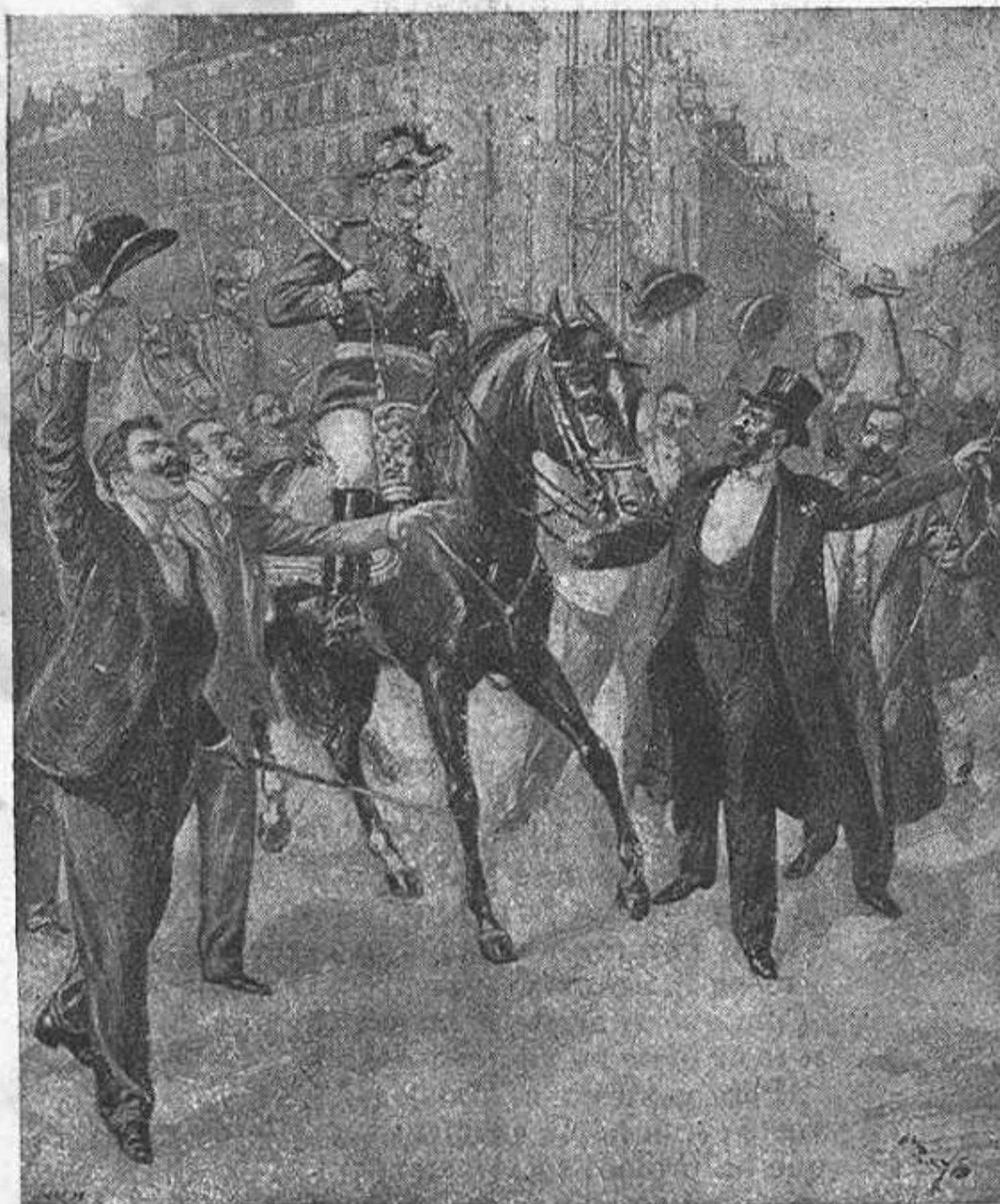
Derouléde excitant al general Roget á pronunciarse.

exclusivament per compte propi. Sent aixís el govern ha decidit entragarlos á l' acció dels tribunals ordinaris. Per ser diputats sigué necessari demanar á la Cámara autorisació pera encausarlos. La Cámara la concedí casi per unanimitat.