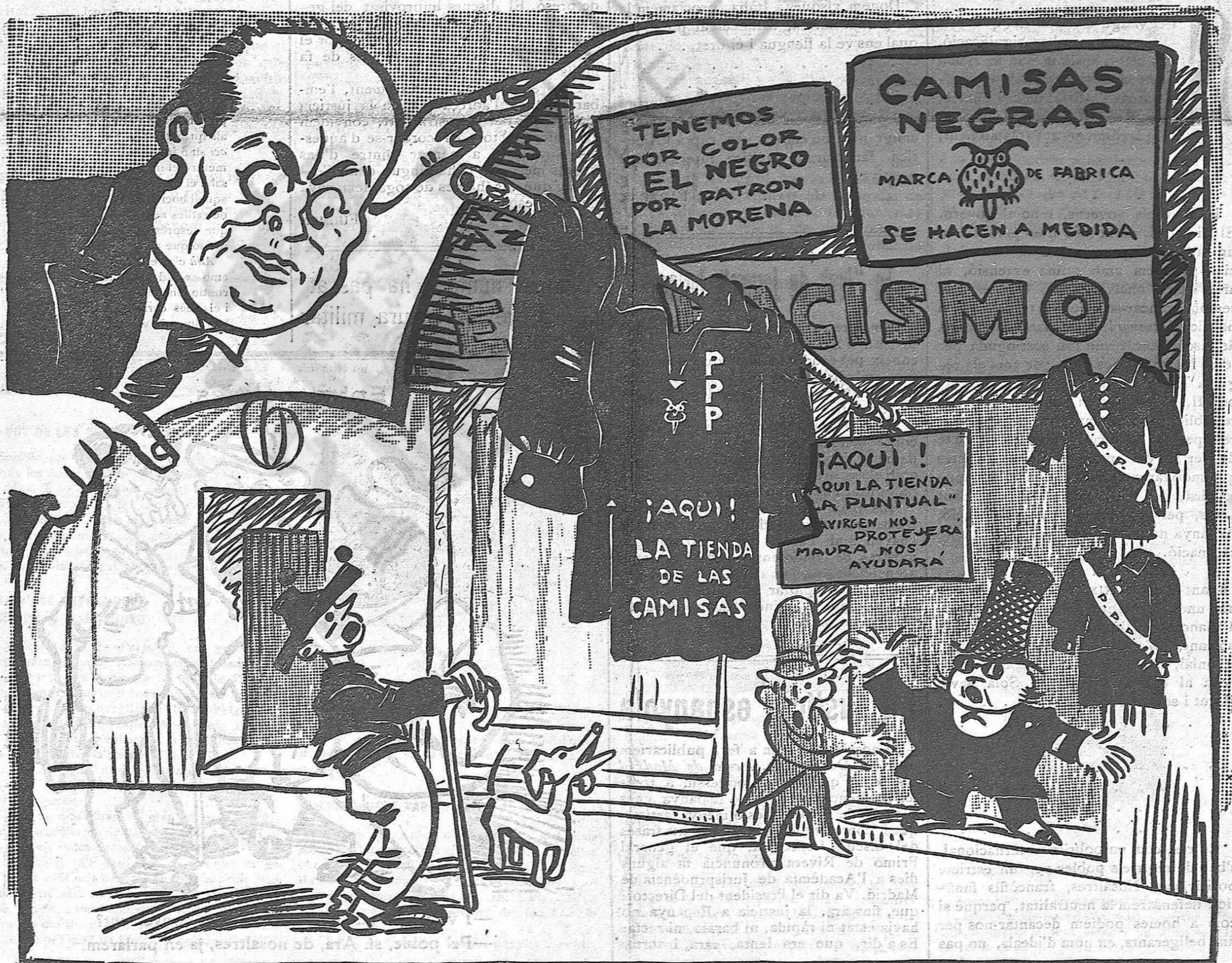
—Veig que a Espanya també han posat botiga de camises negres!