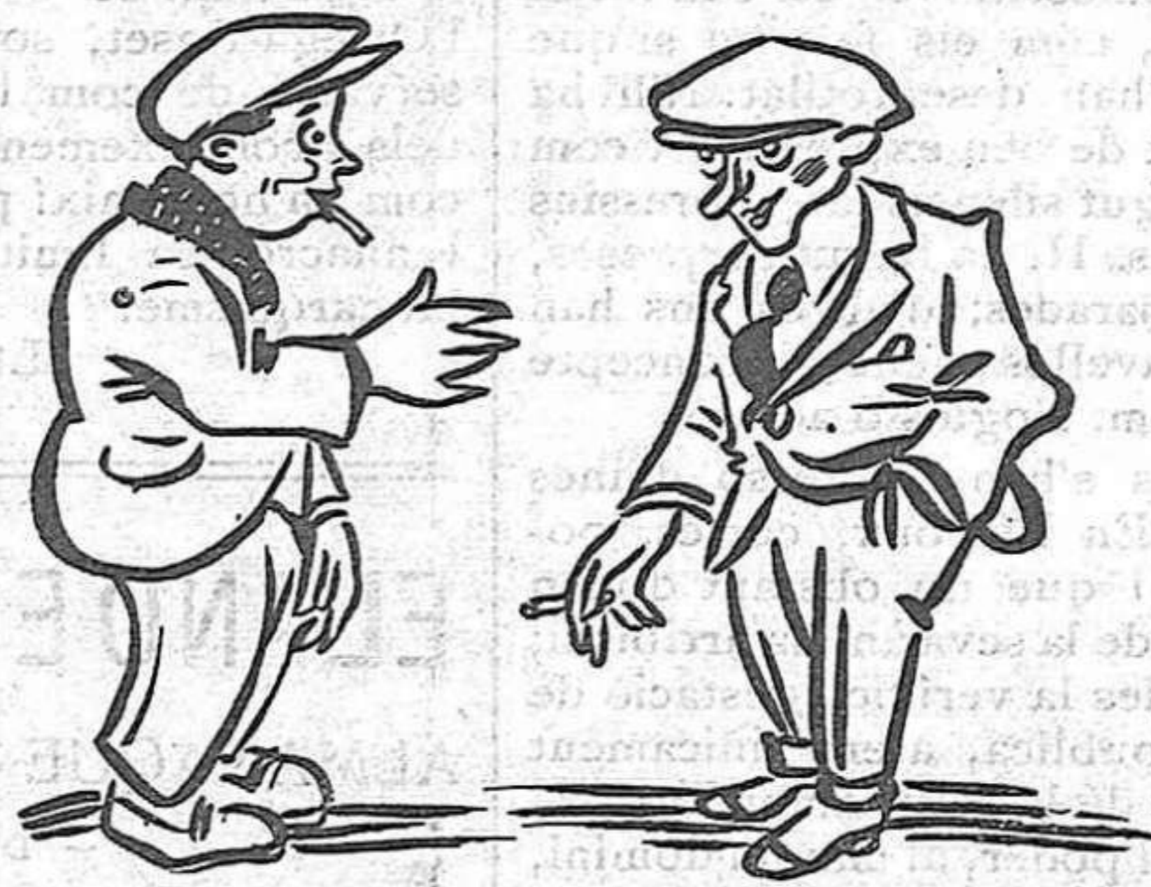
—Veus? Aquests són dels meus: enemics del matrimoni.