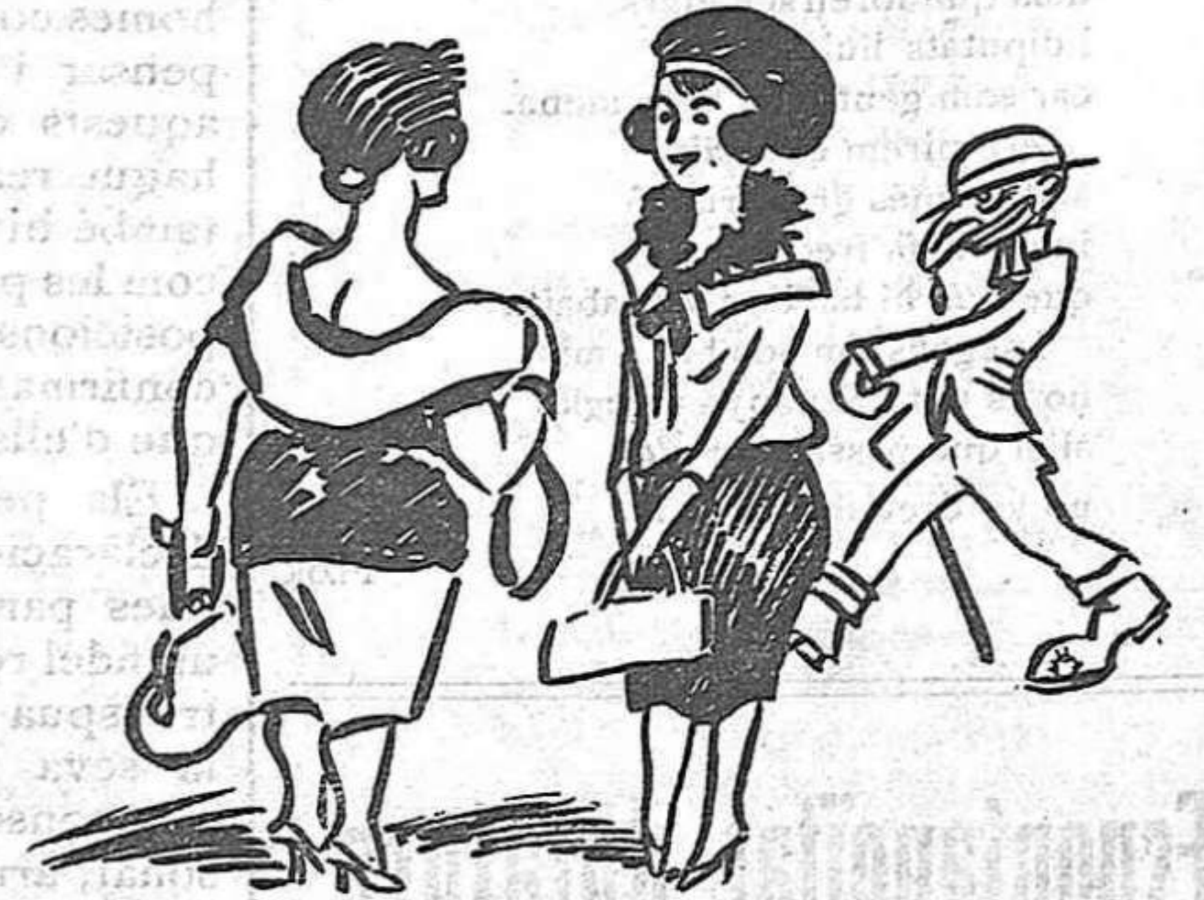
—Què vas de viatge? —Sí, m'he fet cantinera per a no separar-me dels de casa.