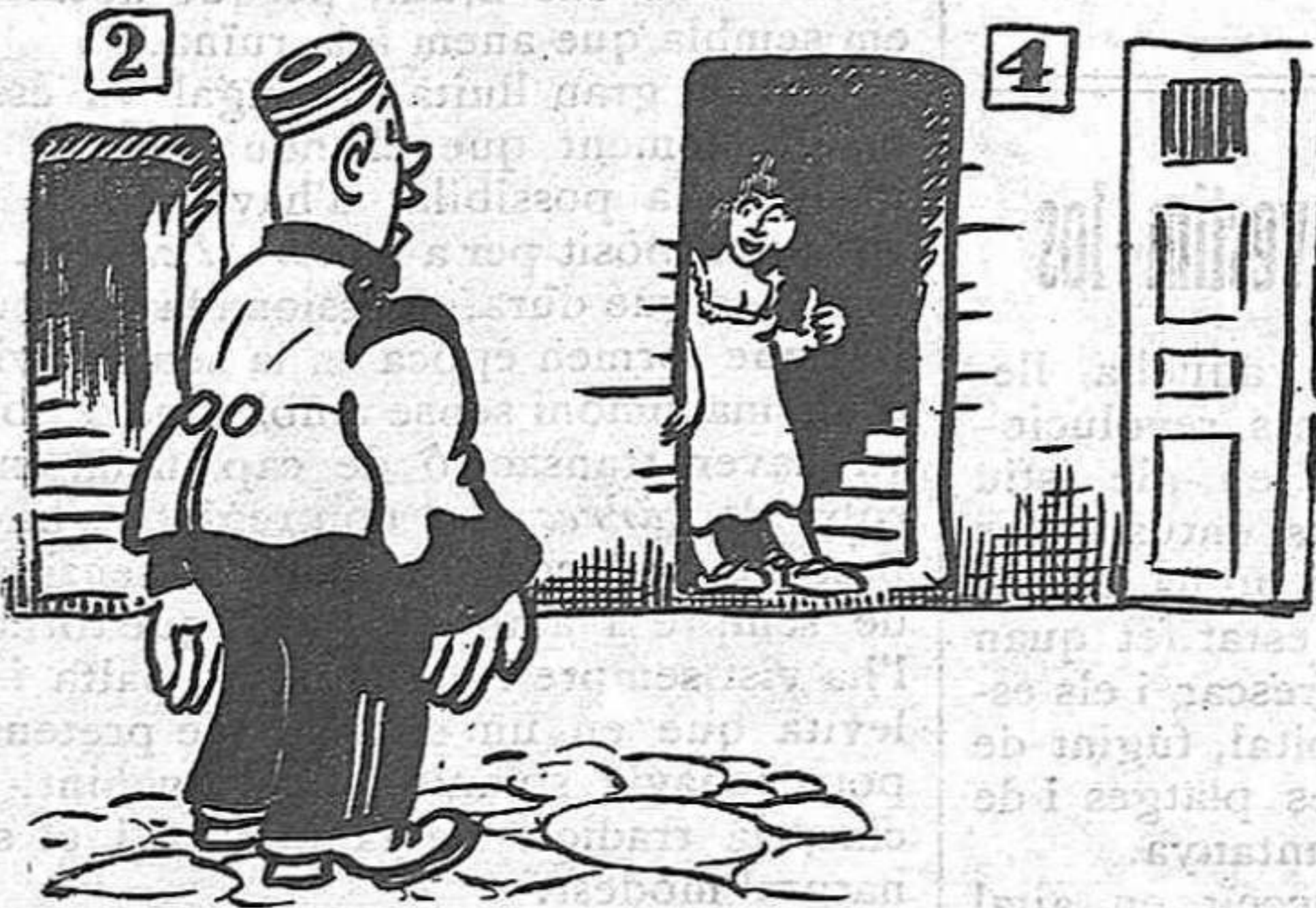
—Vina, macol! —No pas per ara, que ens han prohibit el matrimoni.