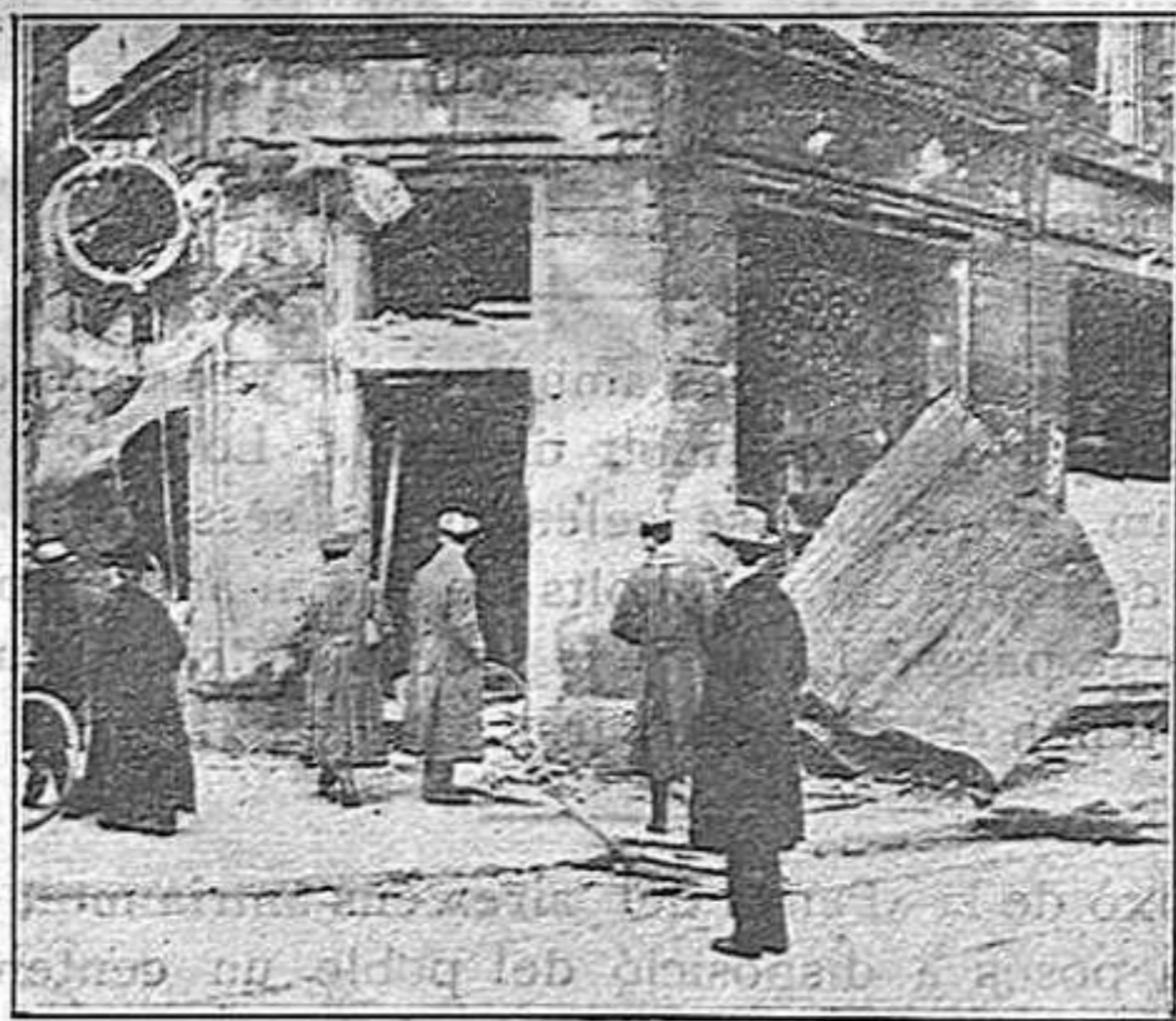
Una tenda saquejada i metrallada pels insurgents.

d'allà, o d'allà on vulgueu, impedit manifestacions a cop de sabre net contra gent indefensa? Per què hem vist troteig a les Rambles en, ple mig dia de diumenge, contra una manifestació,