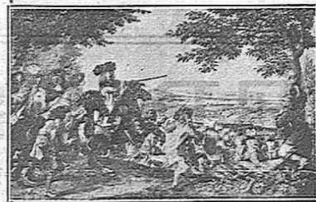
Un dels tapiços Gobelins del castell de Versalles.

I referent a l'altre tapiç robat, hem de dir que