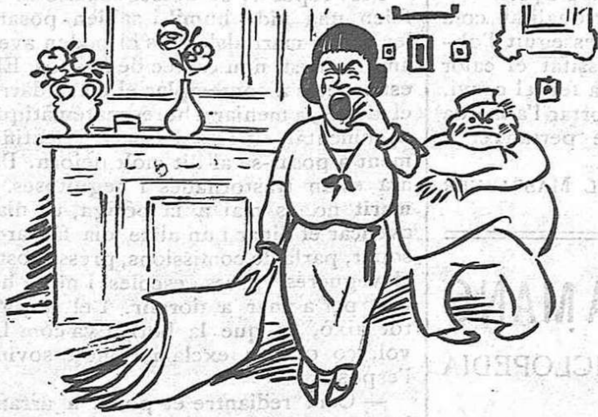
—Ai, Déu meu, que em prenen el marit ara que ve l'hivern i a les nits fa tant fred!