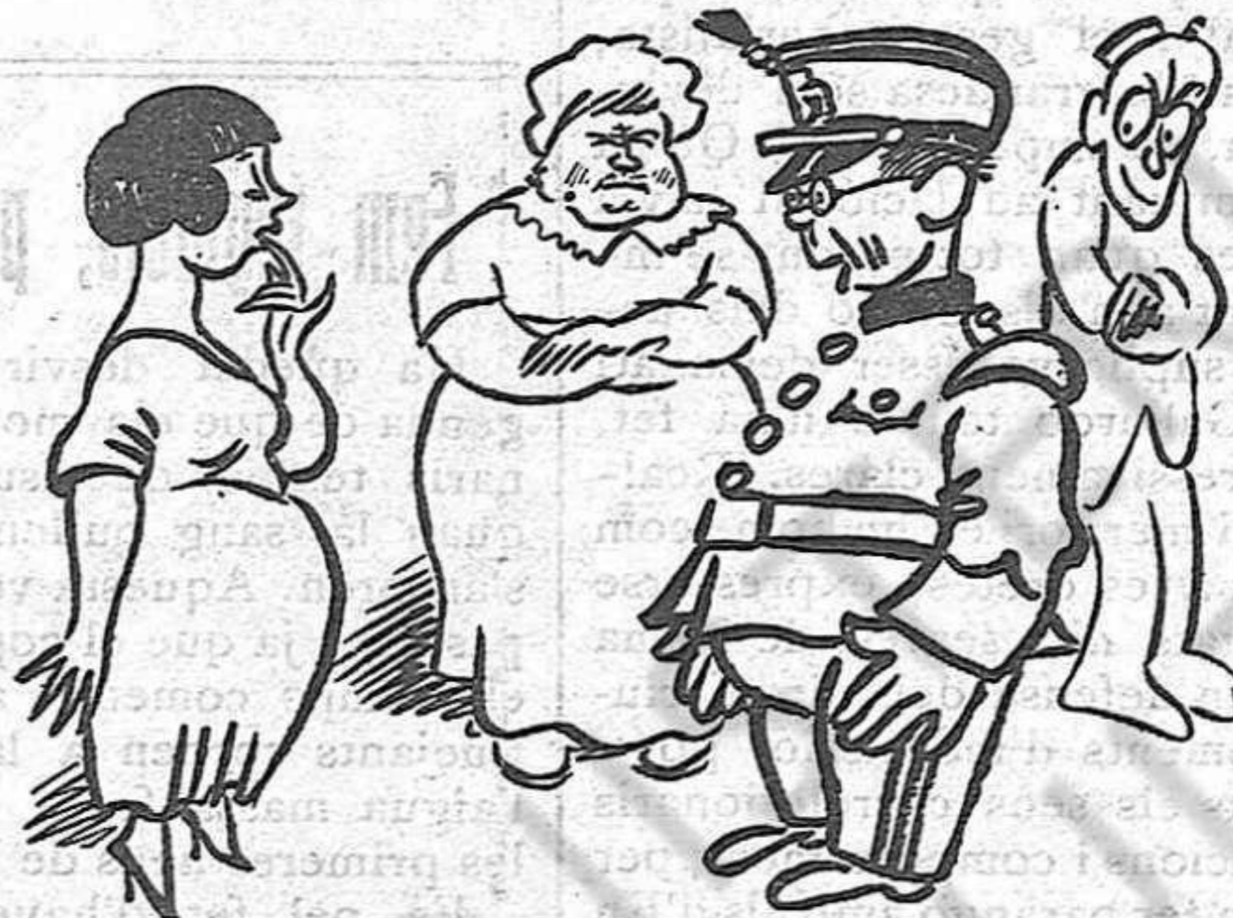
—«Hija yo no sabía que después no me dejarían casar!»