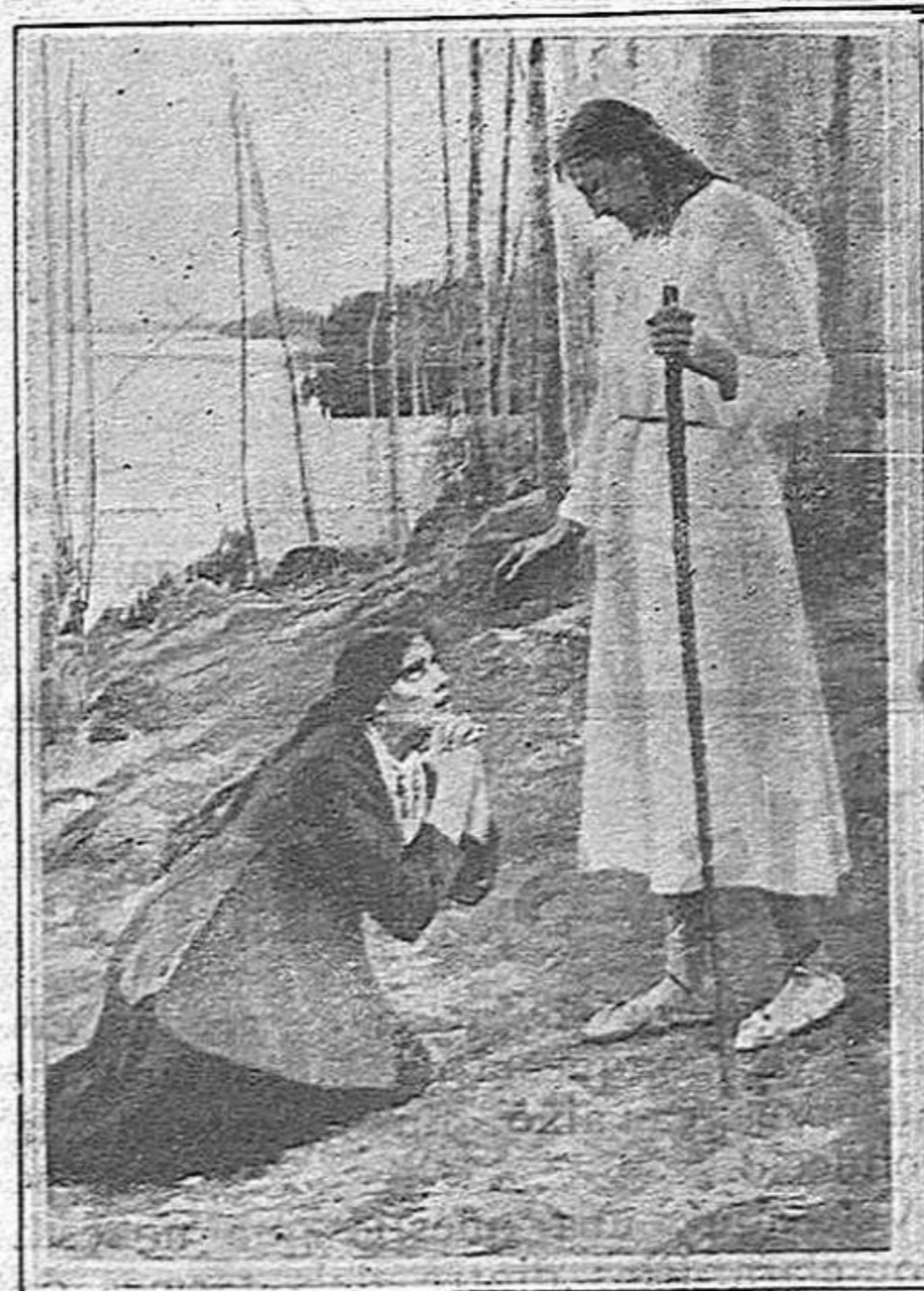
Crist i la Magdalena, interpretació d'Albert Edelfeldt

El pecat rau en la intenció. Aquest quadre d'Edelfeldt és una meravella d'expressió. Aquesta Magdalena prou pot simbolitzar l'humanitat arrossegada i embrutida.