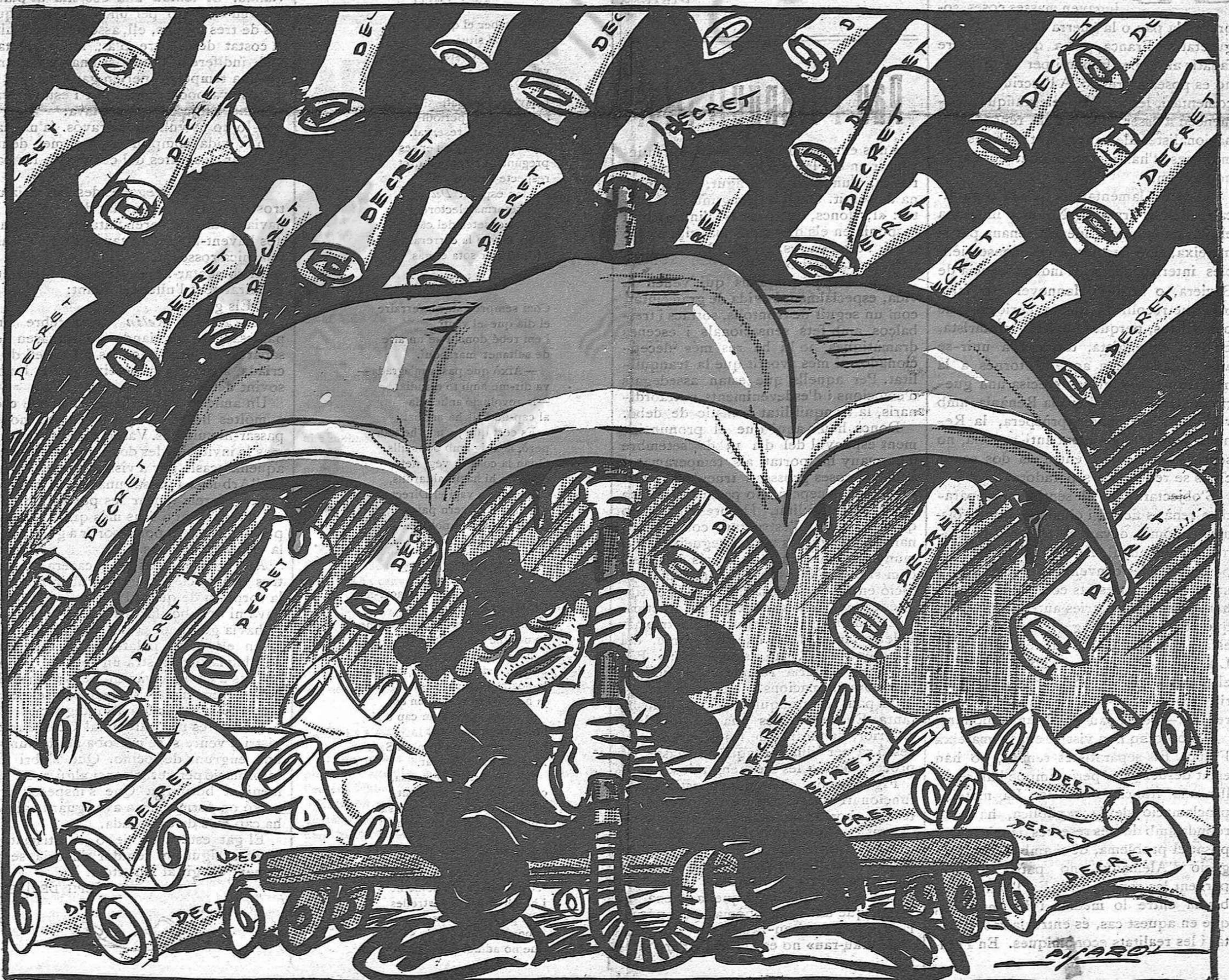
—Carai, potser Sant Pere en farà un grà massa! Això ja no és pluja, és pedregada!