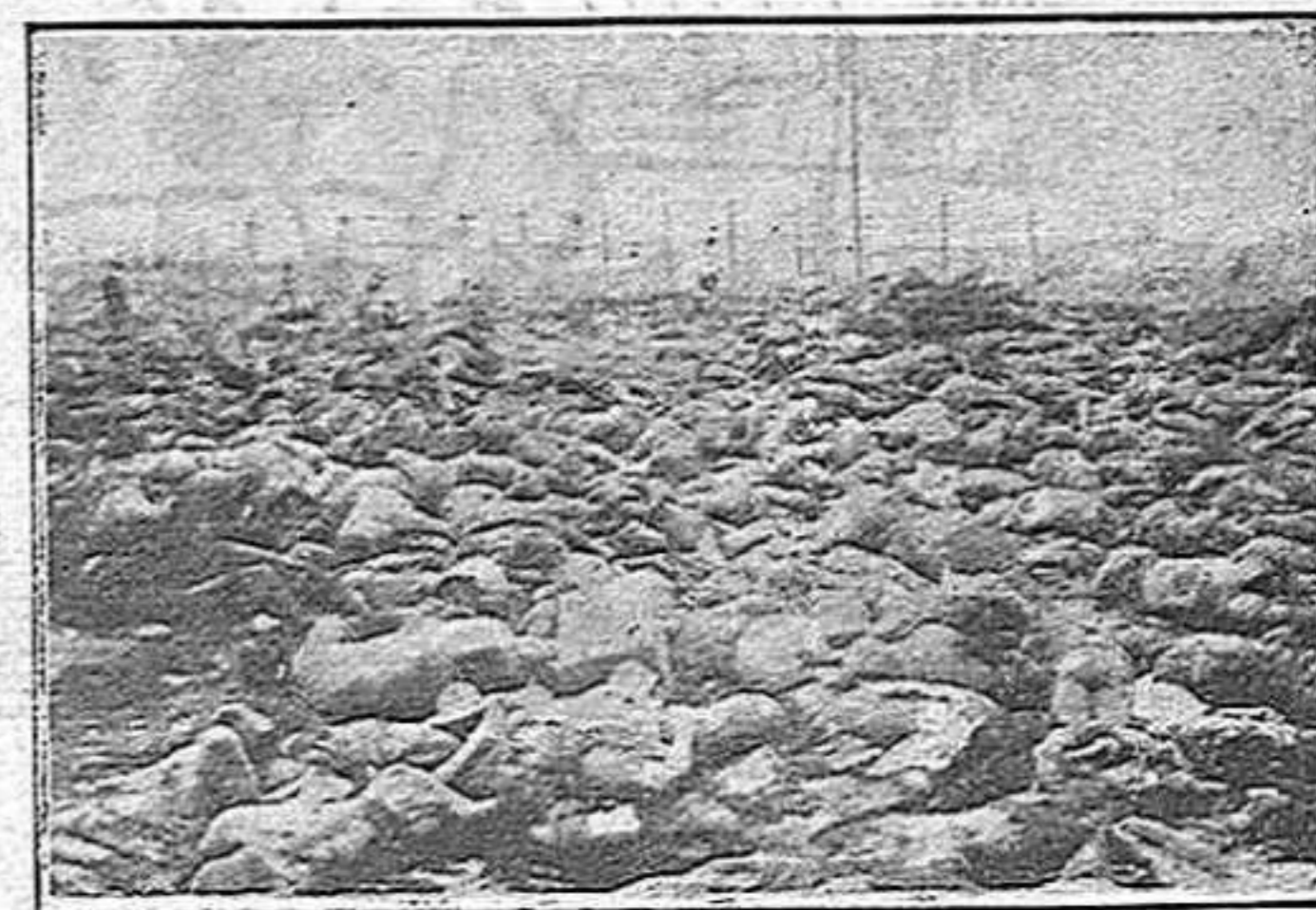
La població carbonitzada del barri de Honjo

Però aquest diantre de japonesos són atrevits de debò ja ho diuen uns quants adagis nostres