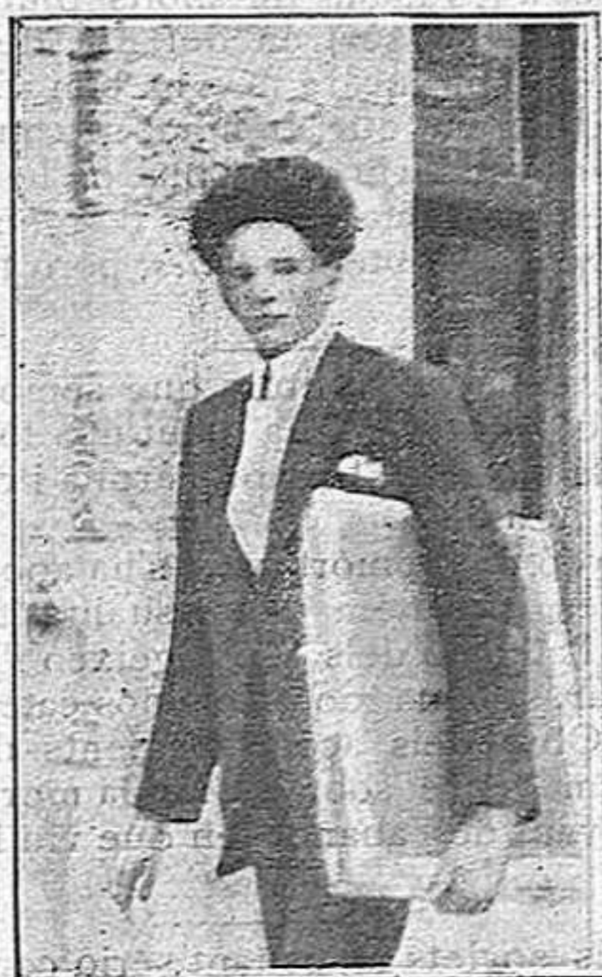
La moda capilar a Fiume

Ja sé que direu: Què té que veure tot això amb la moda capilar de Fiume? I tant, i tant! Mi-