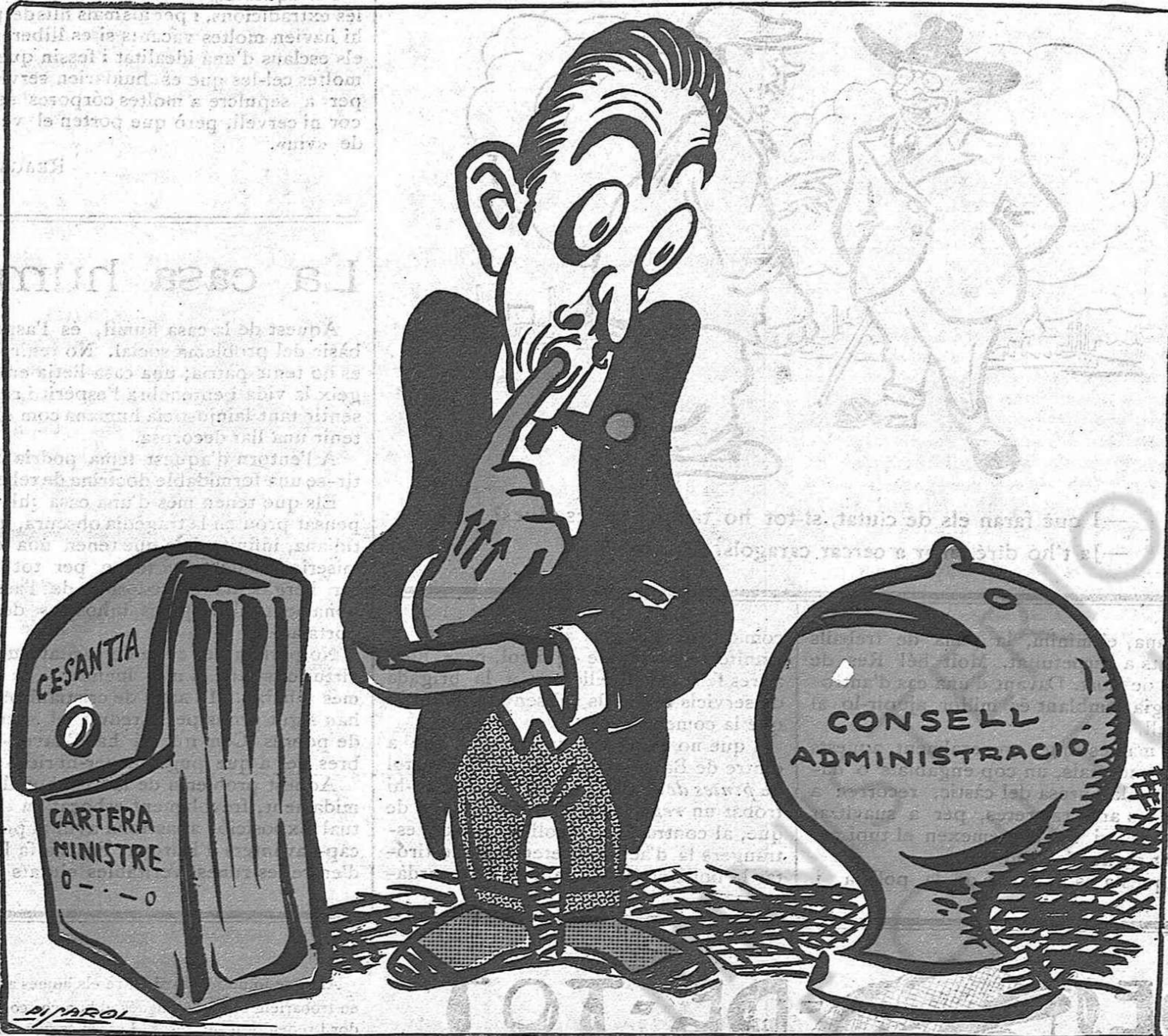
—El mal és que, ademés de no poguer ésser diputat, ni em quedarà el recurs de dedicar-me a la guardiola.