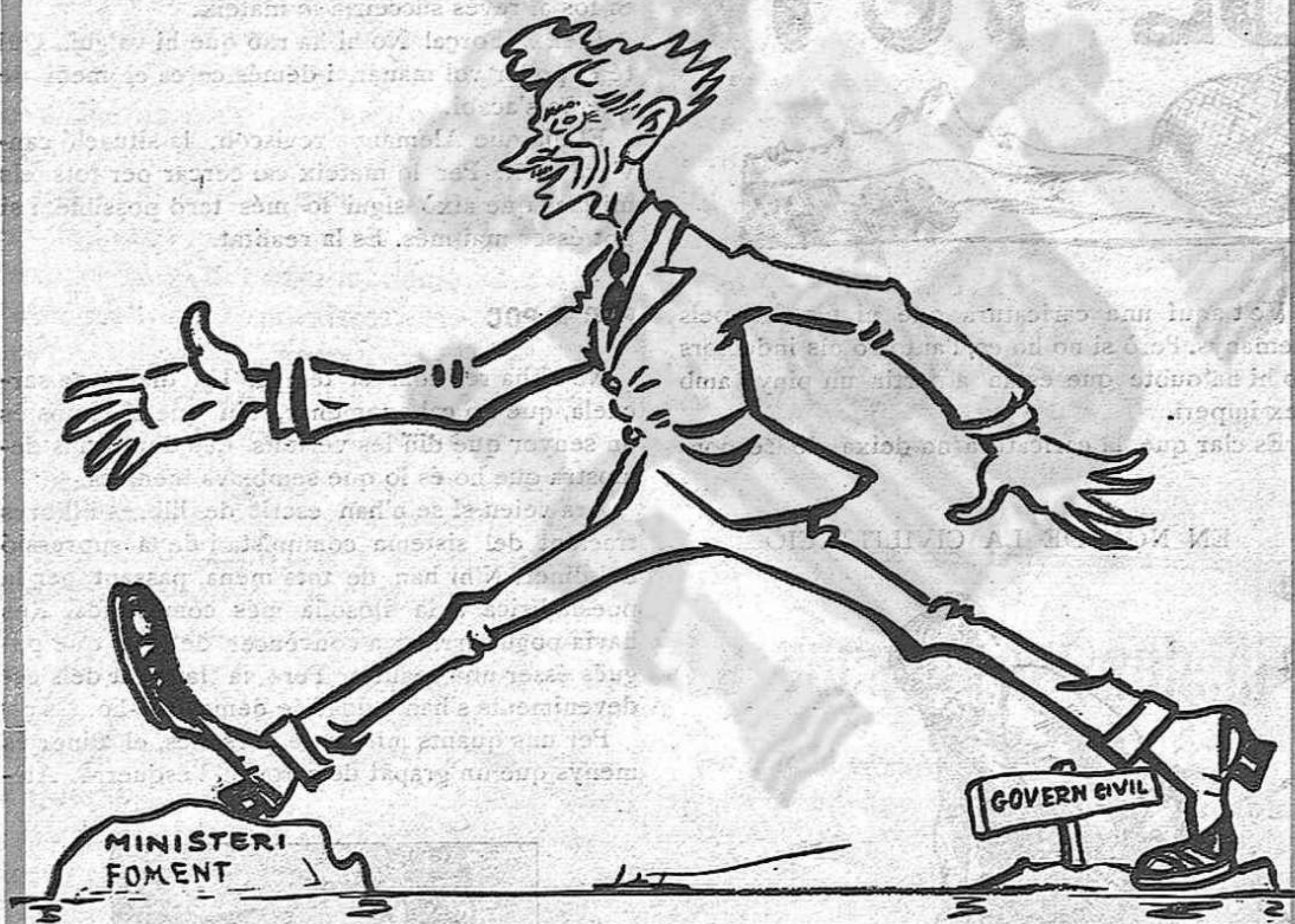
—Tranquil·litat i bons aliments... i per tot et deixo!

munt de llurs testes colrades pel fred les soleiades; però quelcom passa pel seu semblant que no és solsament el sentiment del cansanci. Parlen poc, les seves paraules són una maledicció; els ulls llueixen sinistres quan esguarden els indígenes que troben al pas. S'entreveu un profund sentiment que remou la seva ànima. Una visió que ers fereix la retina i els sentiments nostres, explica la fonda emoció dels soldats que tornen cap-cots. Damunt d'una mula, com un sac, va embolicat un home, un home jove que poques hores abans, en un moment de