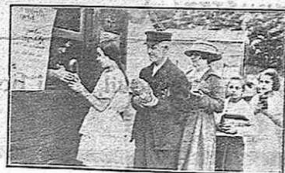
Pagant l'entrada amb espècies, ous, llegums, pa, fruites, que valen més que els marcs.

Per uns quants milers de persones, el diner és menys que un grapat de zeros a l'esquerra. Ale-