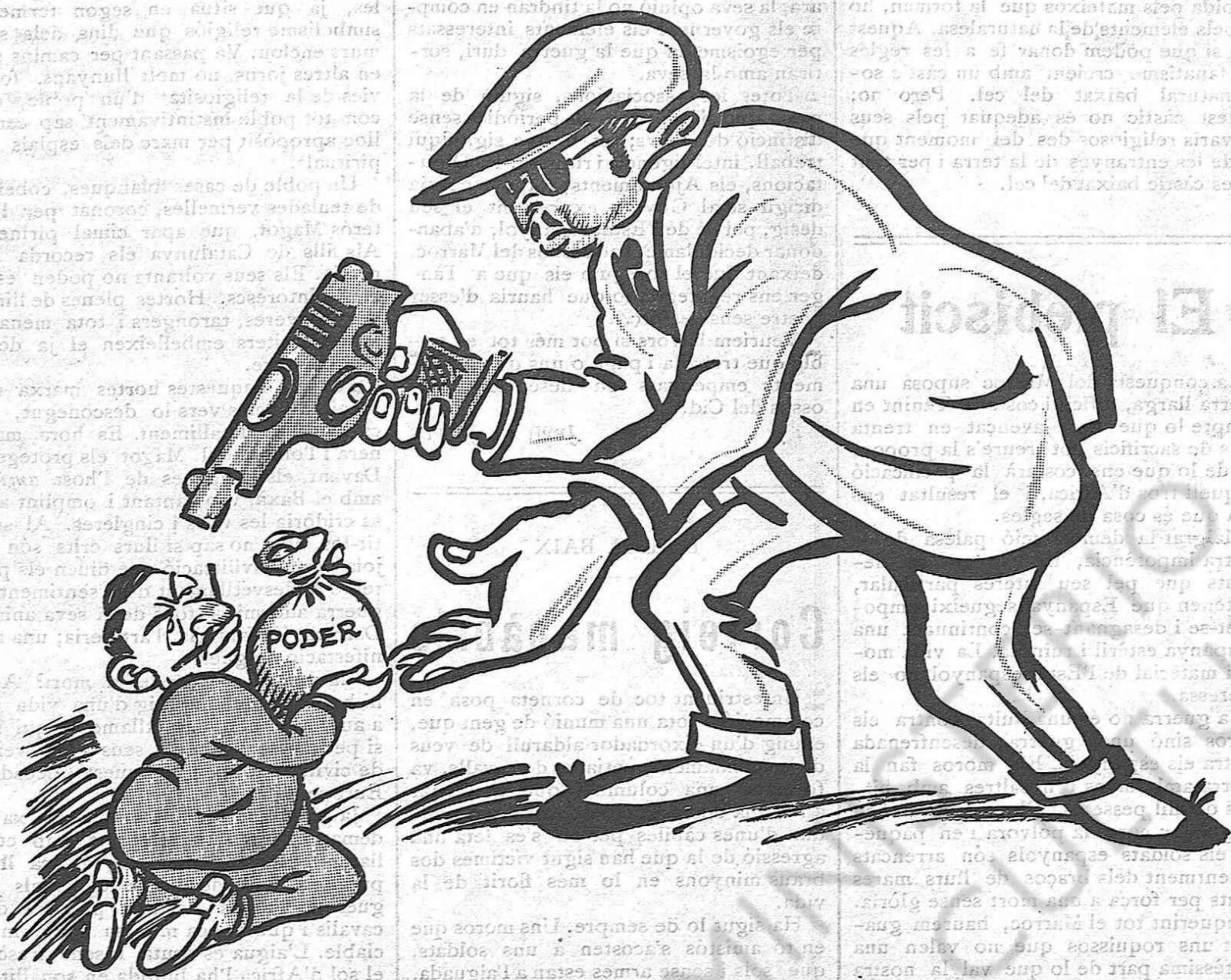
Si seguim així fins del poder es faran amos.