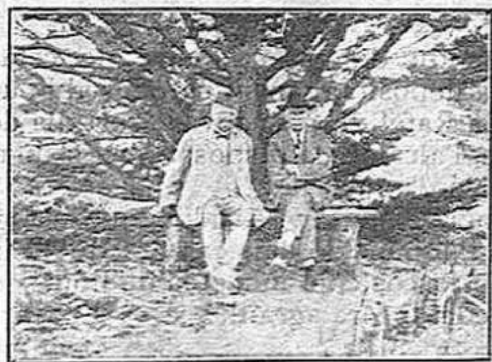
M. Clemenceau reposant amb el coronel House, sota el seu arbre predilecte, en la seva finca de Saint-Vicent-sur-jard.

An aquest home li deïen el «Tigre». La fera es sacia de sang, es revolca enmig d'un munt de des-