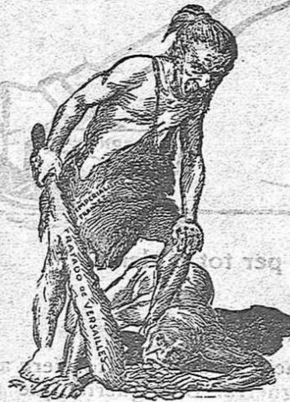
El francès vencedor.—Nosaltres defensem la humanitat.