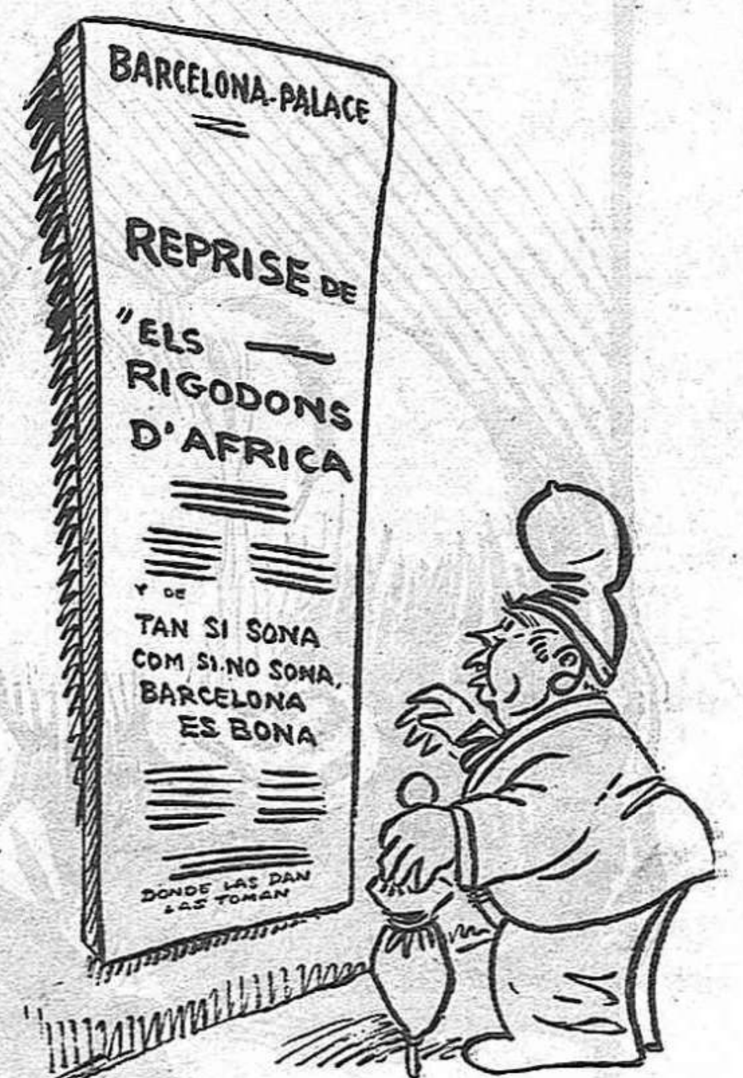
—Caram, quin éxit! I que en fa d'anys que dura al cartell aquesta obra.

El crim, cosa esgarriofosa, tot-hora es veia avorrit,