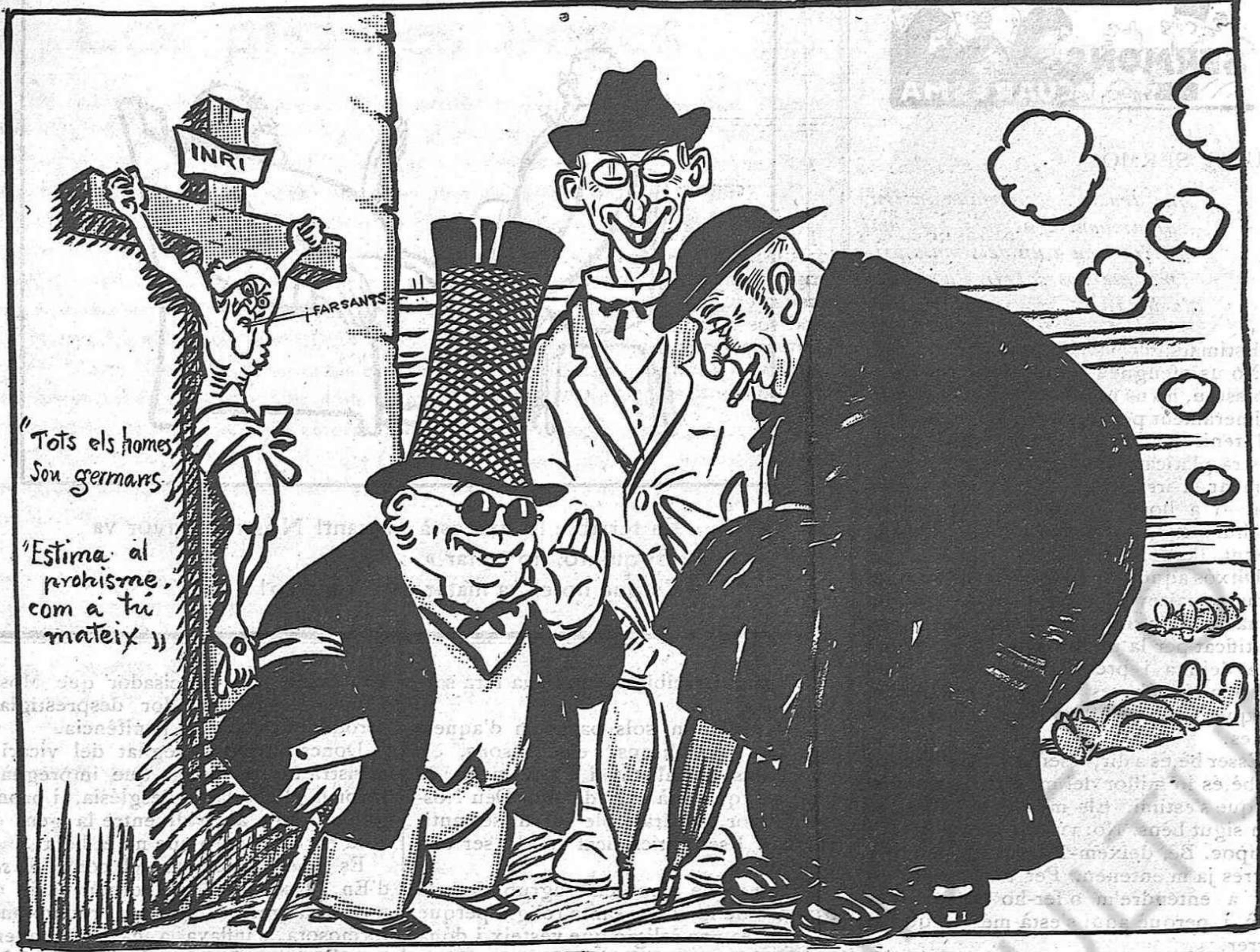
—Cregui'm, Mossèn Manel, diguin lo que vulguin les males llengües, a Barcelona avui el nostre lema és: l'actualitat: Pau, pau... i repau!

transformem del modo que'ns dona la gana. Som així, i per ara tenim el que volem en mig dels treballs d'aquest món, que és la tranquil·litat.