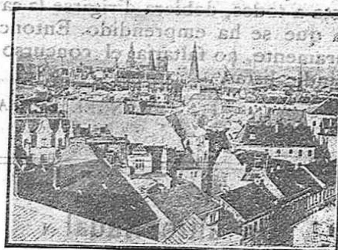
Vista general d'Essen