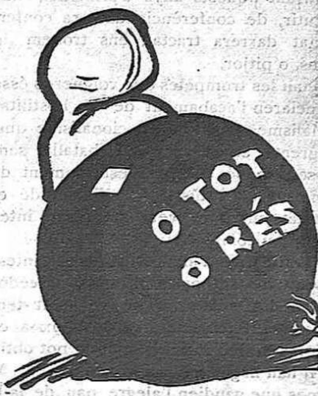
—Ara resulta que soc jo el separatista lligat!

Amb una mentalitat com la demostrada amb aquestes declaracions ja podia el senyor Raventós haver anat a la corrua dels «Tres Toms».