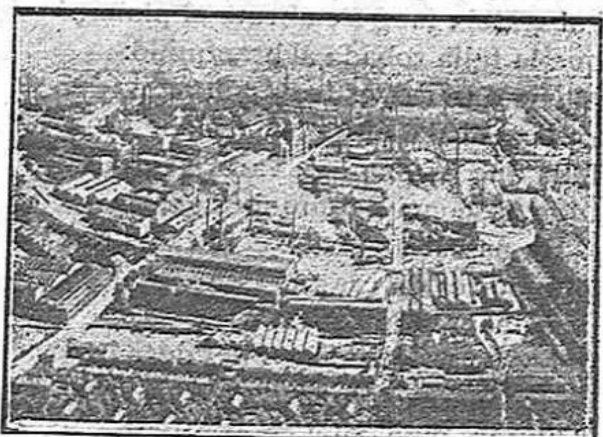
La fàbrica Krupp a Essen

dicaven la germanor universal, la pau mundial com a únic remei.