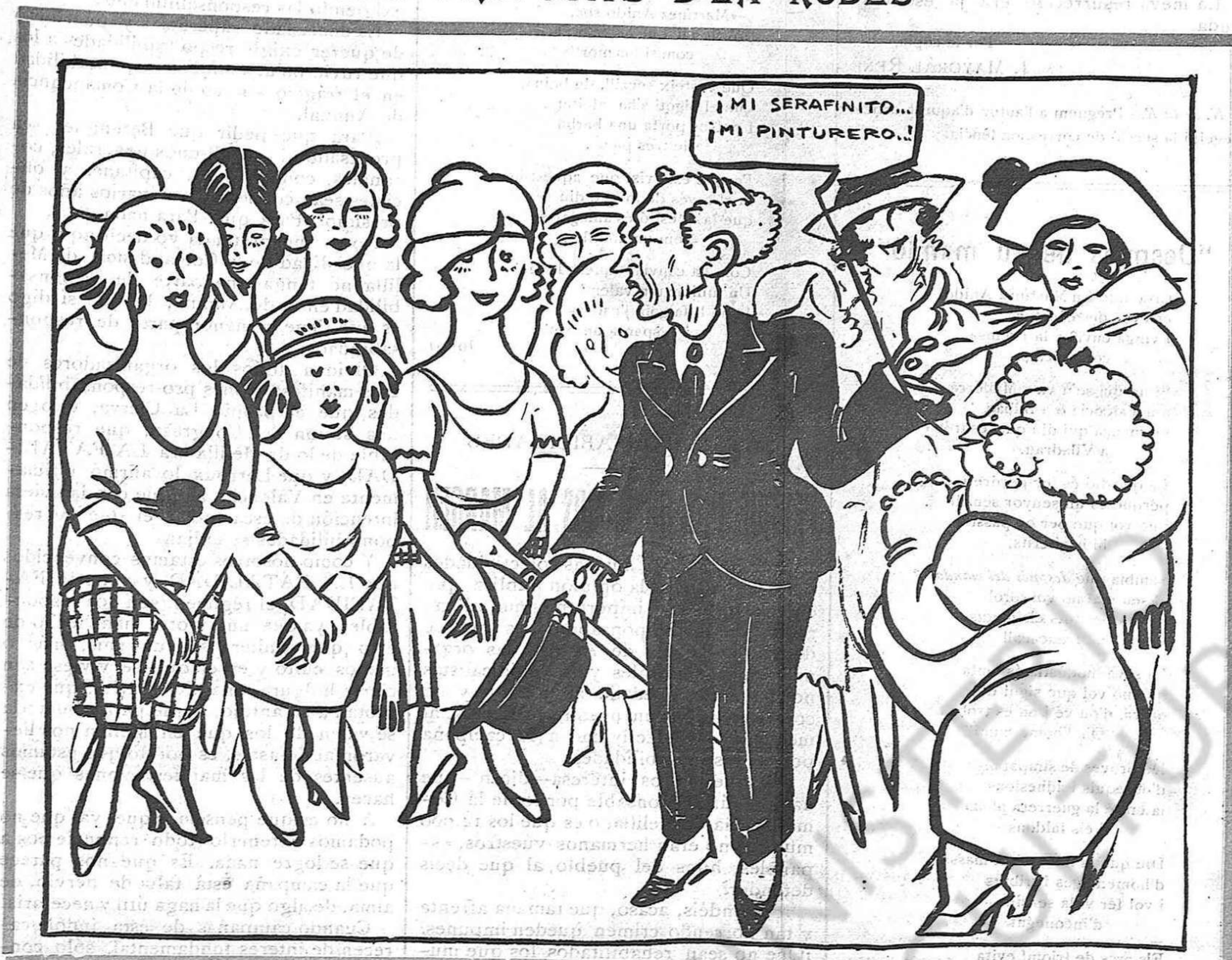
— Si fos Alt Comissari, totes vosaltres vindrieu amb mí a Melilla i la guerra s'acabaria en quatre nits.