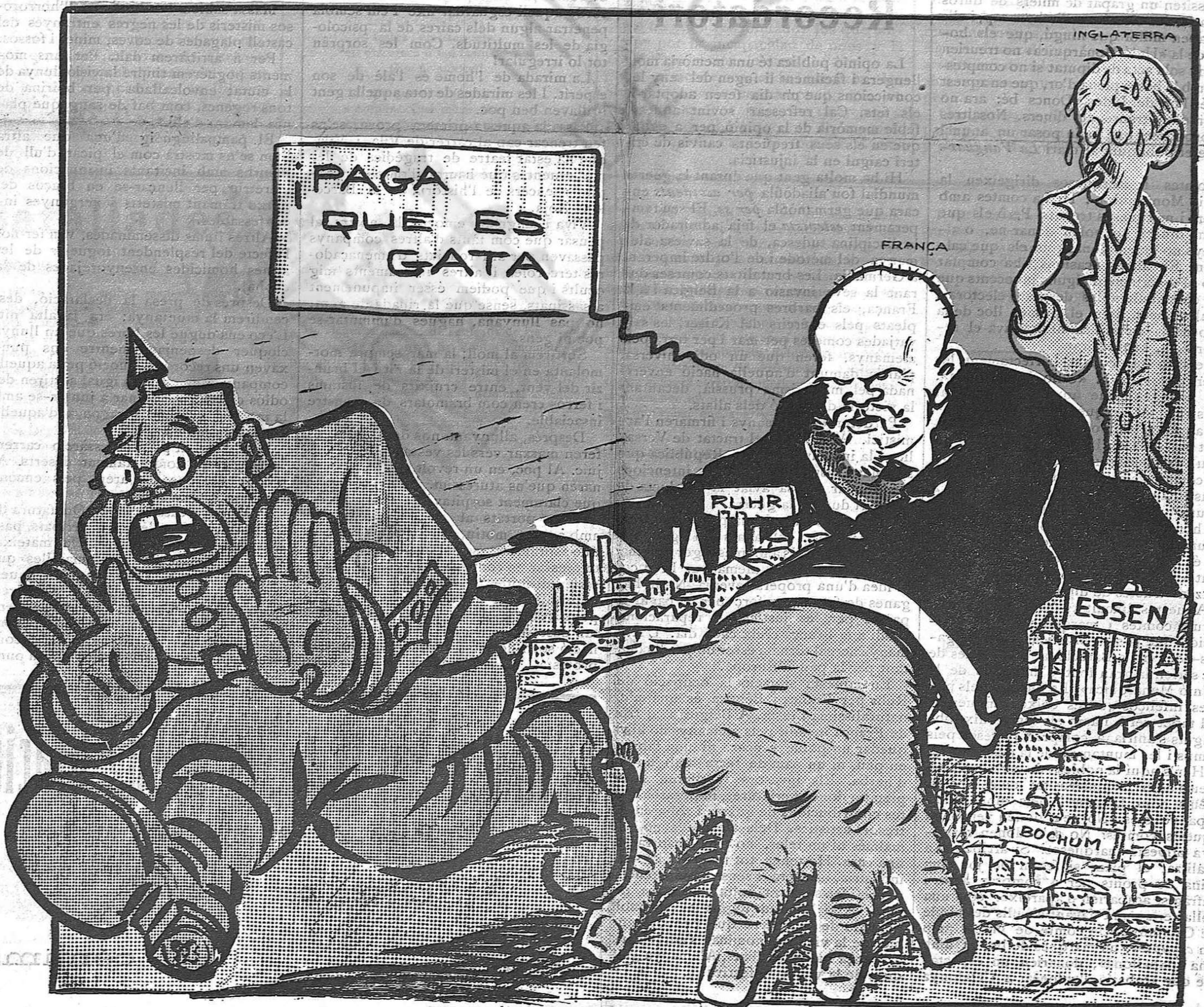
Poincaré.—Ha arribat lhora de cobrar del tros.