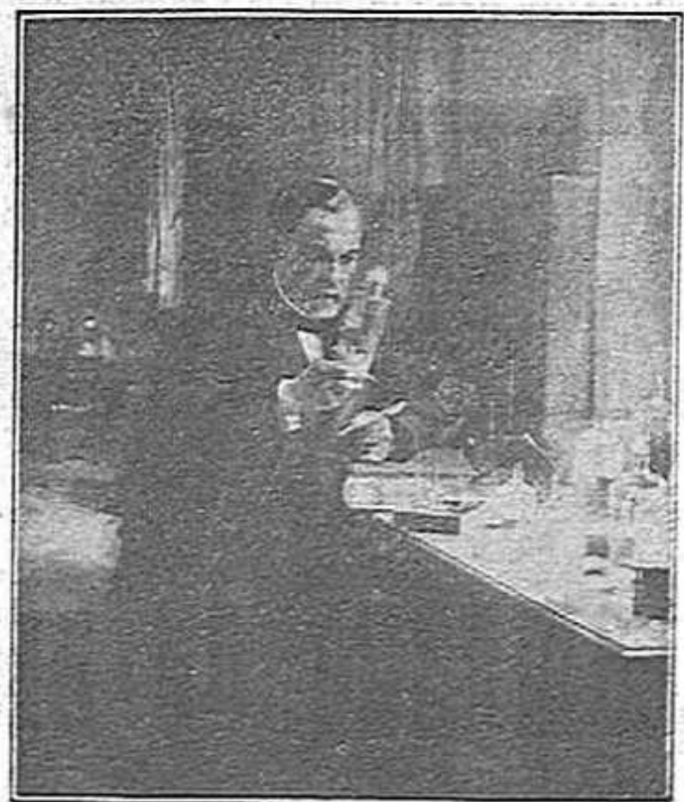
Pasteur en el laboratori