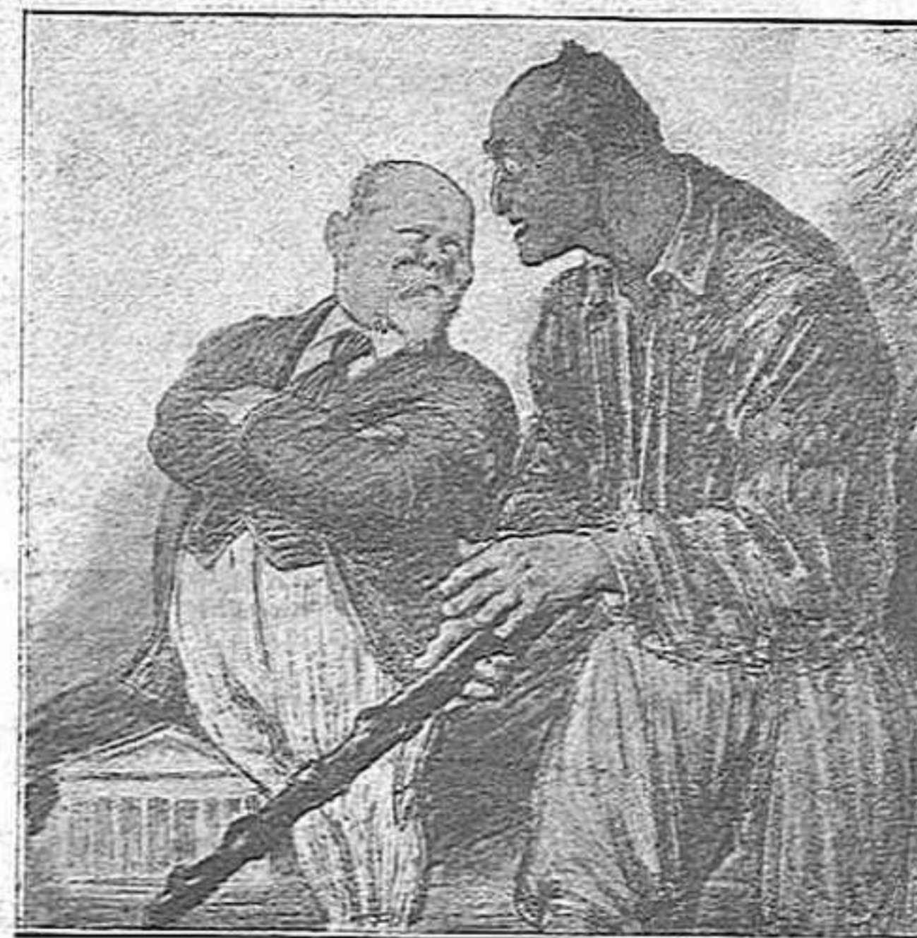
Mussolini—Jo us donaré la manera de servir-vos-en.