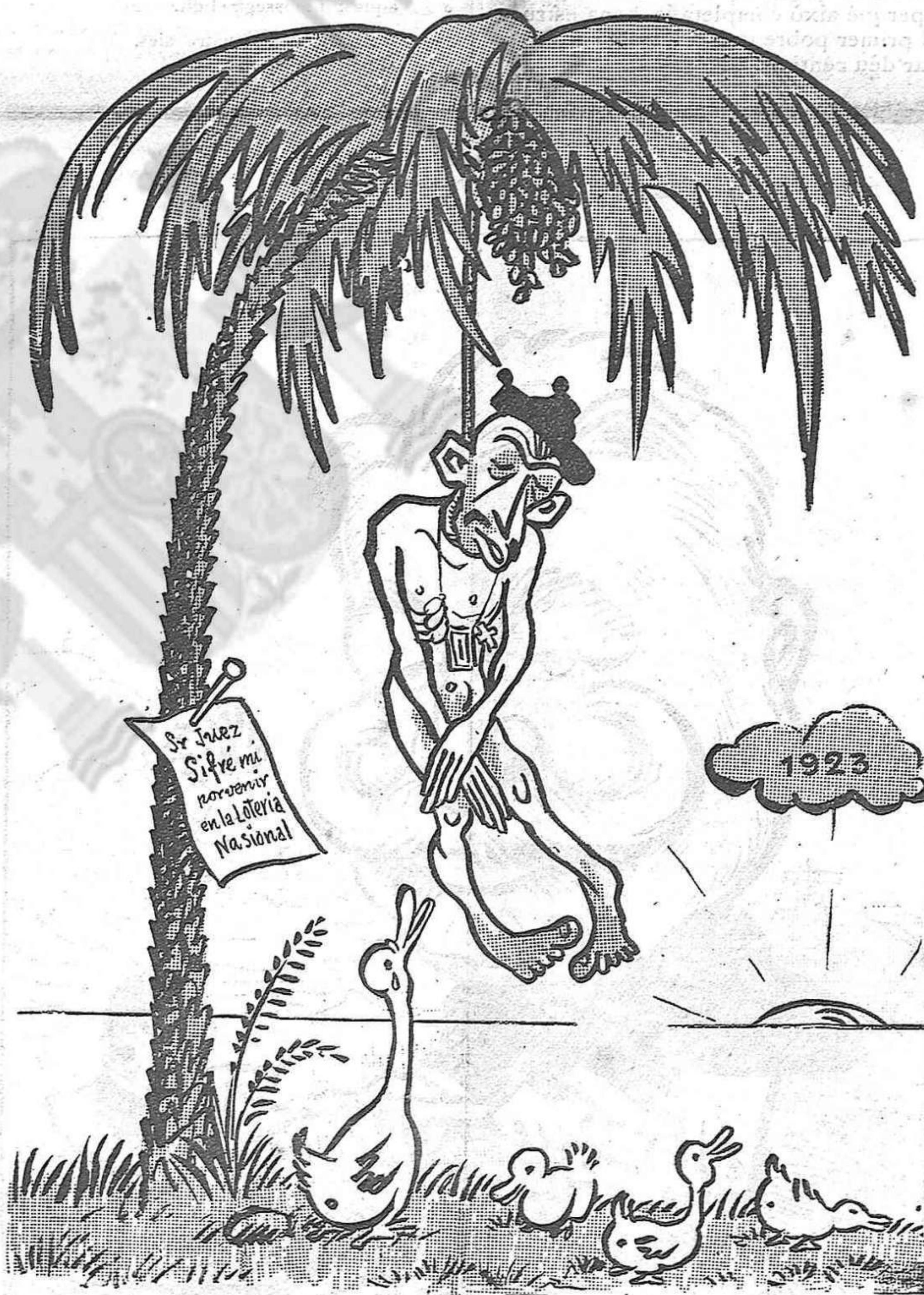
Quan s'ha perdut l'última esperança.