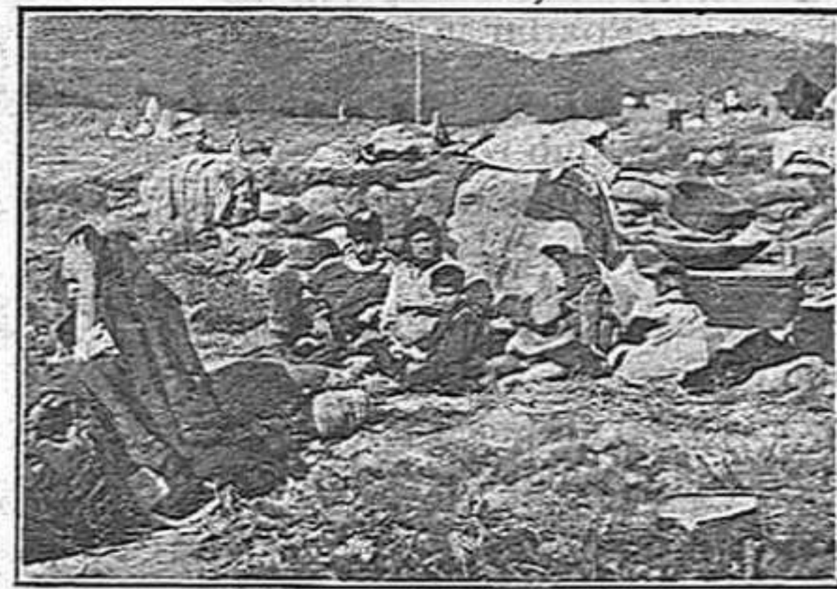
Campament de fugitius russos als voltants de Novorossisk.

Igual potser passa amb la fam. Avui segurament molts no compendrien Rússia sense famolencs.