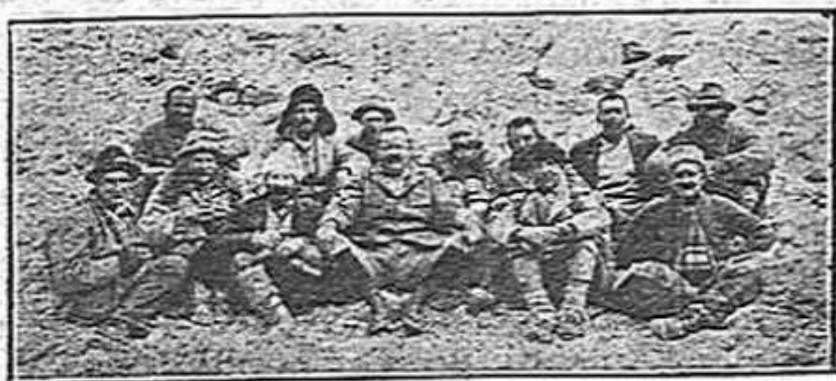
Els individus que componen l'expedició al Mont Everest.

Avui en dia, transformada l'antiga Font del Gat, desaparescuda quasi bé la típica, que és com dir esdevinguda tradicional, la nostra font de la muntanya veïna se la converteix en una mena de símbol de la llibertat pel fet de suposar quiscú que an ella anaven els nostres avis a cercar i estudiar el medi per a obtindre-la. Els nostres avis tornaren més d'una vegada de la font i no pogueren portar-se la llibertat