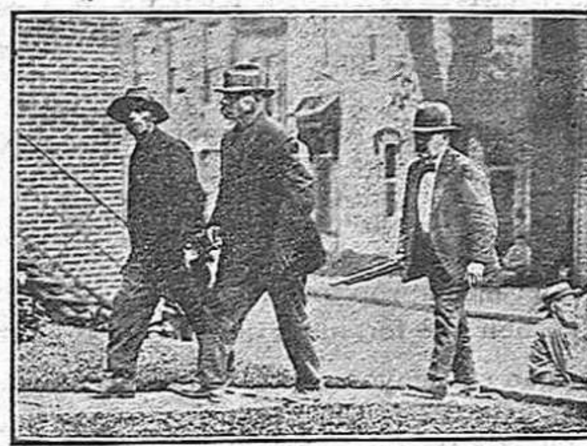
Minaires vaguistes de Pensilvània que han intentat assaltar la mina Richmond en la Virginia Occidental.

Tot ço d'aquell poble, si no sublim, se'n feia gran, com si diguessim de molta empenta. Volem dir que ens creïem que allí tot és fira a l'engrós, mai mesquinament, mai casolanament. Fonamentàvem la nostra—avui ja sabem que equivocada—opinió, en les noves que d'allí ens arriben Setze milions de vaguistes, catorze mil trens aturats, un formiguer de milions d'automòbils corrent amunt i avall. Es clar que per contrarrestar moviments de tanta importància nosaltres ja vèiem regiments complets de policia, aparellats a la moderna,