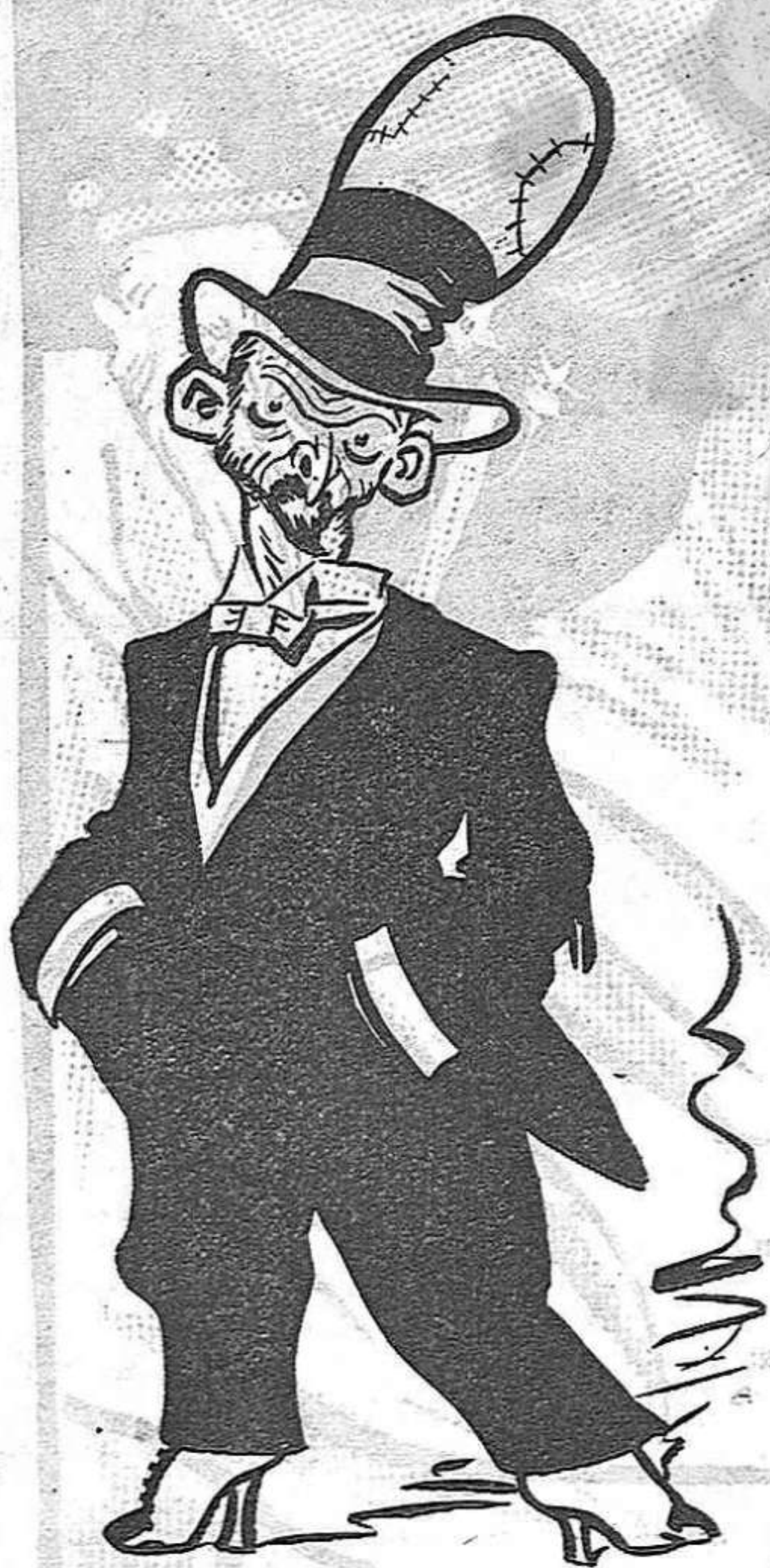
—No és que hagi deixat la barretina; és que la porto amagada dins del barret.