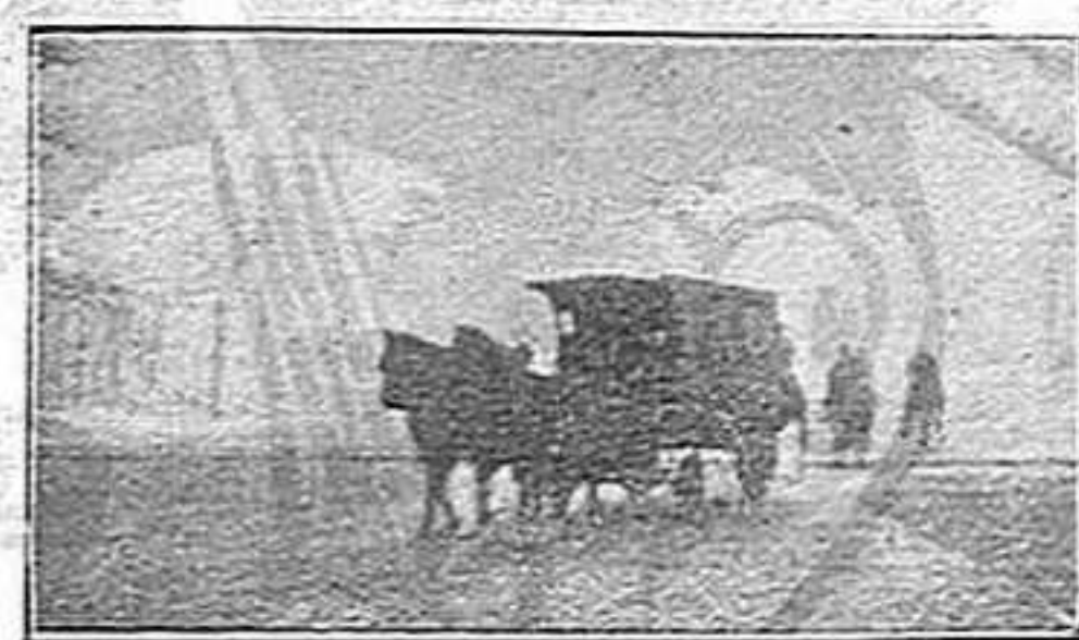
El carro trist

Posem un epíleg a la tragèdia Landré. Un carro gris, trist, passava poc després de la execució, seguit de quelques guàrdies, com si