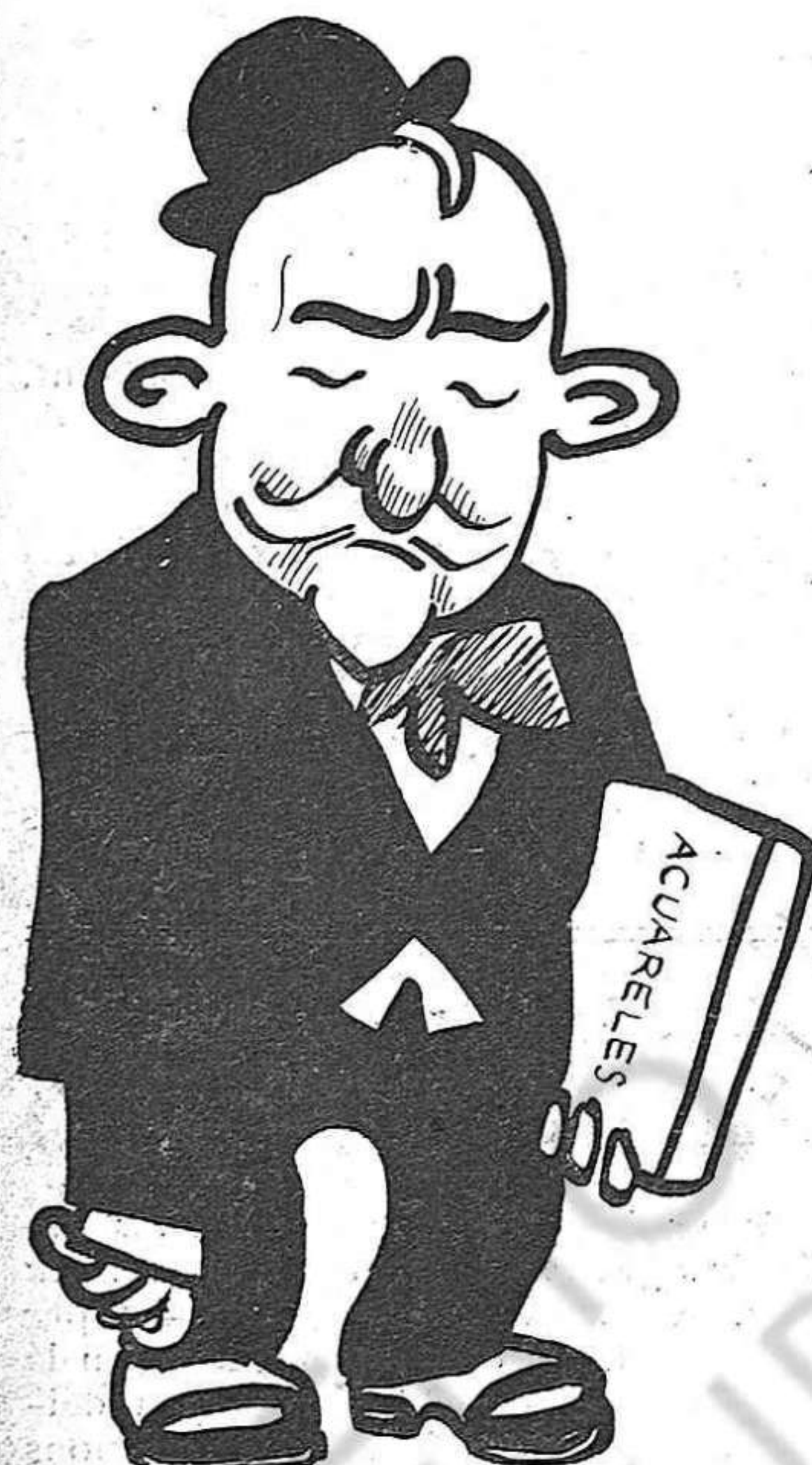
I acabarà anant-se'n a pintar la cigonya