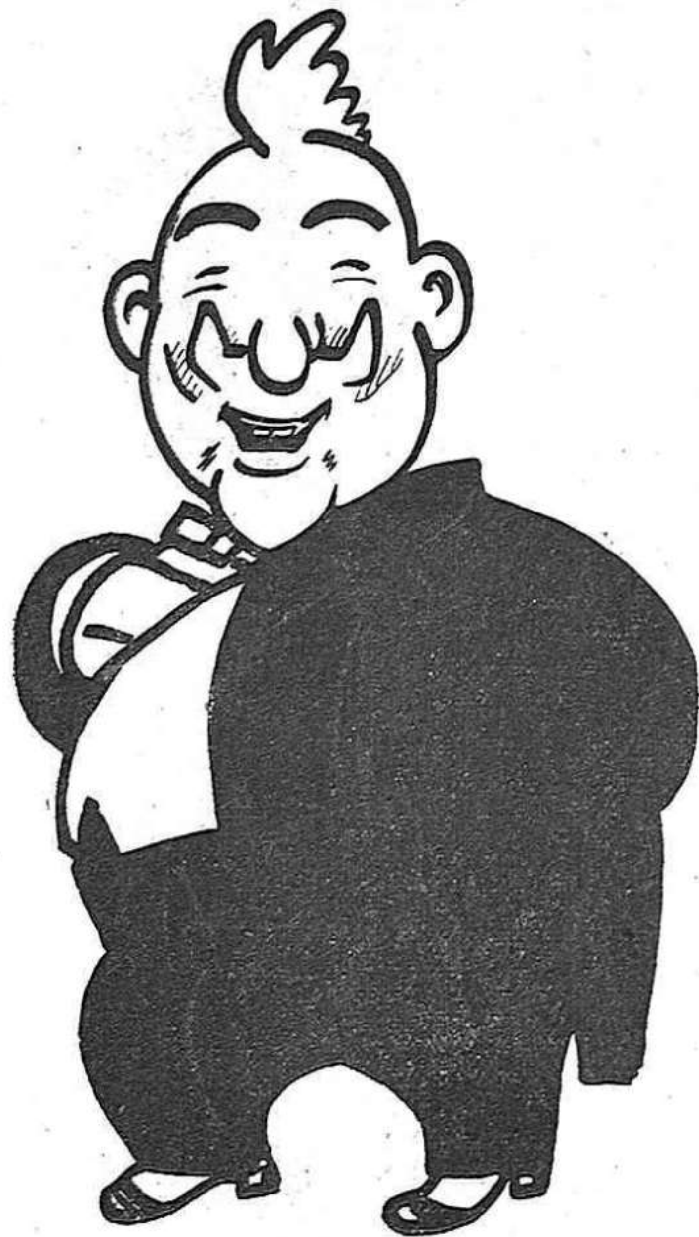
El comensa amb urc napoleònic...