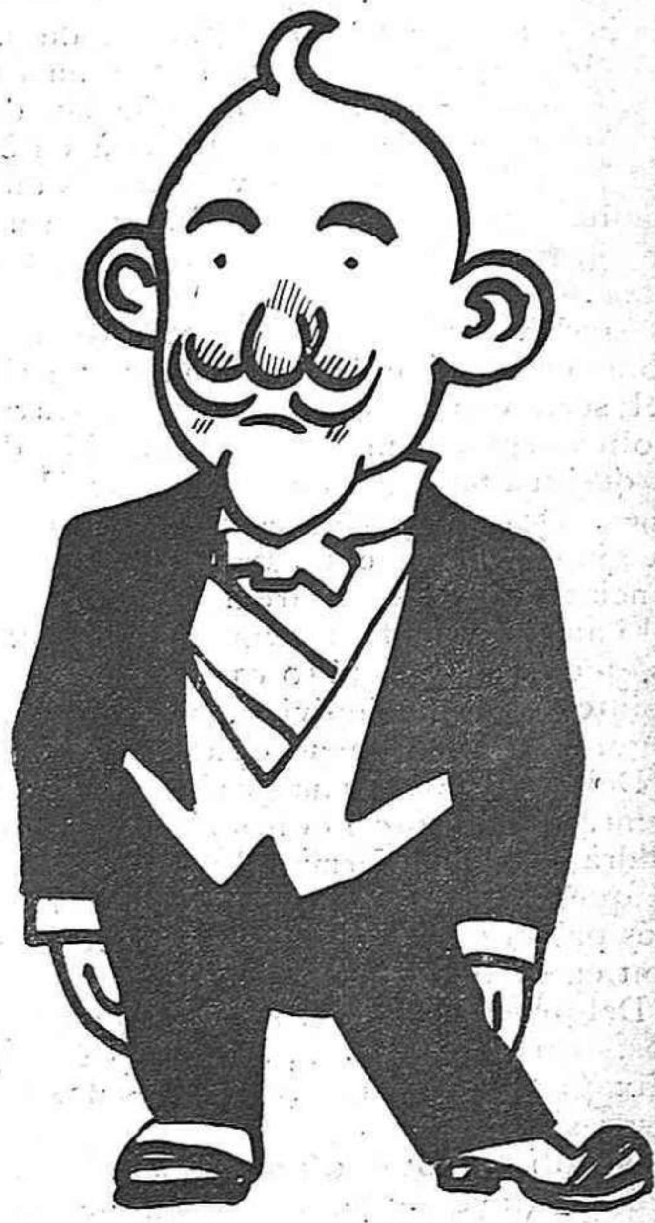
Vindran les desil·lusions...