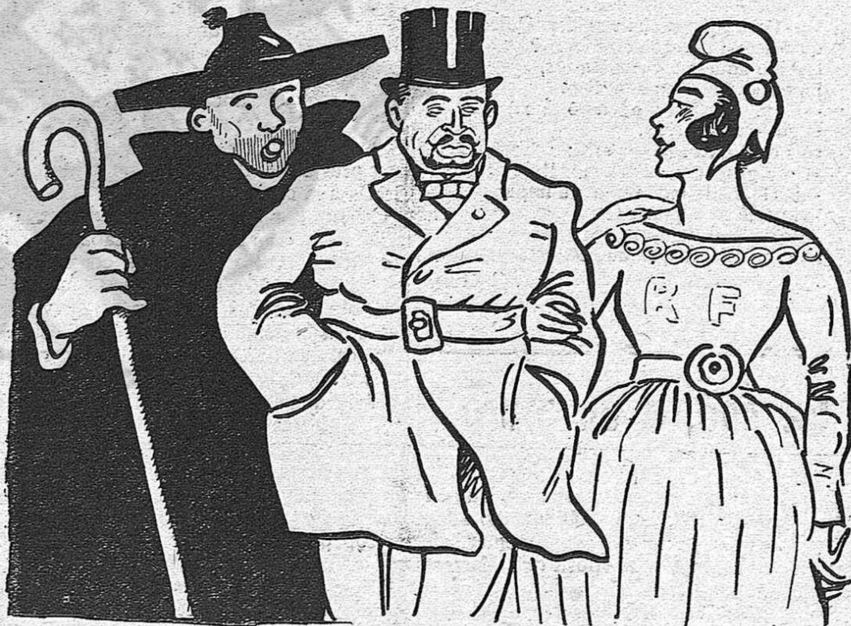
En Joan Espanyol.—Deixa'l dir, noia, que aquest soci et vol ensarronar.

Una treva que resultarà a la llarga una inevitable victòria per a la Tríplice Obrera, asseguren altres.