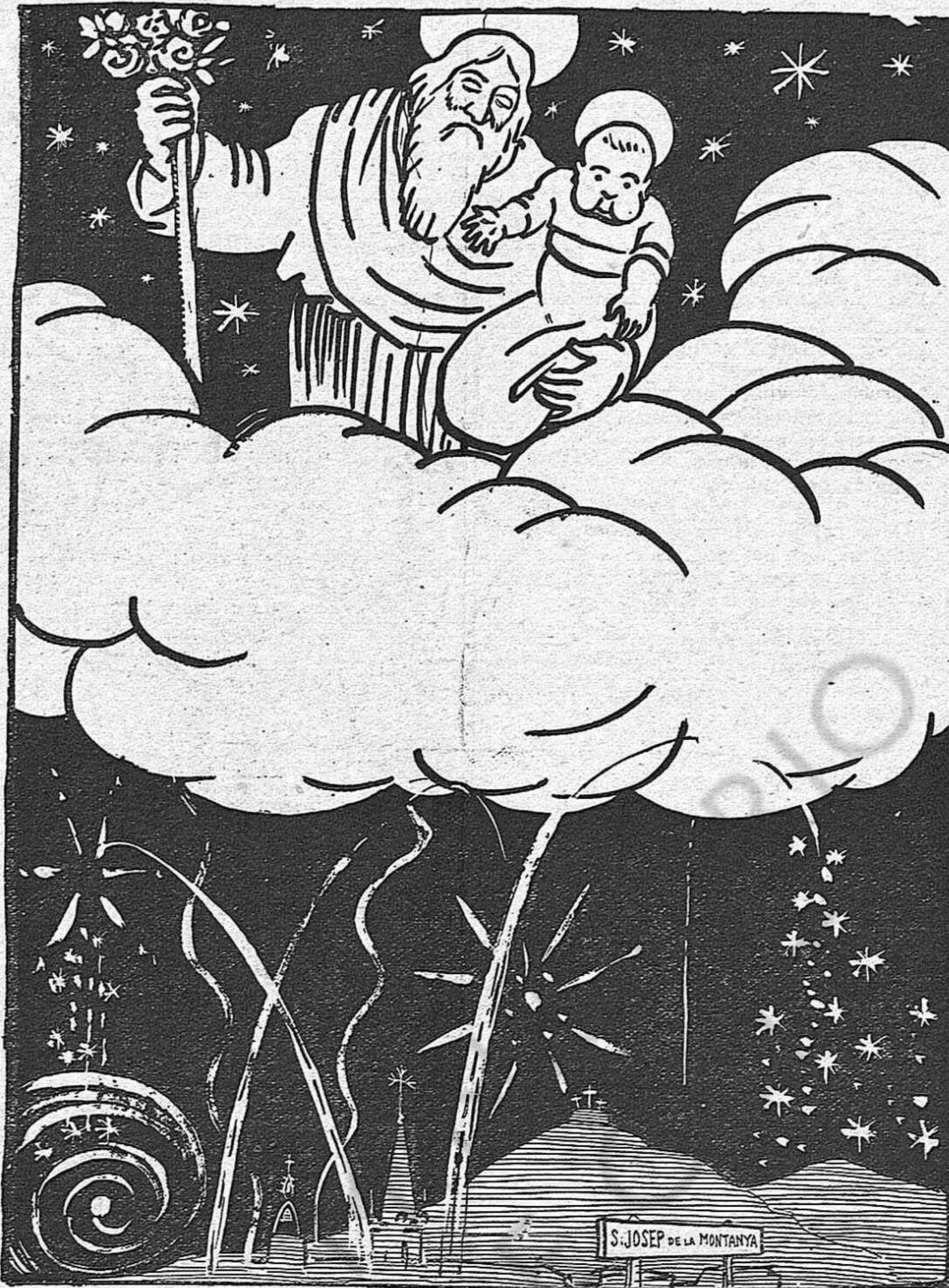
—Ve't-aquí en lo que para tot el vostre fervor cristià: en uns quants focs de artifici.