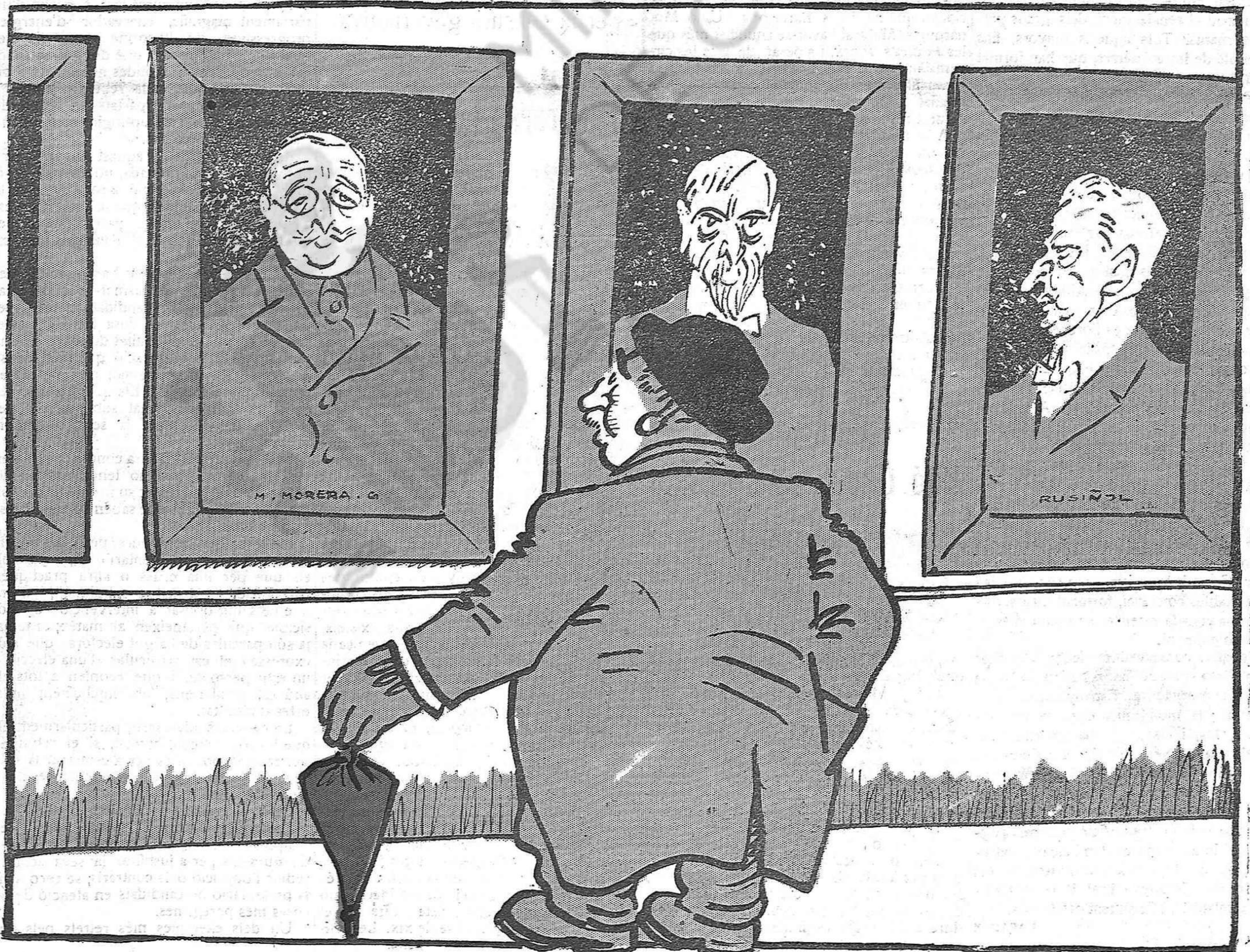
— Esperant l'Autonomia — us feu més vells cada dia