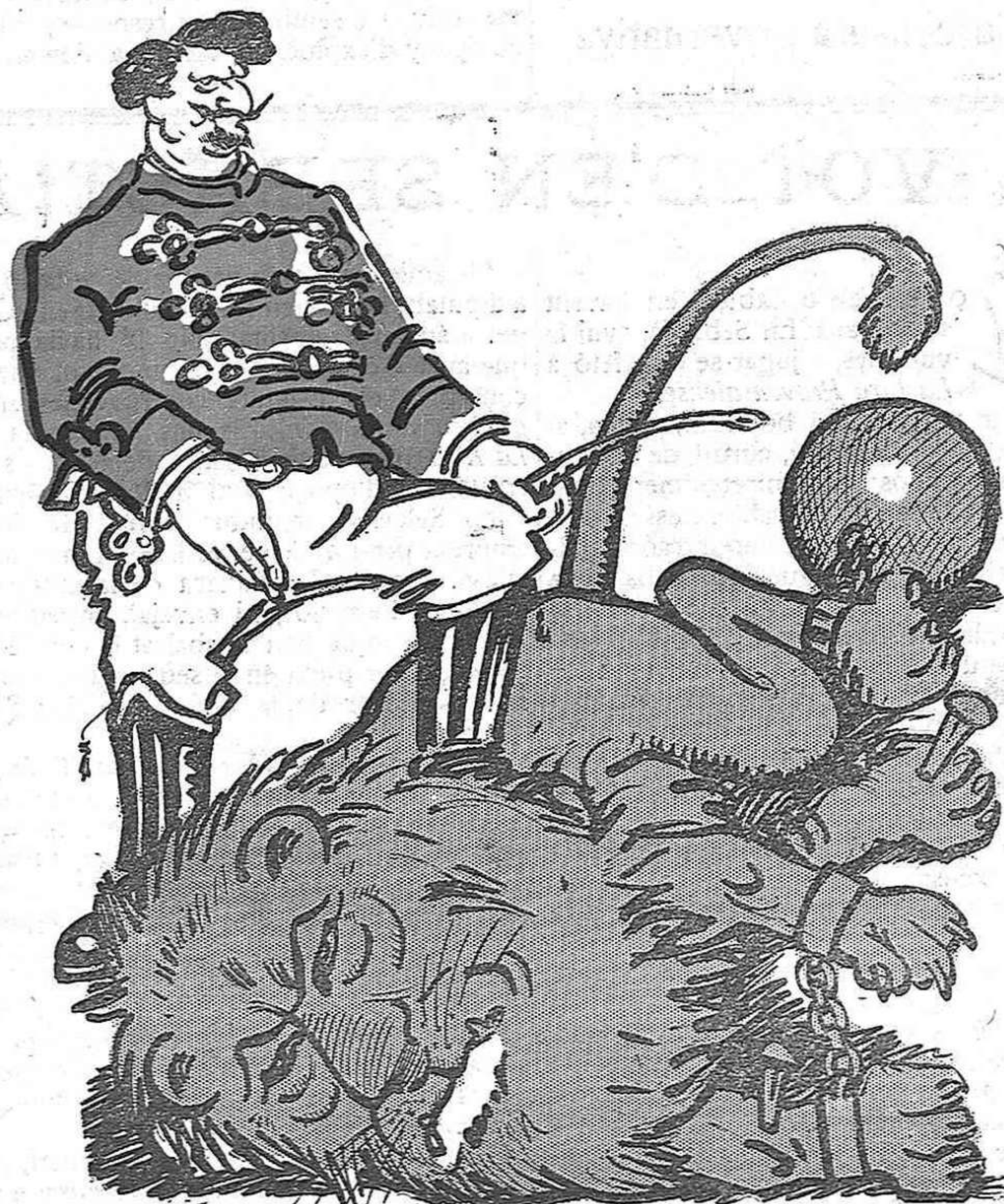
—Estimat públic, aquí et presento un nou sistema de domesticar lleons.

En premsa: ALMANAC de LA CAMPANA DE GRACIA per a 1921