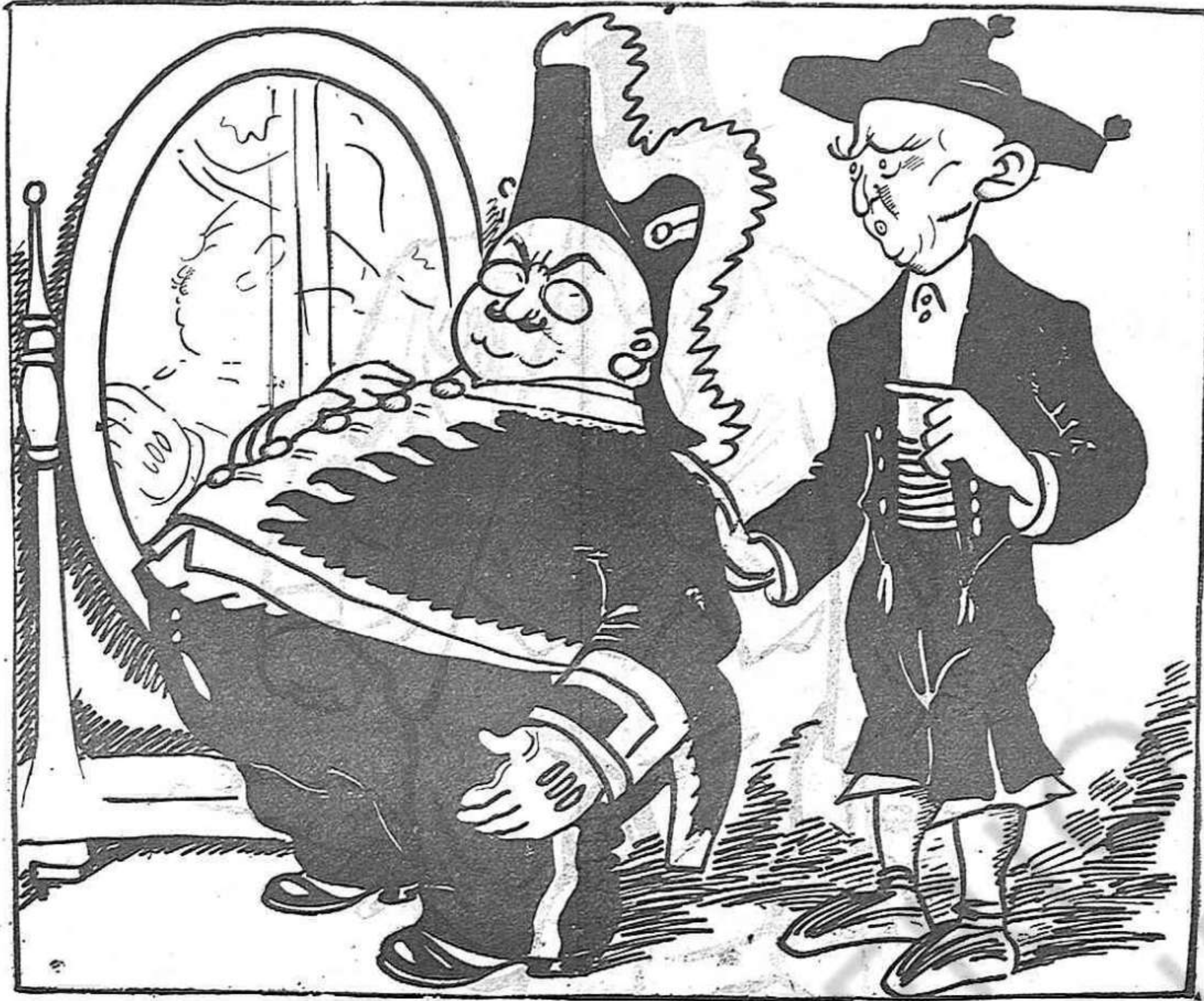
—Vol que li sigui franc? .. Em sembla que no li escaurà gens.

forçat, trist, un riure de cansament, de fàstic de viure. En aquells moments me repugnava aquella dona que devia haver estimat molt i que ara venia les seves manyagueries. Sí, aquella era la de sempre, la que estimà follament a un ingrát; la que abandonà amb goig llur virginitat en els braços de l'home volgut, que després la menyspreuà. La que, fastiguejada de tot, es llençà a la vida lliure per a oblidar, en els braços d'infinitat d'hommes, els ressons de passió llunyana. I seguia somrient amb un riure de fàstic. La compadria a l'ensempe que una força desconeguda m'impulsava a parlar-li dolçament, pregant-li que no vengués el seu cor; que no es rebaixés fins al punt de posar preu als seus peïtons. —No veus que la teva rialla és una mueca?—li deia jo.—Plora, plora les teves penes en silenci i no t'esforcis en aparentar aquesta tonta i ridícula alegria! Dedicat a evocar els records de l'home estimat, i separant-te d'aquest ambient impúdic, aixecat a la pura regió de les ànimes que viuen noblement.